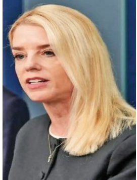
ଆର୍ଟର୍ କେନେରାଲ ବି ବହିଷ୍କୃତ

ଓଫିସ୍‌ନ, ୩୫୪(ଏକେନ୍ଦ୍ରି): ଇରାନ ଯୁଦ୍ଧରେ ବିଫଳତା ପରେ ଆମେରିକାର ରାଷ୍ଟ୍ରପତି ତୋନାଲ୍ଡ ଟ୍ରମ୍ପ ତାଙ୍କର ସବୁ ରାଗ ସେନା ମୁଖ୍ୟଙ୍କ ଉପରେ ସୁସ୍ଥକରାଯାଇଛି । ବିଫଳତା ପାଇଁ ପରୋକ୍ଷରେ ତାଙ୍କୁ ଦାୟୀ କରି ସେନା ମୁଖ୍ୟ ପଦରୁ ରେଣ୍ଡି ଜର୍ଜଙ୍କୁ ହଟାଇ ଦେଇଛନ୍ତି । ଏହାସହିତ ଏପ୍ରିଲ ଫାଇଲ ପାଇଁ ଆର୍ଟର୍ କେନେରାଲଙ୍କୁ ମଧ୍ୟ ବହିଷ୍କାର କରିଛନ୍ତି । ମାତ୍ର ୨୪ ଘଣ୍ଟା ମଧ୍ୟରେ ସେନା ମୁଖ୍ୟ ଏବଂ ଆର୍ଟର୍ କେନେରାଲଙ୍କୁ ପଦରୁ ହଟାଇଛନ୍ତି । ଇରାନ ସହ ଚାଲିଥିବା ଯୁଦ୍ଧ ମଧ୍ୟରେ ଟ୍ରମ୍ପ ଆମେରିକା ସେନା ମୁଖ୍ୟ କେନେରାଲ ରେଣ୍ଡି ଜର୍ଜଙ୍କୁ ତୁରନ୍ତ ଅବସର ଦେବାକୁ କୁହାଯାଇଛି । ଜର୍ଜଙ୍କ କାର୍ଯ୍ୟକାଳ ୨୦୨୨ରେ ଶେଷ ହେବାର ଥିଲା । କିନ୍ତୁ ଟ୍ରମ୍ପ ସରକାର ନିଜର ବିଶ୍ୱସ୍ତ ଲୋକଙ୍କୁ ସେନାର ଶୀର୍ଷ ପଦରେ ରଖିବାକୁ ଚାହୁଁଛନ୍ତି । ସେହିପରି ଦେଶର ଆର୍ଟର୍ କେନେରାଲ ଫ୍ୟାମ୍ ବଣ୍ଡିଙ୍କୁ ମଧ୍ୟ ବହିଷ୍କାର କରାଯାଇଛି । କୁହାଯାଇଛି ଯେ, ବଣ୍ଡି 'ଏପ୍ରିଲ ଫାଇଲ୍' ମାମଲାକୁ ଠିକ୍ ଭାବେ ପରିଚାଳନା କରିପାରି ନଥିଲେ । ଲୋକଙ୍କ ଆଶା ଥିଲା ଯେ ଏହି ଫାଇଲକୁ କିଛି ବଡ଼ ରହସ୍ୟ ଖୋଲିବ, କିନ୍ତୁ ବଣ୍ଡିଙ୍କ ଦ୍ୱାରା କାରି ତଥ୍ୟରେ କିଛି ନୂଆ ନଥିଲା, ଯାହାକୁ ସରକାରଙ୍କୁ ଅନୁଧ୍ୟାୟ ପକାଇଥିଲା । ଏବେ କଥା ଉଠୁଛି ଯେ କାହିଁକି ଏହି ନିଷ୍ପତ୍ତି ନିଆଗଲା? ରିପୋର୍ଟ ଅନୁଯାୟୀ ରାଷ୍ଟ୍ରପତି ଟ୍ରମ୍ପ ଏବଂ ଯୁଦ୍ଧ ସଚିବ ପିଟ୍ ହେଗସେଥ ସେନାକୁ ନିଜର ନୂତନ