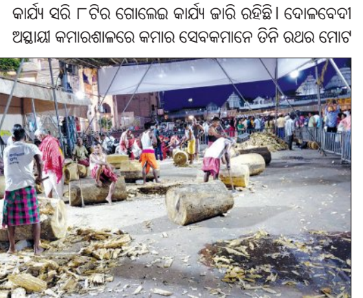
କାର୍ଯ୍ୟ ସରି ୮ଟି ଗୋଲେଇ କାର୍ଯ୍ୟ ଜାରି ରହିଛି। ଦୋଳବେଦୀ ଅଭ୍ୟାସ କମାରଖାଳରେ କମାର ସେବକମାନେ ତିନି ରଥର ମୋଟ...