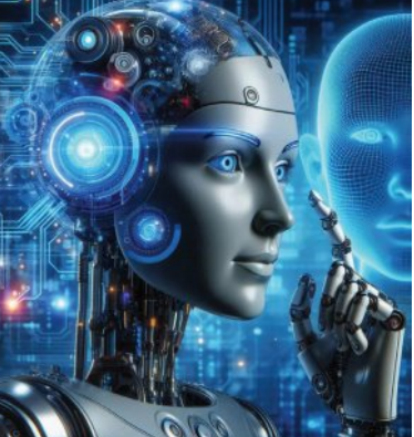
କର୍ମଚାରୀ ଛଟେଇ କରିଛନ୍ତି। କମ୍ପାନୀଗୁଡ଼ିକର ଲାଭ ବି ସେହି ଅନୁସାରେ ହେଉଛି। ହେଲେ ଟେକ୍ନୋଲୋଜିର ଅବଧି ପ୍ରଦେଶ ଲୋକଙ୍କୁ ଚାକିରି ଖାଇଯାଇଛି। ଆଇଟି ଶିକ୍ଷଣରେ ବର୍ତ୍ତମାନର ଛଟେଇ

■ ନୂଆଦିଲ୍ଲୀ, ୨୪୪୪ (ଏକେଡି): ୨୦୨୨ ଆଇଟି ଶିକ୍ଷା ପାଇଁ ସରକାରଙ୍କ ନିର୍ଦ୍ଦେଶ ଅନୁଯାୟୀ ଯୋଜନା କାରଣ ଏଆଇ ଯୁଗରେ ଟେକ୍ନୋଲୋଜି ଶିକ୍ଷଣ ଏକ ବଡ଼ ନିୟୁତ୍ତ ସଙ୍କଟ ଦେଖାଦେଇଛି। ଚଳିତବର୍ଷ ଆଇଟି ଶିକ୍ଷଣ ବ୍ୟାପକ ଛଟେଇ ଜାରି ରହିଛି। ୨୦୨୨ରେ ଏ ପର୍ଯ୍ୟନ୍ତ ଶିକ୍ଷଣରେ ୭୩,୦୦୦ ରୁ ଅଧିକ କର୍ମଚାରୀ ଛଟେଇ ହୋଇଛନ୍ତି। ଅର୍ଥପ୍ରସିଧାଳ ଇଣ୍ଡିଆନ୍ ଟେକ୍ନୋଲୋଜି (ଏଆଇ) ଏବଂ ଅଗୋପେସର୍ ଏହାର ଏକ ପ୍ରମୁଖ କାରଣ। ବର୍ତ୍ତମାନ ଟେକ୍ନୋଲୋଜି ଖର୍ଚ୍ଚ କାର୍ତ୍ତ ଉପରେ ଧ୍ୟାନ ଦେଇଛନ୍ତି। ଆହୁରିମଧ୍ୟ ଗତ ମାସକ ଭିତରେ ଟେକ୍ନୋଲୋଜି କମ୍ପାନୀଗୁଡ଼ିକରେ ଅନେକ ପରିବର୍ତ୍ତନ ହୋଇଛି। କମ୍ପାନୀଗୁଡ଼ିକ ଏଆଇ ଟେକ୍ନୋଲୋଜିରେ କୋଟି କୋଟି ଅର୍ଥ ନିବେଶ କରୁଥିବାବେଳେ ଶ୍ରମବଳ ହ୍ରାସ କରୁଛନ୍ତି। ଓରାକଲ୍, ମେଟା ଓ ମାଇକ୍ରୋସଫ୍ଟ ଭଳି କମ୍ପାନୀ ଗତ ମାସକ ମଧ୍ୟରେ ୪୬,୭୫୦