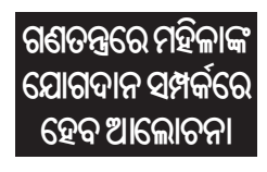
ଗଣତନ୍ତ୍ରରେ ମହିଳାଙ୍କ ଯୋଗଦାନ ସମ୍ପର୍କରେ ହେବ ଆଲୋଚନା

■ ଭୁବନେଶ୍ୱର, ୨୪୪୪ (ସମ୍ପାଦକ): ଆସନ୍ତା ୩୦ ତାରିଖରେ ଓଡ଼ିଶା ବିଧାନସଭାର ଦିନିକିଆ ସ୍ୱତନ୍ତ୍ର ଅଧିବେଶନ ଅନୁଷ୍ଠିତ ହେବ। ଭାରତୀୟ ଗଣତନ୍ତ୍ରରେ ମହିଳାଙ୍କ ଯୋଗଦାନ ସମ୍ପର୍କରେ ଅଧିବେଶନରେ ଦିବସଦ୍ୱାରା ଆଲୋଚନା ହେବ। ଏ ନେଇ ବିଧାନସଭା ସଚିବାଳୟ ପକ୍ଷରୁ ଗୁରୁବାର ସୂଚନା ପ୍ରଦାନ କରାଯାଇଛି। ଦିନ ୯ ଟାରେ ସଂସଦରେ ମହିଳା ସଂରକ୍ଷଣ ବିଲ୍ ଫରଣ୍ଡା ବିଲ୍ ଖାଲଦା ପରେ ବିଜେପି ଏହାକୁ ରାଜନୈତିକ ପ୍ରସଙ୍ଗ କରିଛି। ଦେଶବାସୀଙ୍କୁ ବିଜେପି ପକ୍ଷରୁ ଜନ ଆନ୍ଦୋଳନ ସମାବେଶ କରାଯିବା ସହ ବିଲ୍ ପାରିତ ନ ହେବା ନେଇ ବିରୋଧୀଙ୍କୁ ଦୋଷ ଦିଆଯାଇଛି। ଅପରପକ୍ଷ ମହିଳା ସଂରକ୍ଷଣ ବିଲ୍ ଆଇନରେ ସାମା ପୁନଃନିର୍ଦ୍ଧାରଣ ବିଲ୍ ଆଣି ଏହାକୁ ପାରିବାକୁ ବିଜେପି ଶତ୍ରୁଯତ୍ନ ରଚିଥିବା ଅଭିଯୋଗ କରି ବିରୋଧୀ କଡ଼ା ସମାଲୋଚନା କରୁଛନ୍ତି। ୨୦୨୩ ମସିହାରେ ସଂସଦରେ ମହିଳା ସଂରକ୍ଷଣ ବିଲ୍ ୧୫/୪-୧