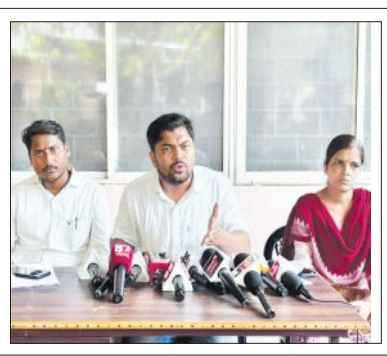
ପ୍ରାୟ ୫୦ ଶ୍ରେଣୀରେ ପକ୍ଷ ରଖି ନାହାନ୍ତି ସରକାର