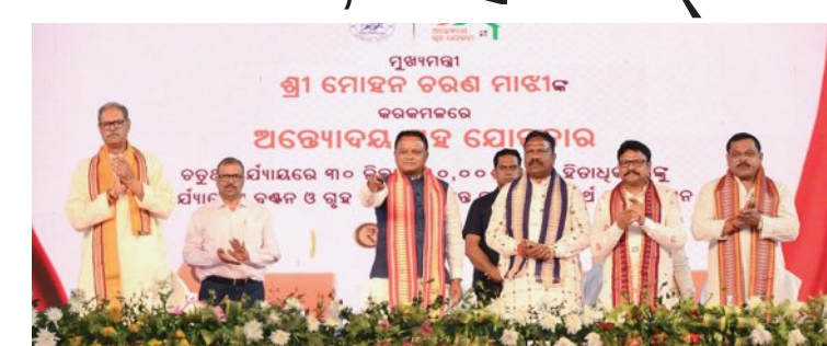
ଅନ୍ତୋଦୟ ଗୃହ ଯୋଜନାରେ ୫୦ ହଜାରରୁ ଊର୍ଦ୍ଧ୍ୱ ହିତାଧିକାରୀଙ୍କୁ କାର୍ଯ୍ୟାଦେଶ

■ ବଲାଙ୍ଗୀର, ୨୩୪୪ (ସମ୍ପାଦକ): ବଲାଙ୍ଗୀରରେ ହେବ ଚିନି କଳ, ସ୍ଥାପନ ହେବ ଟେକ୍ସଟାଇଲ୍ ପାର୍କ। ବଲାଙ୍ଗୀରଠାରେ ରାଜ୍ୟସଭାର ଜାତୀୟ ପଞ୍ଚାୟତିରାଜ ପାର୍କ କାର୍ଯ୍ୟକ୍ରମରେ ଯୋଗ ଦେଇ ଏହା ଘୋଷଣା କରିଛନ୍ତି ମୁଖ୍ୟମନ୍ତ୍ରୀ ମୋଦୀ ମାତ୍। ଏହି ଅବସରରେ ଅଧିକାରୀଙ୍କୁ ଗୃହ ଯୋଜନାରେ ୫୦ ହଜାର ହିତାଧିକାରୀଙ୍କୁ ମଧ୍ୟ ମୁଖ୍ୟମନ୍ତ୍ରୀ କାର୍ଯ୍ୟାଦେଶ ଦେଇଛନ୍ତି। ମୁଖ୍ୟମନ୍ତ୍ରୀ କହିଛନ୍ତି ଯେ ଜାତୀୟ ପଞ୍ଚାୟତିରାଜ ଦିବସ କେବଳ ଏକ ସମାବେଶ ନୁହେଁ, ଏହା ଗ୍ରାମାଞ୍ଚଳ ସ୍ୱ-ଶାସନ ଓ ଲୋକତନ୍ତ୍ରର ମୌଳିକ ଶକ୍ତିକୁ ଜାଗରଣ କରିବାର ଦିବସ। ୨୩ତମ ସମ୍ପ୍ରଦାନ ସଂଗୋଧନରେ ଚିନି ଦଶକ ପରେ ପଞ୍ଚାୟତିରାଜ ଦିବସ ବେଳେ ଚିନି କଳ, ଟେକ୍ସଟାଇଲ୍ ପାର୍କ ଆମ ବ୍ୟବସ୍ଥା ଏବେ ଏକ ଗୁରୁତ୍ୱପୂର୍ଣ୍ଣ ସମୟ ଦେଇ ରହି କରୁଛି। ଲୋକଙ୍କ ସକ୍ରିୟ ଭାଗିଦାରୀ ଓ ଅଭିନବ ଚିନ୍ତାଧାରାକୁ ଏହି ବ୍ୟବସ୍ଥାକୁ ଅଧିକ ଗତିଶୀଳ କରିପାରିବ। ପ୍ରଧାନମନ୍ତ୍ରୀ ନରେନ୍ଦ୍ର