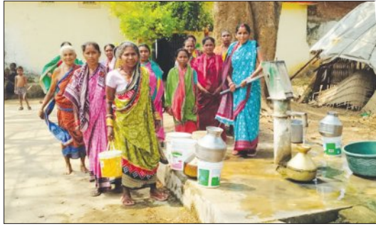
ଖାଣ୍ଡପୋଷ୍ଠ ଆରମ୍ଭରୁ ଖରାପ ହୋଇ ପାଣି ବାହାରୁନି । ଗୋଟିଏ ଷାଢ଼ପୋଷ୍ଠ

ବୌଦ୍ଧ ଜିଲ୍ଲା କଣ୍ଠାମାଳ ବ୍ଲକ୍ ଖଟଖଟିଆ ଗ୍ରାମର ହରିଜନ ସାହିରେ ପାନୀୟ ଜଳ ସଙ୍କଟ ଦେଖା ଦେଇଛି । ଏ ନେଇ ସେମାନେ ପ୍ରଶ୍ନାତ୍ମକ ନିକଟରେ ବାରମ୍ବାର ଅଭିଯୋଗ କରୁଥିଲେ ମଧ୍ୟ କେହି ଶୁଣୁ ନ ଥିବା ଅଭିଯୋଗ କରିଛନ୍ତି ।