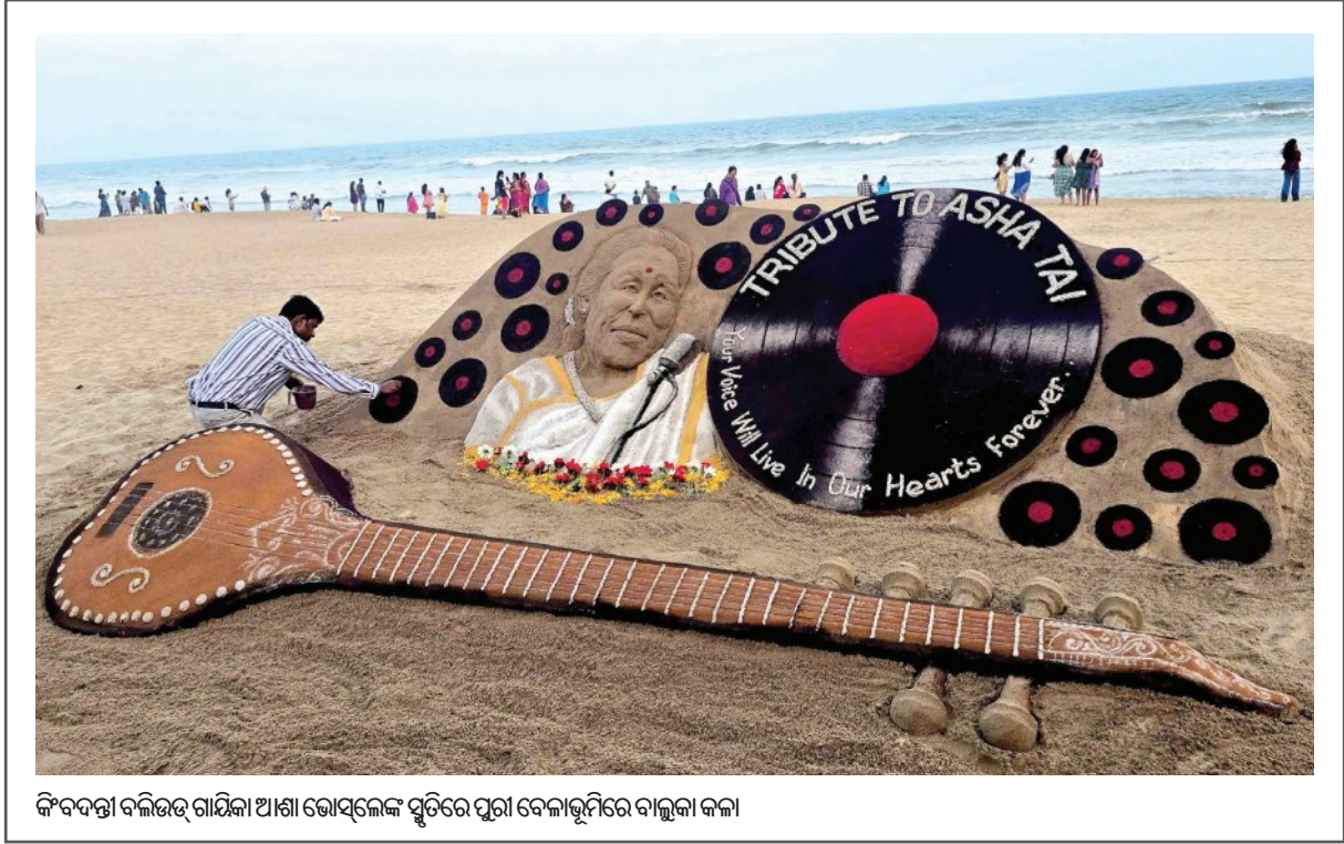
କିଏଦତ୍ତା ବଳିଭୃତ୍ ଗାୟିକା ଆଶା ଭୋସଲେଙ୍କ ସ୍ମୃତିରେ ପୁରୀ ବେଳାଭୂମିରେ ବାଲୁକା କଳା