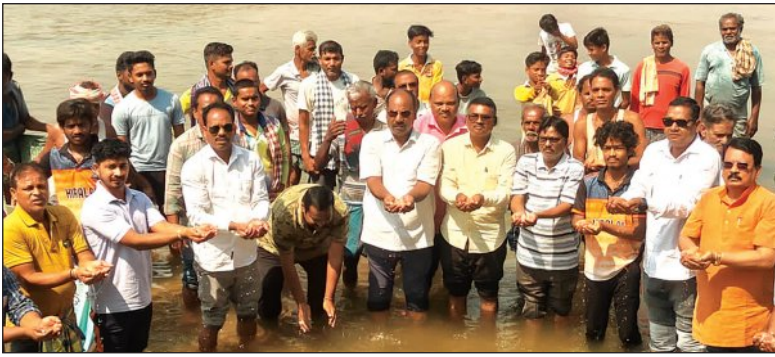
ଭାଗ ନେଇଥିଲେ । ସାରା, ବାଡ଼ିଗାଁ, ଗାଦିଆଖଳା ଓ ଗୁଣ୍ଡପୁର ଅଞ୍ଚଳର ଶତାଧିକ ଲୋକ ଯୋଗଦେଇ ବଂଶଧାରା ଜଳ ସୁରକ୍ଷା ପାଇଁ ଶପଥ ନେଇଥିଲେ । ସୂଚନାନ୍ୁସାରେ, ପ୍ରାୟ ୨୫୪ କି.ମି ଦୀର୍ଘ

ବଂଶଧାରା ନଦୀ ଓଡ଼ିଶା ଓ ଆନ୍ଧ୍ରପ୍ରଦେଶ ଦେଇ ପ୍ରବାହିତ । ୧୯୬୨ରେ ଉଭୟ ରାଜ୍ୟ ମଧ୍ୟରେ ଜଳ ବଣ୍ଟନ ସମ୍ପର୍କୀୟ ଚୁକ୍ତି ହୋଇଥିବା ବେଳେ ଏହାକୁ ଆଧାର କରି ଟ୍ରିବ୍ୟୁନାଲ ଶେଷ ରାୟ ଦେଇଛି । ଗତ ଏପ୍ରିଲ ୫ରେ ସରକାରୀ