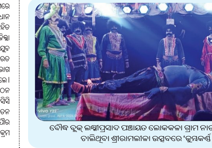
ବୌଦ୍ଧ ବ୍ଲକ୍ କଣ୍ଠାପାଲ ପଞ୍ଚାୟତ ଲୋକକଳା ଗ୍ରାମ ନାରାୟଣନଗରରେ ଚାଲିଥିବା ଶ୍ରୀରାମାୟଣ ଉତ୍ସବରେ 'କୁମ୍ଭକର୍ଣ୍ଣ ବଧ'