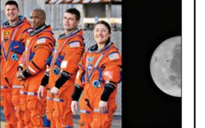
ସବୁଠାରୁ ଦୂରକୁ ପହଞ୍ଚିବାରୁ ନୂଆ ରେକର୍ଡ ସ୍ଥାପନ କରିବାକୁ ଯାଇଛି 'ଆର୍ଚେମିସ୍-୨' ମିଶନର ୪ ଜଣ ମହାକାଶଚାରୀ

ନୂଆଦିଲ୍ଲୀ, ୬ ୧୪ (ଏକେନ୍ଦ୍ରି): ମହାକାଶ ବିଜ୍ଞାନ କ୍ଷେତ୍ରରେ ଏବେ ଏ ନୂଆ ରେକର୍ଡ ସୃଷ୍ଟି ହେବାକୁ ଯାଇଛି । ଦାସ୍ ୫୩ ବର୍ଷ ପରେ ପୃଥିବୀର କକ୍ଷପଥ ଛାଡ଼ି ମାନବଜାତି ପୃଥିବୀରେ ଗଭୀର ମହାକାଶରେ ପାଦ ଥାପିଛି । ଏପ୍ରିଲ ୬ ତାରିଖରେ ନାସାର 'ଆର୍ଚେମିସ୍-୨' ମିଶନର ୪ ଜଣ ମହାକାଶଚାରୀ ଚନ୍ଦ୍ର ମାଧ୍ୟକର୍ଷଣ ଶକ୍ତି ବଳୟ ମଧ୍ୟରେ ପ୍ରବେଶ କରିଛନ୍ତି । ଏହି ମିଶନ ମାନବ ମହାକାଶ ଯାନ ଲକ୍ଷ୍ୟରେ ପୃଥିବୀଠାରୁ ସବୁଠାରୁ ଦୂରକୁ ପହଞ୍ଚିବାରୁ ନୂଆ ରେକର୍ଡ ସ୍ଥାପନ କରିବାକୁ ଯାଇଛି । ଏହି କ୍ରମରେ ୧୯୭୦ ମସିହାରେ 'ଆପୋଲୋ-୧୩' ମିଶନ ରେକର୍ଡ ଭାଙ୍ଗିବା ନିଶ୍ଚିତ ହୋଇଛି । ଆପୋଲୋ-୧୩ ମିଶନ ପୃଥିବୀଠାରୁ ୪, ୦୦, ୧୨୧ କିମି ଦୂରକୁ ଯାଇ ରେକର୍ଡ କରିଥିଲା । ଆର୍ଚେମିସ୍-୨ ଏହି ରେକର୍ଡକୁ ଅତିକ୍ରମ କରି ପୃଥିବୀଠାରୁ ୪, ୦୬, ୬୭୩ କିମି ଦୂରତାରେ ପହଞ୍ଚିବ । ଏହି ମହାକାଶଚାରୀମାନେ ଏପ୍ରିଲ ୬ରେ ଭାରତୀୟ ସମୟ ରାତି ୧୨.୧୫ରେ ମିନିଚନ୍ଦ୍ର ଚନ୍ଦ୍ରର ପଛ ପଟ୍ଟ ଦେଇ ଏକ ପରିକ୍ରମା ଆରମ୍ଭ କରିବେ ଏବଂ ପରେ ପୃଥିବୀ ଅଭିମୁଖେ ଯାତ୍ରା କରିବେ । ଏହି ମିଶନରେ ଓଡ଼ିଆ ମହାକାଶଯାନ ଚନ୍ଦ୍ର ମାଧ୍ୟକର୍ଷଣ ଶକ୍ତି ଏକ ପୁଲ୍‌ସର୍ ଭଳି ବ୍ୟବହାର କରିବ । ଏହାର ଅର୍ଥ ହେଉଛି, ଯଦି ମହାକାଶଯାନର ଲଞ୍ଜିନ ଫେଲ୍ ହୁଏ, ତଥାପି ଚନ୍ଦ୍ରର ମାଧ୍ୟକର୍ଷଣ ଶକ୍ତି ଯାନଟିକୁ ଆପେ ଆପେ ଗ୍ରହଣ ରହିଛି । ପୃଥିବୀର ହୁମୁକାୟ କ୍ଷେତ୍ର ବାହାରେ ମହାକାଶଚାରୀମାନେ ପ୍ରବଳ ମହାକାଶଗତିକ ବିକିରଣର ସାମ୍ନା କରିବେ । ସେମାନଙ୍କ ଶରୀର ଉପରେ ଏହାର ପ୍ରଭାବ କିଭଳି ପଡ଼ୁଛି, ତାହା ମଙ୍ଗଳ ଗ୍ରହ ଅଭିଯାନ ପାଇଁ ଅତ୍ୟନ୍ତ ଜରୁରୀ । ପୃଥିବୀକୁ ଫେରିବା ସମୟରେ ଓଡ଼ିଆ ନ୍ୟାସପୁଲର ବେଗ ଘଣ୍ଟାପ୍ରତି ୪୦, ୨୦୦ କିମି ରହିବ, ଯାହାକି ଏପର୍ଯ୍ୟନ୍ତ କୌଣସି ମାନବବାହା ମହାକାଶ ଯାନ ପାଇଁ ସର୍ବାଧିକ । ତେବେ ଏହି ମହାକାଶଚାରୀ ମାନେ ଚନ୍ଦ୍ର ପୃଷ୍ଠରେ ଓହ୍ଲାଇବେ ନାହିଁ ଓ ପରିକ୍ରମା କରି ପୃଥିବୀ ଫେରିଆସିବାର କାର୍ଯ୍ୟକ୍ରମ ରହିଛି ।