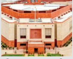
ବିରୋଧୀ ଦଳଙ୍କ ସହିତ ବିଚାରବିମର୍ଶ ଆରମ୍ଭ

■ ନୂଆଦିଲ୍ଲୀ, ୧୪ (ଏକେନ୍ଦ୍ର): ସାମାଜିକ ନ୍ୟାୟ ଆଣିବା ପାଇଁ ଲୋକସଭା ଆସନ ସଂଖ୍ୟା ୮୧୨କୁ ବୃଦ୍ଧି କରିବା ସହିତ ମହିଳାଙ୍କ ପାଇଁ ୨୭୩ ଆସନ ସଂରକ୍ଷିତ ରଖିବା ଲାଗି ଯୋଜନା କରାଯାଇଛି ବୋଲି କେନ୍ଦ୍ର ସରକାର। ଏଥିପାଇଁ ଚଳିତ ମାସ ସଂସଦରେ ସମ୍ବିଧାନ ସଂଶୋଧନ ବିଲ୍ ଆଗତ କରିବେ। ତେଣୁ ସଂସଦର ବଜେଟ୍ ଅଧିବେଶନକୁ ଆସନ୍ତାକାଲି ଗୁରୁବାର ଦିନ ଅନିର୍ଦ୍ଧିଷ୍ଟ କାଳ ପାଇଁ ମୁଲତବା ନକରି ଏହାର ଅବଧିକୁ ବୃଦ୍ଧି କରିପାରିବ। ସରକାରଙ୍କ ପକ୍ଷରୁ ଏସଂପର୍କରେ ଆନୁଷ୍ଠାନିକ ଭାବେ କିଛି କୁହାଯାଇନଥିଲେ ମଧ୍ୟ ଏଭଳି ଯୋଜନା ଚାଲିଥିବା ସଂପର୍କରେ ନିର୍ଦ୍ଦେଶାବଳୀ ପୂର୍ଣ୍ଣ ଭାବେ ଜଣାଯାଇଛି।