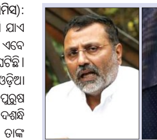
ବିଜୁବାବୁ ରାଷ୍ଟ୍ରନାୟକ ଥିଲେ ଓ ରହିବେ: ବ୍ରହ୍ମେ

■ ନୂଆଦିଲ୍ଲୀ/ ଭୁବନେଶ୍ୱର, ୧୪ (ସମିତ): ନିଆଁରେ ଯୋଡ଼ିଲେ ସୁନା ଶୁଦ୍ଧତା କରି ଯାଏ ନାହିଁ, ବରଂ ଏହା ଅଧିକ ଜାଲୁକ୍ୟମାନ ହୁଏ। ଏବେ ବିଜୁ ପଟ୍ଟନାୟକଙ୍କ କ୍ଷେତ୍ରରେ ଠିକ୍ ତାହାହିଁ ଘଟିଛି। ପ୍ରଶ୍ନର ରାଷ୍ଟ୍ରବାଦୀ, ସ୍ୱାଧୀନତା ସଂଗ୍ରାମୀ, ଓଡ଼ିଆ ଅଭିଭାବକ ପ୍ରଗତିଶୀଳ, ଓଡ଼ିଆ ପ୍ରାଣପ୍ରଦାନ ପୁରୁଷ ବିଜୁ ପଟ୍ଟନାୟକଙ୍କ ପରଲୋକ ତିନି ଦଶନ୍ଧି ପରେ ବିଜେପି ସଂସଦ ନିଶିକାନ୍ତ ବ୍ରହ୍ମେ ତାଙ୍କ ସମ୍ପର୍କରେ ଦେଇଥିବା ଅକଥ୍ୟ ଓ ଗୁଣ୍ୟ ମନ୍ତବ୍ୟ ବିଜୁ ପଟ୍ଟନାୟକଙ୍କ ବ୍ୟକ୍ତିତ୍ୱକୁ ଅଧିକ ଉଜ୍ଜ୍ୱଳ କରିଛି। ଓଡ଼ିଶାରେ ଏହାକୁ ନେଇ ଦଳମତ ନିର୍ବିଶେଷରେ ଚାଳୁ ବିରୋଧ ହୋଇଛି। ବିଧାନସଭାରେ ଏହାକୁ ନେଇ ନିନ୍ଦା ପ୍ରସ୍ତାବ ଆସିଛି। ଦେଶର ପ୍ରାୟ ସବୁ ରାଜନୈତିକ ଦଳ, ଏପରିକି ନିଶିକାନ୍ତ ଦଳର ଅନେକ ନେତା ମଧ୍ୟ ବିଜୁଙ୍କ ପ୍ରତି ଏପରି ମନ୍ତବ୍ୟକୁ ଗ୍ରହଣ କରିନାହାନ୍ତି। ସଂସଦ ଓ ସଂସଦ ବାହାରେ ବିଭିନ୍ନ ରାଜନୈତିକ ଦଳଗୁଡ଼ିକ ନିଶିକାନ୍ତଙ୍କୁ ଭଜନା କରିଛନ୍ତି। ବିଜୁବାବୁ କେବଳ ଓଡ଼ିଶାର ରତ୍ନ