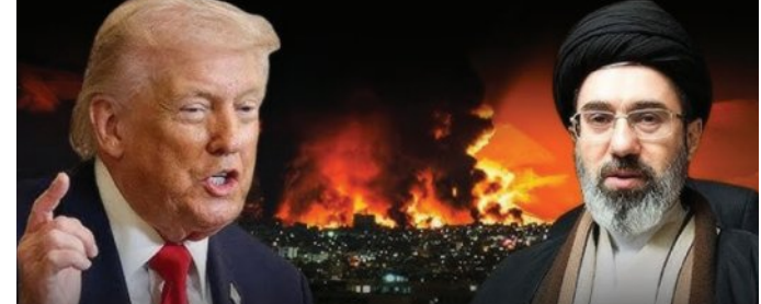
କହିଛି ଯେ ଯୁଦ୍ଧବିରତି ପାଇଁ ଇରାନ କୌଣସି ପ୍ରସ୍ତାବ ଦେଇନାହିଁ। ଫ୍ରାନ୍ସ ମିଛ କହୁଛନ୍ତି ବୋଲି ଇରାନ ବିଦେଶିକ

■ ଖାଫିଜନ, ୧୪ (ଏକେନ୍ଦ୍ର): ମଧ୍ୟପ୍ରାନ୍ତରେ ଚାଲିଥିବା ଇରାନ-ଆମେରିକା-ଇସ୍ରାଏଲ ଯୁଦ୍ଧ ଭବିଷ୍ୟତକୁ ନେଇ ଅନିଶ୍ଚିତତା ଲାଗି ରହିଛି। ଦୁଇ ଦିନ ସପ୍ତାହ ମଧ୍ୟରେ ଯୁଦ୍ଧକୁ ଆମେରିକା ଓ ଇରାନ ଦ୍ୱାରା ରାଷ୍ଟ୍ରପତି ଫ୍ରାନ୍ସ ସୂଚନା ଦେଲା ପରେ ଆଜି କହିଥିଲେ ଯେ ଇରାନ ଯୁଦ୍ଧବିରତି ପାଇଁ ପ୍ରସ୍ତାବ ଦେଇଛି। ତେବେ ହର୍ମୁକ୍ ଖୋଲିଲେ ଯାଇ ଯୁଦ୍ଧବିରତି ସମ୍ଭବ ବୋଲି କହିଥିଲେ। କିନ୍ତୁ ଇରାନ ଆଜି ଫ୍ରାନ୍ସ ଏହି ଦାବିକୁ ଖାରଜ କରିଦେବ