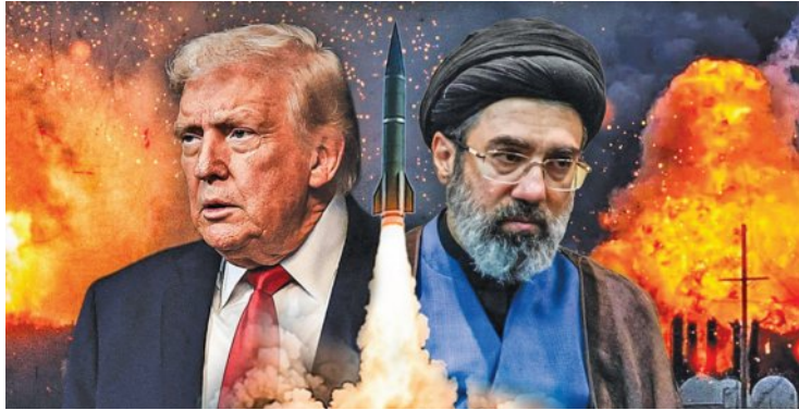
ଇସ୍ରାଏଲ ଆକ୍ରମଣରେ ଲେବାନନ୍‌ରେ ଶତାଧିକ ମୃତ୍ୟୁ ହର୍ମୁଜ ପ୍ରଶାଳା ଖୋଲିବା ନିଷ୍ପତ୍ତିରୁ ଓହ୍ଲାଇଲା ଯୁଦ୍ଧ ଇରାନ ଯୁଦ୍ଧ, କୁଏତ ଉପରେ ଇରାନର ୧୭ କ୍ଷେପଣାସ୍ତ୍ର ମାଡ଼

■ ଖାସିନ/ତେହରାନ, ୮୪ (ଏକେଡି): ଇରାନ ଉପରେ ଆମେରିକା ଓ ଇସ୍ରାଏଲର ଆକ୍ରମଣ ଏବେ ଏକ ବିଚିତ୍ର ସ୍ଥିତିରେ ପହଞ୍ଚିଛି । ସକାଳେ ଯୁଦ୍ଧ ବିରତି ପାଇଁ ଉଭୟ ପକ୍ଷ ସମ୍ମତ ହୋଇଥିଲେ ହେଁ ଅପରାତ୍ନ ସୁଦ୍ଧା ପୁଣି ପରିସ୍ଥିତି ବଦଳିଯାଇଛି । ଆମେରିକା ପକ୍ଷରୁ ଆକ୍ରମଣ ବନ୍ଦ ହୋଇଥିଲେ ମଧ୍ୟ ଇରାନ ଓ ଏହାଦ୍ୱାରା ପରିଚାଳିତ ଛାୟା ସଂଗଠନଗୁଡ଼ିକୁ ଧ୍ୱଂସ କରିବାକୁ ଇସ୍ରାଏଲ ପୁଣି ଆରମ୍ଭ କରିଛି 'ଏଟର୍ନାଲ୍ ଡାର୍କନେସ' । ଏହା ପଛରେ ଉଭୟ ଆମେରିକା ଓ ଇସ୍ରାଏଲର ଯୋଜନାବଦ୍ଧ ରଣନୀତି ଥିବା କୁହାଯାଉଛି । ସେହିପରି ଇରାନରୁ କେତେକ ସମର୍ଥକ ଗୋଷ୍ଠୀ ଉପରେ ଇସ୍ରାଏଲ ପ୍ରତ୍ୟକ୍ଷ ଆକ୍ରମଣ କରିଛି ଇରାନ ଉପରେ ଇସ୍ରାଏଲର ଘାତକ ଆକ୍ରମଣ ପରେ ଯୁଦ୍ଧ ବିରତିରେ ଅନିଶ୍ଚିତତା ଦେଖାଦେଇଛି ।