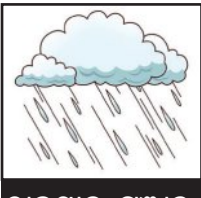
ରାଜସ୍ଥାନ, ପଞ୍ଜାବ, ହରିୟାଣାରେ ସାଭାବିକଠାରୁ କମ୍ ବର୍ଷା ହେବ

■ ନୂଆଦିଲ୍ଲୀ, ୮୪ (ଏକେଡି): ଏବର୍ଷ ଜୁନରୁ ସେପ୍ଟେମ୍ବର ପର୍ଯ୍ୟନ୍ତ ମୌସୁମର ୪ ମାସ ମଧ୍ୟରେ ଦେଶରେ ସାଭାବିକଠାରୁ କମ୍ ବର୍ଷା ହୋଇପାରେ । ସମଗ୍ର ଋତୁରେ ହାରାହାରି ବର୍ଷା ସାଭାବିକଠାରୁ ୬ ପ୍ରତିଶତ କମ୍ ହେବ ବୋଲି ଆକଳନ କରାଯାଇଛି । ଘରୋଇ ପାଣିପାଗ ସଂସ୍ଥା 'ସ୍କାଏମେଟ୍' ଏହି ପୂର୍ବାନୁମାନ କରି ରିପୋର୍ଟ ପ୍ରକାଶ କରିଛି । ଏଥିରେ ଚଳିତ ବର୍ଷ ଭାରତରେ ସାମାନ୍ୟଠାରୁ ୬% କମ୍ ବର୍ଷା ହେବାର ସମ୍ଭାବନା ରହିଛି । ଜୁନରୁ ସେପ୍ଟେମ୍ବର ମାସ ମଧ୍ୟରେ ଦେଶରେ ସାମାନ୍ୟ ବୃଷ୍ଟିପାତ ହାର ହାରି ୬୮.୬ ମିଲିମିଟର ଥିବା ବେଳେ, ଏହି ବର୍ଷ ଏହା ମାତ୍ର ୯୪ ପ୍ରତିଶତ ରହିପାରେ । ଜୁନ୍ ମାସରେ ମୌସୁମର ଆରମ୍ଭ ଭଲ ହେବ ଓ ସାମାନ୍ୟ (୧୦୧%) ବର୍ଷା ହେବ । କିନ୍ତୁ ଜୁଲାଇ ମାସରେ ବର୍ଷା କମିବା ଆରମ୍ଭ ହେବ ଅର୍ଥାତ୍ ୯୫ ପ୍ରତିଶତ ବର୍ଷା ହେବ । ସେହିପରି ଅଗଷ୍ଟ ଓ ସେପ୍ଟେମ୍ବରରେ ମୌସୁମ ସରୁଠାରୁ ଦୁର୍ବଳ ରହିବାର ଆଶଙ୍କା ରହିଛି । ଅଗଷ୍ଟରେ ୯୨ ଓ ସେପ୍ଟେମ୍ବରରେ ୮୯ ପ୍ରତିଶତ ବର୍ଷା ହେବ । ବିଶେଷ କରି ମଧ୍ୟପ୍ରଦେଶ, ରାଜସ୍ଥାନ, ପଞ୍ଜାବ ଓ ହରିୟାଣାରେ ସାମାନ୍ୟଠାରୁ ବର୍ଷା କମ୍ ହୋଇପାରେ । ସ୍କାଏମେଟ୍ ଅନୁଯାୟୀ, ଚଳିତ ବର୍ଷ ଏହି ନିମ୍ନ ସମ୍ଭାବନା ସମ୍ଭାବନା ରହିଛି ।