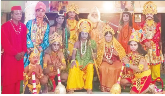
ତରଭା, ୮୪ (ସମିପ):

ତରଭା ବୁଦ୍ଧ ସରଗଳ ରାମଲୀଳା କଳାଏତଦ ଆନୁକୂଲ୍ୟରେ ପ୍ରତି ବର୍ଷ ପରି ଚଳିତ ବର୍ଷ ମଧ୍ୟ ରାମଲୀଳା ନାଟକ ଉତ୍ସବ ବହୁ ଆଡମ୍ବର ସହକାରେ ଅନୁଷ୍ଠିତ ହୋଇଯାଇଛି। ରାମଙ୍କ ଅଭିଷେକରେ ରାମଲୀଳା ଉତ୍ସବ ଉଦ୍‌ଯାପିତ ହୋଇଛି। ରାମ ଅଭିଷେକ ଦୁର୍ଗା ଦେଖିବାକୁ ଦର୍ଶକଙ୍କ ପ୍ରବଳ ଭିଡ଼ ହୋଇଥିଲା। ଶ୍ରୀରାମ ଜନ୍ମ, ଶିବଧନୁ ଭକ୍ତ, ସାତା ବିବାହ, ପଶୁରାମ ଦର୍ପଦଳନ, ରାମ ବନବାସ, ଭରତ ମିଳନ, ସାତାଳ ବାଲିପିଣ୍ଡ, ସୁପ୍ତଶା ନାଶା ଛେଦନ, ବୃଷିରା ବଧ, ସାତା ଚୋରି, ବୈଶ୍ୟ ବଧ, ସାତା ଠାବ, ଲଙ୍କାଯୋଡ଼ି, ସେତୁବନ୍ଧ ପ୍ରତିଷ୍ଠା, ବିଭୀଷଣ ଶରଣ,