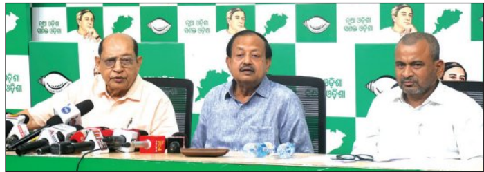
୧୨ ରାଜ୍ୟ ଓ କେନ୍ଦ୍ର ଶାସିତ ଅଞ୍ଚଳରୁ ୫ କୋଟିରୁ ଊର୍ଦ୍ଧ୍ୱ ବାଦ