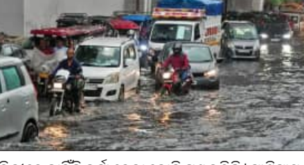
ଦିଲ୍ଲୀରେ କାହିଁକି ବର୍ଷା ହେଲା ବୋଲି ପ୍ରଶ୍ନ ଉଠିଛି । ପାଣିପାଗ ବିଜ୍ଞାନୀଙ୍କ ଅନୁଯାୟୀ, ଏହା ଏକ 'ସ୍ଥାନୀୟ ଉତ୍ତାପ-ପ୍ରତିଫଳନ' ବର୍ଷା ଥିଲା । ଦିଲ୍ଲୀ ଏକ 'ଅର୍ଦ୍ଧ-ନିର୍ଣ୍ଣାୟକ' ବା ସହରୀ

ନୂଆଦିଲ୍ଲୀ, ୧୮ (ଏଜେନ୍ସି): ସାଧାରଣତଃ ଏପ୍ରିଲ ମାସରେ ଦିଲ୍ଲୀର ଚାପମାତ୍ରା ଆକାଶକୁ ଆସି ହୋଇଥାଏ, କିନ୍ତୁ ତଳିତ ବର୍ଷ ପ୍ରକୃତିର କିଛି ଭିନ୍ନ ରୂପ ଦେଖାଦେଇଛି । ଦିଲ୍ଲୀର ପାଇଲ୍ ବିମାନବନ୍ଦ ପରିସ୍ଥିତି କେନ୍ଦ୍ରରେ ଗତ ୨୪ ଘଣ୍ଟା ମଧ୍ୟରେ ୧୯ ମିଲିମିଟର ବର୍ଷା ରେକର୍ଡ଼ କରାଯାଇଛି । ଏହା ଗତ ୧୪ ବର୍ଷ ମଧ୍ୟରେ ଏପ୍ରିଲ ମାସର ସର୍ବାଧିକ ଦିନିକିଆ ବର୍ଷା । ଏହା ମୁଖ୍ୟତଃ ଦୁଇଟି କାରଣ ଯୋଗୁଁ ସମ୍ଭବ ହୋଇଛି । ସେଗୁଡ଼ିକ ହେଲା ଲୁମ୍ପାସାଧାରଣ ଅଞ୍ଚଳରୁ ସୃଷ୍ଟି ହୋଇଥିବା ଏକ ଦୁର୍ବଳ ପର୍ଯ୍ୟାୟ ଝଟ୍କା ବାୟୁମଣ୍ଡଳର ଉପରିଭାଗରେ ଜମାଯାଇବା ଏବଂ ଆର୍ଦ୍ରତା ଏକ ଆସିଥିଲା । ଦିଲ୍ଲୀର ପ୍ରାୟ ୨୦ ଘଣ୍ଟା ଲୁମ୍ପାସାଧାରଣ ଏକ ଚାଳକ ଶକ୍ତି ଭାବେ କାର୍ଯ୍ୟ କଲା । ପ୍ରକାର ପୂର୍ଣ୍ଣକରଣ ଯୋଗୁଁ ଲୁମ୍ପାସାଧାରଣ ବାୟୁ ଗରମ ହୋଇ