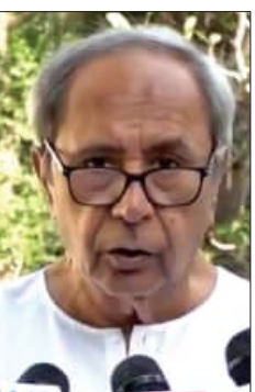
ଓଡ଼ିଶାବାସୀଙ୍କ ନିକଟରେ ବିଜେପିର ମୁଖ୍ୟ ଖୋଲି ଯାଇଛି

■ ଭୁବନେଶ୍ୱର, ୧୮୪ (ସମିଧ): କେନ୍ଦ୍ର ସରକାର ଆଣିଥିବା ସମ୍ବିଧାନର ୧୩୧ ତମ ସଂଶୋଧନ ବିଲ୍ ୨୦୨୬କୁ ନେଇ ବିଜେପି ରାଜନୈତିକ ଦଳ କେନ୍ଦ୍ର ସରକାରଙ୍କୁ କଢ଼ା ସମାଲୋଚନା କରୁଛନ୍ତି । ଏପରିକି ଶୁକ୍ରବାର ମହିଳା ସଂରକ୍ଷଣ ବିଲ୍ ସଂସଦରେ କାର୍ତ୍ତ୍ୱ ଶାଇବା ପରେ ଏହା ବିରୋଧୀଙ୍କ ନୈତିକ ବିଜୟ ଏବଂ ସରକାରଙ୍କର ପରାଜୟ ବୋଲି ବିରୋଧୀ ଦଳ ମତବ୍ୟକ୍ତ କରିଛନ୍ତି । ଏପରିକି ମହିଳା ସଂରକ୍ଷଣ ବିଲ୍ ସହ ସୀମା ପୁନଃ ନିର୍ଦ୍ଧାରଣ ବିଲ୍କୁ ଯୋଡ଼ିବା ପଛରେ କେନ୍ଦ୍ର ସରକାରଙ୍କ ମନ୍ଦ ଉଦ୍ଦେଶ୍ୟ ଥିବା ବୋଲି ସାଧାରଣରେ ମତପ୍ରକାଶ ଯାଇଛି । ଏହିକ୍ରମରେ ସୀମା ପୁନଃନିର୍ଦ୍ଧାରଣ ବିଲ୍ ପ୍ରତିଯୋଗୀରେ ବିଜେପି କିପରି ଓଡ଼ିଶାର ଅଧିକାର, ସ୍ୱାର୍ଥ ସହ ସାଲିସ କଲା, ତାହା ରାଜ୍ୟବାସୀ ଦେଖିଲେ ବୋଲି କହି କଢ଼ା ସମାଲୋଚନା କରିଛନ୍ତି ବିଜେପି ସଭାପତି ତଥା ବିରୋଧୀ ଦଳ ନେତା ନବୀନ ପଟ୍ଟନାୟକ । ଏପରିକି ଏହି ଅନ୍ୟାୟ ବିରୋଧରେ ଓଡ଼ିଶାର ଜଣେ ହେଲେ ବି ବିଜେପି ସଂସଦ ସ୍ତରର ଉଦ୍ଦେଶ୍ୟ ନ କରିବା ରାଜ୍ୟବାସୀଙ୍କୁ ଚଳିତ କରିଛି ବୋଲି ନବୀନ ମତବ୍ୟକ୍ତ କରିଛନ୍ତି । ଶନିବାର ଗଣମାଧ୍ୟମ ପ୍ରତିନିଧିଙ୍କୁ ଏନେଇ ପ୍ରତିକ୍ରିୟା ଦେଇ ନବୀନ କହିଛନ୍ତି ଯେ ବିଜେପି ସର୍ବଦା ପଞ୍ଚାୟତ ସ୍ତରରୁ ସଂସଦ ପର୍ଯ୍ୟନ୍ତ ମହିଳା ସଶକ୍ତୀକରଣ ପାଇଁ ଠିଆ ହୋଇଛି । ମାତ୍ର ଆମେ ସୀମା ନିର୍ଦ୍ଧାରଣ ମାଧ୍ୟମରେ ଓଡ଼ିଶାର ରାଜନୈତିକ ଶକ୍ତି ହ୍ରାସ କରିବା ବିରୁଦ୍ଧରେ ସମ୍ପୂର୍ଣ୍ଣ ବିରୋଧ କରୁଛୁ । ଓଡ଼ିଶାର ଲୋକମାନେ ଦେଖିଛନ୍ତି ଯେ ସେମାନଙ୍କ ଅଧିକାର ପାଇଁ କିଏ ଲଢ଼ିଛି ଏବଂ ବିଜେପି । ପୃଷ୍ଠା-୭