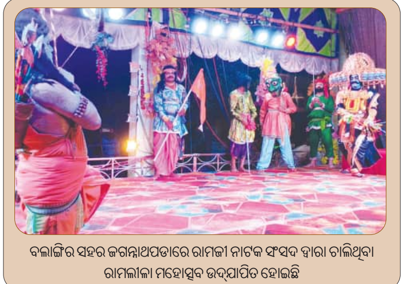
ବଲାଙ୍ଗୀର ସହର ଜଗନ୍ନାଥପଡ଼ାରେ ରାମନା ନାଟକ ଫର୍ସଦ ସ୍ୱାରା ଚାଲିଥିବା ରାମନାମା ମହୋତ୍ସବ ଉଦ୍‌ଘାଟିତ ହୋଇଛି

ସର୍ବଜନ, ୧୮ (ସମିଧ): ସର୍ବଜନ ବ୍ଲକ ଅଞ୍ଚଳରେ ବେଆଇନ୍ ଇଟାଭାଟି ଚାଲିଛି । ଏଣୁ ସ୍ଥାନୀୟ ଅଞ୍ଚଳରେ ଦିନକୁ ଦିନ ପ୍ରଦୂଷଣ ବଢ଼ିବାରେ ଲାଗିଛି । ବେଆଇନ୍ ଭାବେ ଏଠାରେ ବହୁ ଇଟାଭାଟି ଗଠି ଉଠିଛି । ଇଟାଭାଟିରୁ ଅଙ୍ଗାରକାମୁଗା ସମ୍ପର୍କରେ ହେବାପାଇଁ କୁଳୁଳି, ଧୂଆଁ ଓ ପାଉଁଶ ଦିନକୁ ଦିନ ପ୍ରଦୂଷଣ ବଢ଼ିବାରେ ଲାଗିଛି । ବେଆଇନ୍ ଏହି ଅଞ୍ଚଳର ଲୋକଙ୍କ ସ୍ୱାସ୍ଥ୍ୟ ପକ୍ଷେ ହାନିକାରକ ହେଉଛି ।