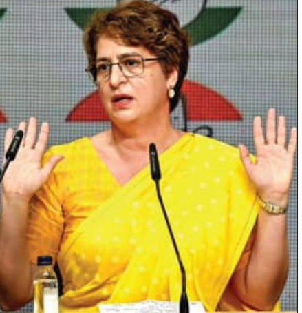
ସମ୍ମାନ ଦିଅନ୍ତି ନାହିଁ, ସେମାନଙ୍କୁ ଏତେ ବଡ଼ ସ୍ତରରେ ସମ୍ମାନ ଦେଖା ଦେବାକୁ ବିରୋଧୀ ଦଳ କଦାପି

ନୂଆଦିଲ୍ଲୀ, ୧୮ (ଏଜେନ୍ସି): ଲୋକସଭାରେ ମହିଳା ଫ୍ରେଣ୍ଡ୍‌ସ୍ ବିଲ୍ ଗୃହୀତ ହୋଇନାପାରିବା ଘଟଣାକୁ କଂଗ୍ରେସ ସାଧାରଣ ସମାଜିକ ପ୍ରିୟଙ୍କା ଗାନ୍ଧୀ 'ଗଣତନ୍ତ୍ରର ବିଜୟ' ବୋଲି ଅଭିହିତ କରିଛନ୍ତି । ଶନିବାର ଏକ ସାମୁଦ୍ରିକ ସମ୍ମିଳନୀରେ ସେ କେନ୍ଦ୍ର ସରକାରକୁ କଡ଼ା ସମାଲୋଚନା କରି କହିଛନ୍ତି ଯେ, ଏହା ବିରୋଧୀ ଦଳଗୁଡ଼ିକର ଏକଦା ଏବଂ ସମ୍ପ୍ରଦାୟର ବିଜୟ । ପ୍ରିୟଙ୍କା କହିଛନ୍ତି ଯେ ଏନ୍‌ଡିଏ ସରକାର ପ୍ରଥମ ଥର ପାଇଁ ପରାଜୟର ଏକ ବଡ଼ ଝଟ୍କା ସହିଛନ୍ତି । ସରକାରଙ୍କ ଦେହୋତ୍ତର ଏହି ପରାଜୟର ପ୍ରଭାବ ସ୍ୱଳ୍ପ ଜଣାପଡ଼ୁଛି । ସେ ଅଧିକାରୀଙ୍କୁ କହିଛନ୍ତି ଯେ ସରକାର କେବଳ କ୍ଷମତାରେ ରହିବା ପାଇଁ ଏକ ବଡ଼ ସତ୍ୟ କହିଥିଲେ । ମହିଳା ଫ୍ରେଣ୍ଡ୍‌ସ୍ ନାମରେ ଲୋକସଭା ଆସନ ଫଖାକୁ ବ୍ୟାପକ ଭାବେ ବୁଝି କରି ନିଜର ଆଧିପତ୍ୟ ଜମାଇବା ପାଇଁ ଏହା ଏକ ପ୍ରୟାସ ଥିଲା । ମହିଳା ଫ୍ରେଣ୍ଡ୍‌ସ୍‌ସ୍ ଡିଲିମିଟେସନ୍ ସହ ଯୋଡ଼ିବାକୁ ନେଇ ସେ ପ୍ରଶ୍ନ କରିଛନ୍ତି । ଯେଉଁ ସରକାର ଗଣତାନ୍ତ୍ରିକ ଅନୁଷ୍ଠାନକୁ