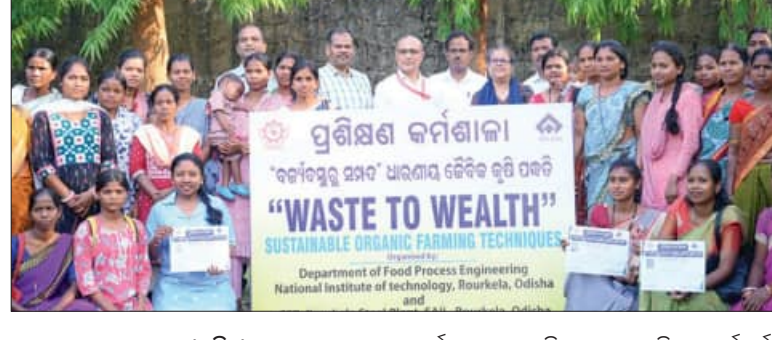
ଧର୍ମଗଡ଼, ୨୩୮୪(ସମ୍ବିଧା): ଆର୍.ଏସ୍.ପି ପକ୍ଷରୁ ଧର୍ମଗଡ଼ରେ ଜୈବିକ କୃଷିଭିତ୍ତିକ ଜ୍ଞାନକୌଶଳ କର୍ମଶାଳା ଅନୁଷ୍ଠିତ ହୋଇଥିଲା। ଉପସ୍ଥିତ ଭାବରେ ଆଲୋଚନା ଆୟତ୍ତ ହୋଇଥିଲା। ସମ୍ପାଦକ ଉପସ୍ଥିତ ଭାବରେ ଆଲୋଚନା ଆୟତ୍ତ ହୋଇଥିଲା।