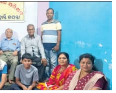
ରାଉରକେଲା, ୨୩୮୪(ସମ୍ବିଧା): ବାଞ୍ଚାନିଧି ମହାକାଣ୍ଡ ଉତ୍ତମ ପୁରସ୍କାର ଜିଲ୍ଲା ସମ୍ପାଦକ ଉପସ୍ଥିତ ଭାବରେ ଆଲୋଚନା ଆୟତ୍ତ ହୋଇଥିଲା। ସମ୍ପାଦକ ଉପସ୍ଥିତ ଭାବରେ ଆଲୋଚନା ଆୟତ୍ତ ହୋଇଥିଲା।