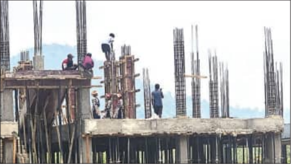
ଶ୍ରମିକମାନେ ନିଜେ ଯୋଗାଣ କରିବାକୁ ଚାହୁଁଛନ୍ତି। ଯଦ୍ୟଦିନ ଦେଖିବାକୁ ମିଳିଛି। ସରକାରୀ ଆଇନକୁ ବ୍ୟାପାର କରି ଖରାରେ ୪୦ ଡିଗ୍ରୀରୁ ଊର୍ଦ୍ଧ୍ୱ ଚାପମାତ୍ରାରେ ଦିନ ୧୨ ଟା ବେଳେ କାର୍ଯ୍ୟ କରୁଥିବା ଦେଖିବାକୁ ମିଳିଛି। ସବୁ ଦେଖି ଠିକାଦାର ଓ ଇଞ୍ଜିନିୟର ନିରବଦୃଷ୍ଟି ଯାକିଥିବା ଦେଖିବାକୁ ମିଳିଛି।

ବର୍ଷା, ୨୩୮୪ (ସମ୍ବିଧା): ଏବେ ଦିନକୁ ଦିନ ଶ୍ରମୀକ ଶ୍ରମିକମାନେ ନିଜେ ଯୋଗାଣ କରିବାକୁ ଚାହୁଁଛନ୍ତି। ଯଦ୍ୟଦିନ ଦେଖିବାକୁ ମିଳିଛି। ସରକାରୀ ଆଇନକୁ ବ୍ୟାପାର କରି ଖରାରେ ୪୦ ଡିଗ୍ରୀରୁ ଊର୍ଦ୍ଧ୍ୱ ଚାପମାତ୍ରାରେ ଦିନ ୧୨ ଟା ବେଳେ କାର୍ଯ୍ୟ କରୁଥିବା ଦେଖିବାକୁ ମିଳିଛି। ସବୁ ଦେଖି ଠିକାଦାର ଓ ଇଞ୍ଜିନିୟର ନିରବଦୃଷ୍ଟି ଯାକିଥିବା ଦେଖିବାକୁ ମିଳିଛି। ଶ୍ରମିକମାନେ ନିଜେ ଯୋଗାଣ କରିବାକୁ ଚାହୁଁଛନ୍ତି। ଯଦ୍ୟଦିନ ଦେଖିବାକୁ ମିଳିଛି। ସରକାରୀ ଆଇନକୁ ବ୍ୟାପାର କରି ଖରାରେ ୪୦ ଡିଗ୍ରୀରୁ ଊର୍ଦ୍ଧ୍ୱ ଚାପମାତ୍ରାରେ ଦିନ ୧୨ ଟା ବେଳେ କାର୍ଯ୍ୟ କରୁଥିବା ଦେଖିବାକୁ ମିଳିଛି। ସବୁ ଦେଖି ଠିକାଦାର ଓ ଇଞ୍ଜିନିୟର ନିରବଦୃଷ୍ଟି ଯାକିଥିବା ଦେଖିବାକୁ ମିଳିଛି।