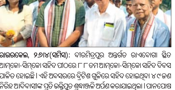
ରାଉରକେଲା, ୨୩୮୪(ସମ୍ବିଧା): ଆମକୋ-ସିମକୋ ସହିଦ ଦିବସ ପାଳିତ ହୋଇଛି। ଉପସ୍ଥିତ ଭାବରେ ଆଲୋଚନା ଆୟତ୍ତ ହୋଇଥିଲା। ସମ୍ପାଦକ ଉପସ୍ଥିତ ଭାବରେ ଆଲୋଚନା ଆୟତ୍ତ ହୋଇଥିଲା।