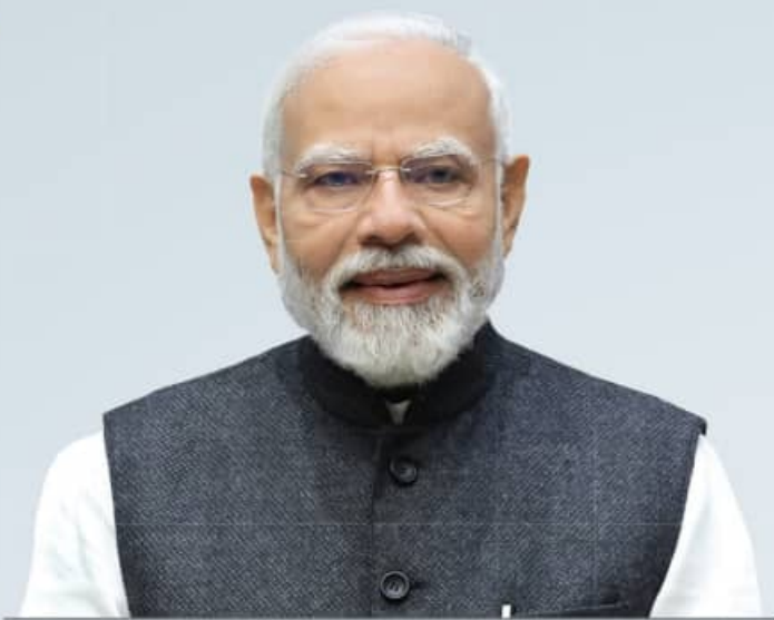
ଶ୍ରୀ ନରେନ୍ଦ୍ର ମୋଦୀ ମାନ୍ୟବର ଭାରତର ପ୍ରଧାନମନ୍ତ୍ରୀ