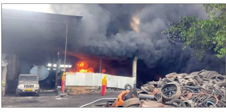
ରାଜଗଞ୍ଜପୁର ନିକଟସ୍ଥ ଯାମପଲ୍ଲୀ ପର୍ଯ୍ୟନ୍ତ ଯିବାକୁ ଥିବା ଏକ ଟାୟାର ଫାକ୍ଟରୀରେ ଦିନ ୧୨ ଟା ବେଳେ ଏକ ଭୟଙ୍କର ଅଗ୍ନିକାଣ୍ଡ ଘଟିଛି। ଏଥିରେ କାରଖାନା ପରିସରରେ ଥିବା ଲାକ୍ଷ୍ୟାଧିକ ଟାୟାର ସାମଗ୍ରୀ, ଯନ୍ତ୍ରମାନଙ୍କ ଉପରେ ଗୋଟାଏ ଘଣ୍ଟା ପର୍ଯ୍ୟନ୍ତ ଘାତ ପଡ଼ିଥିଲା। ଏଥିରେ ନିର୍ବାସିତ କର୍ମୀ ଥିଲେ। ଏହା ପରେ ପ୍ରାୟ ୫ କିଲୋମିଟର ଦୂରରୁ ଯୋଗାଣ କରାଯାଇଥିବା ଟାୟାର ସାମଗ୍ରୀ ଅଗ୍ନିରେ ଉପସ୍ଥାପନ ହୋଇଥିଲା। ଏଥିରେ ପଥଚାରୀଙ୍କୁ ଆଘାତ କରାଯାଇଥିବା ଦେଖାଯାଇଛି। ଅଗ୍ନିର ପ୍ରଭାବରେ କାରଖାନାରେ ଥିବା କର୍ମଚାରୀଙ୍କୁ ବ୍ୟବସ୍ଥାକରିବା ପାଇଁ ସରକାରୀ ସହାୟତା ଚାହୁଁଥିବା ଦେଖାଯାଇଛି।

କାରଖାନାରେ ଭୟଙ୍କର ଭାବରେ ସେ ସମୟରେ ପ୍ରାୟ ୧୫ ଜଣ ଶ୍ରମିକ ଏବଂ କାରଖାନାରେ ପରିଚାଳକ ଉପସ୍ଥିତ ଥିଲେ। ଅଗ୍ନିକାଣ୍ଡର କାରଣ ଅସ୍ପଷ୍ଟ ରହିଥିବା ବେଳେ ସର୍ବୋଚ୍ଚ ନିର୍ଦ୍ଦେଶ ଦେଇ ନିର୍ଦ୍ଦେଶ ଦିଆଯିବା ସହ କାରଖାନାରେ ବିଦ୍ୟୁତ୍ ସଂଯୋଗ ବାଧ୍ୟତାପୂର୍ବକ ଭାବରେ ବିଚାର କରାଯାଉଥିବା କୁହାଯାଇଛି।