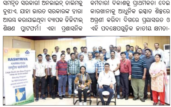
କର୍ମଚାରୀ ଏବଂ ଅଗ୍ରଣୀ କର୍ମଚାରୀମାନଙ୍କୁ ନିର୍ମାଣ ଲକ୍ଷ୍ୟ ସହିତ ଭବିଷ୍ୟତ ପାଇଁ ପ୍ରସ୍ତୁତ କର୍ମଶଳା ଗଠନ, ସୁରକ୍ଷା ଏବଂ ନିରନ୍ତର ଶିକ୍ଷାକୁ ପ୍ରୋତ୍ସାହିତ କରିବା ପାଇଁ ଆରଏସପିର ପ୍ରତିବଦ୍ଧତାକୁ ପ୍ରତିଫଳିତ କରୁଛି।

ରାଜରକେଲ, ୨୫୪ (ସମ୍ବିଧ): ରାଜରକେଲ ଇସ୍ପାତ କାରଖାନା କର୍ମଚାରୀ ଦକ୍ଷତା କର୍ମଶଳା (ସିବିସି) ଏବଂ ଇସ୍ପାତ ମନ୍ତ୍ରାଳୟ (ଏମଏଏସ) ଦ୍ୱାରା ମାର୍ଚ୍ଚ ୨୯ରେ ରାଷ୍ଟ୍ରୀୟ କର୍ମଯୋଗା ବୃହତ୍ତର ଜନସେବା କାର୍ଯ୍ୟକ୍ରମ ମାଧ୍ୟମରେ କର୍ମଚାରୀ ବିକାଶରେ ଉଲ୍ଲେଖନୀୟ ପ୍ରଗତି ହାସଲ କରିଛି। ଆରଏସପି କର୍ମଶଳା ଲିଡ଼ ଟ୍ରେନର ସହ ୫୩ ଜଣ ମାଷ୍ଟର ଟ୍ରେନର ବିକଶିତ କରିଛି, ଯେଉଁମାନେ ପ୍ରାୟ ୨୦୮୫ ରୁ ଅଧିକ କର୍ମଚାରୀଙ୍କୁ ଏକ ଦିବସୀୟ ତାଲିମ ପ୍ରଦାନ କରିଛନ୍ତି। କାରଖାନା ଆଇଗର୍ (ଆଇ ଜିଏଚ୍) ଯୋଜନାରେ ଶତ ପ୍ରତିଶତ କର୍ମଚାରୀଙ୍କୁ ତାଲିମ କରିପାରିବା ସହିତ ଏହାର ସମ୍ପୂର୍ଣ୍ଣ କର୍ମଚାରୀଙ୍କ ମଧ୍ୟରୁ ପ୍ରାୟ ୬୪ ପ୍ରତିଶତ କର୍ମଚାରୀ ଅନିର୍ଦ୍ଧାରିତ ସିବିସି ପାଠ୍ୟକ୍ରମ ଏ ସମୟ ପର୍ଯ୍ୟନ୍ତ ସମାପ୍ତ କରିଛନ୍ତି। ଉଲ୍ଲେଖନୀୟ ଯେ ଆଇଗର୍,