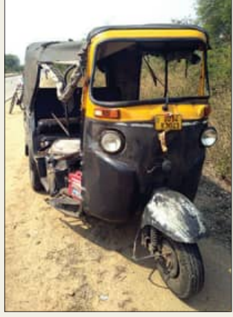
ବଣାଇଁ, ୨୫୪ (ସମ୍ବିଧ): ବଣାଇଁ ଉପଖଣ୍ଡ ବିକାଶର ପାଇଁ ଥାନା ଅଧୀନ ବଣାଇଁ ବାରକୋଟ ୧୪୩ ନମ୍ବର ଜାତୀୟ ରାଜପଥରେ ବିକାଳି ଗ୍ରାମ ନିକଟରେ ଶନିବାର ସକାଳେ