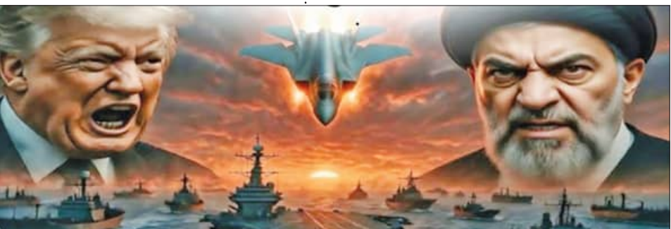
ଭିତରୁ ହୁର୍ବଳ କରିବାକୁ ଚାହୁଁଛନ୍ତି। ଯଦି ଇରାନର ଟେକ୍‌ କୁଅଷ୍ଟ୍ରିକ୍‌ ସବୁଦିନ ପାଇଁ ନଷ୍ଟ ହୋଇଯାଏ, ତେବେ ଇରାନର ଅର୍ଥନୀତି ସମ୍ପୂର୍ଣ୍ଣ ରୂପେ କୁଅଷ୍ଟ୍ରି ପଡ଼ିବ। ଏହି ରଣନୀତି ଇରାନକୁ ଆମେରିକାର ସହିତ ମାନିବାକୁ ବାଧ୍ୟ କରିବ ବୋଲି ସ୍ତ୍ରୀକ୍‌ ହାତ୍‌ସ୍‌ ଥାଣା ରଖିଛି।

ଓଫିଟନ/ଡେହେରାନ, ୨୨୪(ଏକେନ୍ଦ୍ରି): ଦଶନ୍ଧି ଦଶନ୍ଧି ଧରି ଆମେରିକା ଏବଂ ଇସ୍ରାଏଲ୍, ଇରାନର ପରମାଣୁ କାର୍ଯ୍ୟଳୟକୁ ରୋକିବା ପାଇଁ ରଣନୀତି ପ୍ରସ୍ତୁତ କରିଆସୁଛନ୍ତି। ମାତ୍ର ବର୍ତ୍ତମାନର ଯୁଦ୍ଧ ସ୍ଥିତି ଏହା ପ୍ରମାଣ କରିଛି ଯେ ଇରାନ ପାଖରେ ପରମାଣୁ ବୋମା ଅଧିକାଂଶ ଅଧିକ ଶକ୍ତିଶାଳୀ ଏକ ଅସ୍ତ୍ର ରହିଛି, ତାହା ହେଉଛି ହର୍ମୁଜ ପ୍ରଶାଳା। ବିଶେଷତାମାନେ ଏହାକୁ ଇରାନର ପରମାଣୁ ଅସ୍ତ୍ର