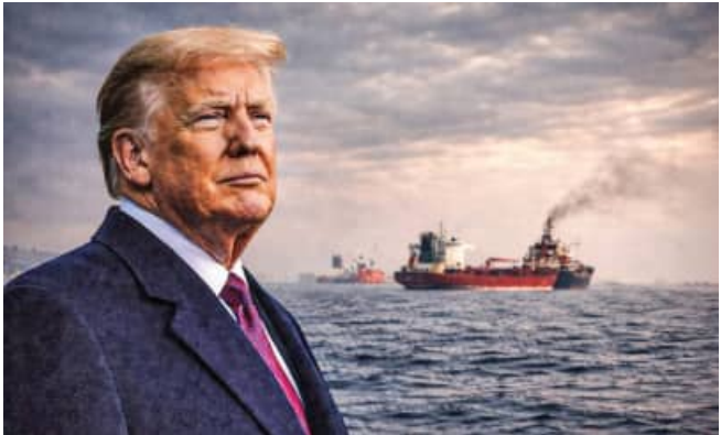
ଆମେରିକା ସେନାର ହର୍ମୁଜ ଅବରୋଧ ଜାରି ତୈଳ ଜାହାଜ ଉପରେ ଗୁଳିମାଡ଼ କରୁଛି ଭରାନ

■ ଖାସିନେ/ଇସଲାମାବାଦ, ୨୨।୪ (ଏକେନି): ଭରାନ ଓ ଆମେରିକା ମଧ୍ୟରେ ୧୫ ଦିନିଆ ଯୁଦ୍ଧ ବିରତି ଆଜି ଶେଷ ହୋଇଥିବା ବେଳେ ଏହାର ଅବଧିକୁ ଅନିର୍ଦ୍ଧିତ କାଳ ପାଇଁ ବୃଦ୍ଧି କରିବାକୁ ଯୋଷଣା କରିଛନ୍ତି ଆମେରିକାର ରାଷ୍ଟ୍ରପତି ଡୋନାଲ୍ଡ ଟ୍ରମ୍ପ। ଶାନ୍ତି ଆଲୋଚନା ଫଳପ୍ରସ୍ତ ନହେବା ପର୍ଯ୍ୟନ୍ତ ଯୁଦ୍ଧବିରତି ଜାରି ରହିବ। ଏହି ସମୟରେ ଦୁଇ ଦେଶ ମଧ୍ୟରେ ସାମରିକ ସଂଘର୍ଷ ହେବ ନାହିଁ, ତେବେ ହର୍ମୁଜରେ ଆମେରିକାର ନୌସେନା ଅବରୋଧ ଜାରି ରହିବ। ଆମେରିକାର ଏଭଳି ଆଭିମୁଖ୍ୟକୁ ନେଇ ଭରାନ ଭାଷଣ ପ୍ରତିକ୍ରିୟା ପ୍ରକାଶ କରିବା ସହିତ ହର୍ମୁଜରେ କେତେକ ଜାହାଜ ଉପରେ ଗୁଳିମାଡ଼