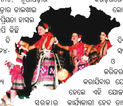
ଲୋକନୃତ୍ୟ ଯାମିଳ କର । ଯ । ଇ ଥୁ ବ । ବେଳେ ଆଗାମୀ ଦିନରେ ଓଡ଼ିଶାର ସମସ୍ତ ଲୋକକଳା ଓ ଲୋକନୃତ୍ୟ ଏଥି କରତରରେ ସାମିଳ କରାଯିବାର ଯୋଜନା ବି ରହିଥିଲା।

ଭୁବନେଶ୍ୱର, ୨୮୪ (ସମ୍ପାଦକ): ଲୋକନୃତ୍ୟ ହେଉଛି ଓଡ଼ିଶାର କଳା ଓ ସଂସ୍କୃତିର ପରିଚୟ। ଗାଁ ଗହଳଠାରୁ ଆରମ୍ଭ କରି ଆଦିବାସୀ ଆଧୁନିକ ଅଞ୍ଚଳର ଲୋକଙ୍କ କଥା କୁହେ ଲୋକନୃତ୍ୟ। ପୂର୍ବରୁ ପର୍ବପର୍ବାଣୀରେ ପାଲ, ଦାସକାଠିଆ, ଘୋଡ଼ା ନାଚ, ସଖା ନୃତ୍ୟ, ବଣ ନାଚ, କରମା, ରସରକେଳି ଆଦି ପାରମ୍ପରିକ ଲୋକନୃତ୍ୟର ଚାହିଦା ରହିଥିବା ବେଳେ ଧାରୋଧରେ ଏହା ଅପସରି ଗଲାଣି।