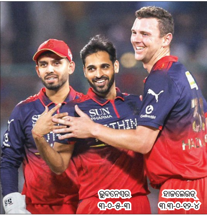
ଭୁବନେଶ୍ୱର ୩୦-୦-୫-୩ ହାଜଲେଉଡ଼ ୩୩-୦-୦-୪

ନୂଆଦିଲ୍ଲୀ, ୨୬ ୪ (ଏକେଡି): ଚଳିତ ଆଇପିଏଲରେ ସୋମବାର ଅନୁଷ୍ଠିତ ଏକ ଲୋ-ସ୍କୋରି ମ୍ୟାଚରେ ଉତ୍ତମ ଚ୍ୟାମ୍ପିୟନ୍ ବେଙ୍ଗାଲୁରୁ (ଆରସିବି) ଏ ଫିକେଟ୍‌ରେ ଦିଲ୍ଲୀ କ୍ୟାପିଟାଲ୍ସକୁ ପରାସ୍ତ କରିଛି। ଆରସିବିର ଦୁଇ ଡାହାଣହାତୀ ଦ୍ରୁତ ବୋଲର ଭୁବନେଶ୍ୱର କୁମାର (୩୦-୦-୫-୩) ଓ ଜୋଶି ହାଜଲେଉଡ଼ (୩୩-୦-୦-୪)ଙ୍କ ବୋଲିଂକୁ ମୁକାବିଲା କରି ନ ପାରି ପ୍ରଥମେ ବ୍ୟାଟି କରିଥିବା ଘରୋଇ ଦିଲ୍ଲୀ ୧୬୩ ରୁଣ ଉପରେ ମାତ୍ର ୬୫ ରନରେ ଅଲଆଉଟ୍ ହୋଇଯାଇଥିଲା। ଏହି ଛୋଟିଆ ଲକ୍ଷ୍ୟକୁ ପିଛା କରିଥିବା ଡିପେଣ୍ଡେଣ୍ଟ ଚାମ୍ପିୟନ ବେଙ୍ଗାଲୁରୁ ୬୩ ଓଜରରେ ଗୋଟିଏ ଫିକେଟ୍ ହରାଇ ବିଜୟ ହୋଇଥିଲା। ଦେବାଦତ୍ତ ପାଟିକଲ ଏମା ବଲରେ ୩୪ ରନ (୩ଟି ଲେଖାଏଁ ଚୌକା ଓ ଛକା) ଓ ବିରାଟ କୋହଲି ୧୫ ବଲରେ ୨୩ ରନ (୨ ଛକା ଓ ଗୋଟିଏ ଚୌକା) କରି ଅପରାଜିତ ରହିଥିଲେ। ଓପନର କାକବ ବେହେଲ ୧୧ ବଲରେ ୨୦ ରନ କରି ଆଉଟ୍ ହୋଇଥିଲେ। କୋହଲି ଏହି ଅବସରରେ ୯୦୦୦ ରନ ପୁରଣ କରିଛନ୍ତି। ଆରସିବି ୮ ମ୍ୟାଚରୁ ୬ ବିଜୟ ସହ ୧୨ ପଏଣ୍ଟ ପାଇ ବିତାଣ ସ୍ଥାନକୁ ଆହୁରି ସୁଦୃଢ଼ କରିଛି।