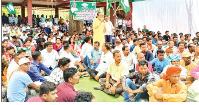
ମୁଖ୍ୟମନ୍ତ୍ରୀଙ୍କ ଉଦ୍ଦେଶ୍ୟରେ ଦାବିପତ୍ର ପ୍ରଦାନ

କୋରାପୁଟ, ୨୭/୪ (ସମ୍ପାଦକ): ରାଜ୍ୟ ସରକାରଙ୍କ ତାତ୍ପର୍ଯ୍ୟପୂର୍ଣ୍ଣ ନୀତିକୁ ବିରୋଧ କରି କୋରାପୁଟ ଜିଲ୍ଲା ବିଜେଡି ଦଳ ଯୋଗାଯୋଗ ଜିଲ୍ଲାପାଳ କାର୍ଯ୍ୟାଳୟ ଘେରିବା କରିବା ସହ ମୁଖ୍ୟମନ୍ତ୍ରୀଙ୍କ ଉଦ୍ଦେଶ୍ୟରେ ଦାବିପତ୍ର ପ୍ରଦାନ କରିଛି।