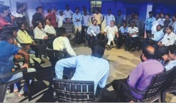
ରାତିରେ ଜୟପୁର ବ୍ଲକ୍ କୁମ୍ଭାଙ୍ଗିପୁଟ ଠାରେ ଆୟୋଜିତ ପ୍ରସ୍ତୁତି ବୈଠକରେ ନିଶ୍ଚିତ ଗ୍ରହଣ କରାଯାଇଛି ।

ପାରି ନାହାନ୍ତି । ଗତ ମାର୍ଚ୍ଚ ୩୯ ତାରିଖରେ ଅଧିନ ଦିବସ ଥିଲା । ପଳକେ ଚାଷୀ ମାନେ ସେମାନଙ୍କ ଅମଳ ଧାନ ଫସଲ ବିକ୍ରି ନେଇ ବିଜେଡି ଦଳ ପକ୍ଷରୁ ବାରମ୍ବାର ରାଜ୍ୟ ଓ ପ୍ରଶାସନ ନିକଟରେ ଦାବି କରାଯାଇ ବୃଷ୍ଟି ଆକର୍ଷଣ କରିଥିଲେ ।