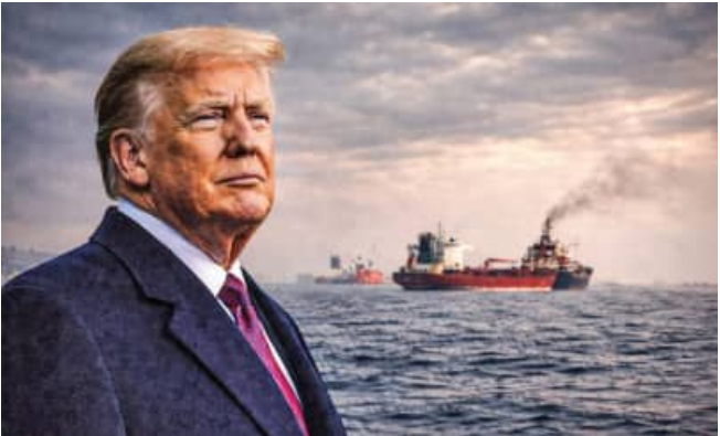
ଆମେରିକା ସେନାର ହର୍ମୁଜ ଅବରୋଧ ଜାରି ତୈଳ ଜାହାଜ ଉପରେ ଗୁଳିମାଡ଼ କରୁଛି ଇରାନ

■ ଝାମ୍ପିନେ/ଇସଲାମାବାଦ, ୨୨।୪ (ଏକେନି): ଭରାନ ଓ ଆମେରିକା ମଧ୍ୟରେ ୧୫ ଦିନିଆ ଯୁଦ୍ଧ ବିରତି ଆଜି ଶେଷ ହୋଇଥିବା ବେଳେ ଏହାର ଅବଧିକୁ ଅନିର୍ଦ୍ଧିତ କାଳ ପାଇଁ ବୃଦ୍ଧି କରିବାକୁ ଘୋଷଣା କରିଛନ୍ତି ଆମେରିକାର ରାଷ୍ଟ୍ରପତି ଡୋନାଲ୍ଡ ଟ୍ରମ୍ପ। ଶାନ୍ତି ଆଲୋଚନା ଫଳପ୍ରସ୍ତ ନହେବା ପର୍ଯ୍ୟନ୍ତ ଯୁଦ୍ଧବିରତି ଜାରି ରହିବ। ଏହି ସମୟରେ ଦୁଇ ଦେଶ ମଧ୍ୟରେ ସାମରିକ ସଂଘର୍ଷ ହେବ ନାହିଁ, ତେବେ ହର୍ମୁଜରେ ଆମେରିକାର ନୌସେନା ଅବରୋଧ ଜାରି ରହିବ। ଆମେରିକାର ଏଭଳି ଆଭିମୁଖ୍ୟକୁ ନେଇ ଇରାନ ଭୀଷଣ ପ୍ରତିକ୍ରିୟା ପ୍ରକାଶ କରିବା ସହିତ ହର୍ମୁଜରେ କେତେକ ଜାହାଜ ଉପରେ ଗୁଳିମାଡ଼