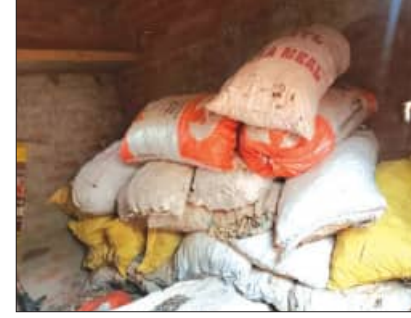
ଥିଆରୁ ରୋଷେଇ ପାଇଁ ଦେଖି ଉପଯୋଗୀ ହେଉଥିବା ଅଞ୍ଚଳର ଗୃହିଣୀ ମାନେ ପ୍ରକାଶ କରିଛନ୍ତି । ଅନ୍ୟପକ୍ଷେ

ହେଉନାହାନ୍ତି ମକା ନଡ଼ା ରଖୁଥିବା ଚାଷୀ ପରିବାର । ଗୋଟିଏ ପିକ୍ ଅପ୍ ଗାଡ଼ିରେ ଭର୍ତ୍ତି ଥିବା ମକା ନଡ଼ା ପାଖ ହଜାର ଟଙ୍କାରୁ ଛଅ ହଜାର ଟଙ୍କା ମୂଲ୍ୟରେ ବିକ୍ରି ହେଉଛି ।