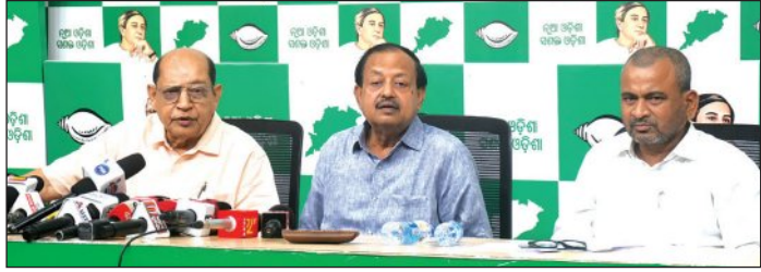
୧୨ ରାଜ୍ୟ ଓ କେନ୍ଦ୍ର ଶାସିତ ଅଞ୍ଚଳରୁ ୫ କୋଟିରୁ ଊର୍ଦ୍ଧ୍ୱ ବାଦ

ଭୋଟରଙ୍କୁ ବାଦ୍ ଦିଆଯିବା ସନ୍ଦେହଜନକ । ଓଡ଼ିଶାରେ ଏସଆଇଆର ହେବାକୁ ଯାଉଥିବା ବେଳେ ଅଧିକ ଭୋଟରଙ୍କ ନାମ ବାଦ୍ ପଡ଼ିବା ଆଶଙ୍କା ଦେଖାଦେଇଛି । ଓଡ଼ିଶାରେ ୨୦୦୨