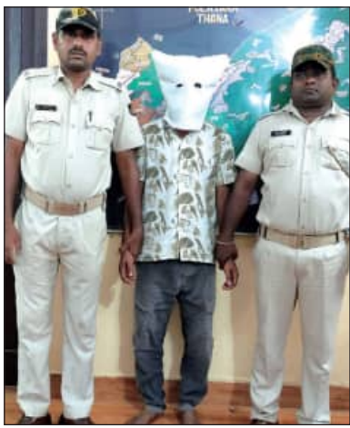
ନେଇ ତାଙ୍କ ଘରେ ଦେଇଦେବା ପାଇଁ କହିଥିଲା। କିନ୍ତୁ, କିଛି ସମୟ ପରେ ସୁବ୍ରତ ପୁଣି ଫୋନ୍ କରି ପୋଲିସର ନିକଟସ୍ଥ ରାଧିକ୍ଷା ଭାଇକୁ ଆସିବା

ପୋଲିସ, ୧୯୮୪ (ସମ୍ପର୍କ): ଭାଇ ସାଜିଲା ବଇରା। ସହଯୋଗୀ ସହ ମିଶି ଭାଇକୁ ଅପହରଣ କରିବା ପରେ ଚଣ୍ଡିଚିପି ମାରିଦେଲା। ଗଣ୍ଡାମା ଜିଲ୍ଲା ପୋଲିସର ଅଞ୍ଚଳରେ ଏପରି ଏକ ଆପତ୍ୟକ୍ତ ଘଟଣା ଚର୍ଚ୍ଚାର ବିଷୟ ହୋଇଛି। ମୃତକ ହେଲେ, ପୋଲିସର ଆନା ମାଳତୀକୁଳିଆ ଗ୍ରାମର ରାଜଦାପ