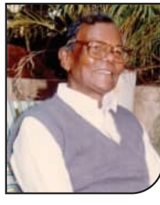
ଯୋଗ ଦେଇଥିଲେ । ୧୯୪୦ରେ ତାଙ୍କର ନିର୍ମୂଲ୍ୟ ହୁଏ ଆଦିବାସୀ ଅଧ୍ୟୁଷିତ କୋରାପୁଟ ଜିଲ୍ଲାରେ । ସେଠାରେ ସେ କବି, କୁଳ, ସଭାର, ପରଜା ସମ୍ପ୍ରଦାୟର ଭାଷା ଓ

ଆଧୁନିକ ଓଡ଼ିଆ ସାହିତ୍ୟ ଜଗତର ଅନନ୍ୟତମ ପ୍ରଭାବଶାଳୀ ଔପନ୍ୟାସିକ ଥିଲେ ଗୋପୀନାଥ ମହାନ୍ତି । ଉପନ୍ୟାସ ସହିତ କବିତା, ଗଳ୍ପ, ଜୀବନୀ, ଆତ୍ମଜୀବନୀ, ନାଟକ ଓ ଅନୁବାଦରେ ଥିଲେ ତାଙ୍କର ଅତ୍ୟୁତପୂର୍ବ ଦକ୍ଷତା । ତାଙ୍କ ଲେଖାରେ ଓଡ଼ିଆ ଚଳଣି, ପାହାଡ଼ି ଜୀବନର କାହାଣୀ, ସାଧାରଣ ମଣିଷର ଭାଷା ଆଦିର ବ୍ୟବହାର ଦେଖିବାକୁ ମିଳିଥାଏ । ଖ୍ରୀନପାଠ ପୁରସ୍କାର ପାଇବାରେ ସେ ପ୍ରଥମ ଓଡ଼ିଆ ଔପନ୍ୟାସିକ । ୧୯୪୪ ମସିହା ଆଜିର ଦିନରେ କଟକ ଜିଲ୍ଲାର ମହାନଦୀ କୂଳର ଏକ ଛୋଟିଆ ଗ୍ରାମ ନାରବାଲିରେ ଗୋପୀନାଥଙ୍କର ଜନ୍ମ ହୋଇଥିଲା । ବିତର୍କପୂର୍ଣ୍ଣ ପ୍ରତିଭାସମ୍ପନ୍ନ ଗୋପୀନାଥଙ୍କର ପିଲାଦିନରୁ ସାହିତ୍ୟ ପ୍ରତି ରୁଚି ଥିଲା । ସେ ମାତ୍ର ୨୯ ବର୍ଷ