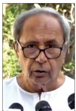
ଓଡ଼ିଶାବାସୀଙ୍କ ନିକଟରେ ବିଜେପିର ମୁଖ୍ୟ ଖୋଲି ଯାଇଛି ଅନ୍ୟାୟ ବିରୋଧରେ ବିଜେପିର ଜଣେ ବି ସଂସଦ ସ୍ତରରେ ଉଦ୍ଦେଶ୍ୟ ନାହିଁ ଓଡ଼ିଶାର ଅଧିକାର ପାଇଁ ବିଜେପି ସର୍ବଦା ଲଢ଼େଇ ଜାରି ରଖିବ

ସୀମା ପୁନଃନିର୍ଦ୍ଧାରଣ ବିଲ୍ ପ୍ରସଙ୍ଗରେ ନବୀନଙ୍କ କଢ଼ା ସମାଲୋଚନା ଓଡ଼ିଶାର ନ୍ୟାୟ ଅଧିକାର ସହ ସାଲିସ୍ କରିଛି ରାଜ୍ୟ ବିଜେପି ■ ଭୁବନେଶ୍ୱର, ୧୮୪ (ସମ୍ପାଦକ): କେନ୍ଦ୍ର ସରକାର ଆଣିଥିବା ସମ୍ପୂର୍ଣ୍ଣାଙ୍ଗୀୟ ଟିଏମ୍ ଆକ୍ଟ ୨୦୨୬କୁ ନେଇ ବିଜେପି ରାଜନୈତିକ ଦଳ କେନ୍ଦ୍ର ସରକାରଙ୍କୁ କଢ଼ା ସମାଲୋଚନା କରୁଛନ୍ତି । ଏପରିକି ଶୁକ୍ରବାର ମହିଳା ସଂରକ୍ଷଣ ବିଲ୍ ସଂସଦରେ କାର୍ତ୍ତ୍ୱୀ ଶାଢ଼ୀ ପରେ ଏହା ବିରୋଧୀକ ନୈତିକ ବିଜୟ ଏବଂ ସରକାରଙ୍କର ପରାଜୟ ବୋଲି ବିରୋଧୀ ଦଳ ମତବ୍ୟକ୍ତ କରିଛନ୍ତି । ଏପରିକି ମହିଳା ସଂରକ୍ଷଣ ବିଲ୍ ସହ ସୀମା ପୁନଃ ନିର୍ଦ୍ଧାରଣ ବିଲ୍କୁ ଯୋଡ଼ିବା ପଛରେ କେନ୍ଦ୍ର ସରକାରଙ୍କ ମନ୍ଦ ଉଦ୍ଦେଶ୍ୟ ଥିବା ବୋଲି ସାଧାରଣରେ ମତପ୍ରକାଶ ପାଇଛି । ଏହିକ୍ରମରେ ସୀମା ପୁନଃନିର୍ଦ୍ଧାରଣ ବିଲ୍ ପ୍ରତିଯୋଗୀରେ ବିଜେପି କିପରି ଓଡ଼ିଶାର ଅଧିକାର, ସ୍ୱାର୍ଥ ସହ ସାଲିସ୍ କଲା, ତାହା ରାଜ୍ୟବାସୀ ଦେଖିଲେ ବୋଲି କହି କଢ଼ା ସମାଲୋଚନା କରିଛନ୍ତି ବିଜେପି ସଭାପତି ତଥା ବିରୋଧୀ ଦଳ ନେତା ନବୀନ ପଟ୍ଟନାୟକ । ଏପରିକି ଏହି ଅନ୍ୟାୟ ବିରୋଧରେ ଓଡ଼ିଶାର ଜଣେ ହେଲେ ବି ବିଜେପି ସଂସଦ ସ୍ତରରେ ଉଦ୍ଦେଶ୍ୟ ନ କରିବା ରାଜ୍ୟବାସୀଙ୍କୁ ଚଳିତ କରିଛି ବୋଲି ନବୀନ ମତବ୍ୟକ୍ତ କରିଛନ୍ତି । ଶନିବାର ଗଣମାଧ୍ୟମ ପ୍ରତିନିଧିଙ୍କୁ ଏନେଇ ପ୍ରତିକ୍ରିୟା ଦେଇ ନବୀନ କହିଛନ୍ତି ଯେ ବିଜେପି ସର୍ବଦା ପଞ୍ଚାୟତ ସ୍ତରରୁ ସଂସଦ ପର୍ଯ୍ୟନ୍ତ ମହିଳା ସଂରକ୍ଷଣ ପାଇଁ ଠିଆ ହୋଇଛି । ମାତ୍ର ଆମେ ସୀମା ନିର୍ଦ୍ଧାରଣ ମାଧ୍ୟମରେ ଓଡ଼ିଶାର ରାଜନୈତିକ ଶକ୍ତି ହ୍ରାସ କରିବା ବିରୁଦ୍ଧରେ ସମ୍ପୂର୍ଣ୍ଣ ବିରୋଧ କରୁଛୁ । ଓଡ଼ିଶାର ଲୋକମାନେ ଦେଖିଛନ୍ତି ଯେ ସେମାନଙ୍କ ଅଧିକାର ପାଇଁ କିଏ ଲଢ଼ିଛି ଏବଂ ବିଜେପି ।