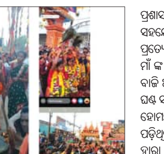
ଦେବା ଦେବୀଙ୍କ ଲାଠି, ଖୁର୍ଦ୍ଦା, ତୋଳା ଇତ୍ୟାଦି ନାଗରୀ, ବାମୋ, ପୁନ୍ଦୁରି ଘଣ୍ଟ ଶବ୍ଦ ତାଳେ ତାଳେ ନାଚୁଥିବା ଦେଖିବାକୁ ମିଳିଥିଲା। ମନ୍ଦିର ରୁ ମାଁ କ ବିମାନ ବାହାରିବା ସମୟରେ ଏହି ଅଞ୍ଚଳର ଆଦିବାସୀ, ମାଡ଼ିଆ ନାଚ, କାଳୀ ମହିଷା ସୁର ନାଚ, ଶିବ ଚାଣ୍ଡବ ନୃତ୍ୟ ଇତ୍ୟାଦି ଶୋଭାଯାତ୍ରା ବାହାରି ଥିବା ଦେଖିବାକୁ ମିଳିଥିଲା।

ରୁଧିରାଦିନ ଦିନ ଧୂମ୍‌ଧାମ୍‌ରେ ସମାପନ ହେଇଯାଇଛି ମାଁ ଶୀତଳା ଠାକୁରାଣୀଙ୍କ ଉନ୍ନତ ବାର୍ଷିକ ଘଟଯାତ୍ରା। ସକାଳ ୭ ଘଣ୍ଟାରୁ ସହର ସମସ୍ତ ସାହିରୁ ଘଟ କୂସ ଦେବା ସହିତ ମାନସିକ ଧାର ମାନେ ନିଜ ନିଜ ଘରେ ପୂଜାରୀ ମାନଙ୍କ ଦ୍ୱାରା ପୂଜାପାଠ ଅନୁଷ୍ଠିତ କରି ଘଟ କୂସ ସ୍ଥାପନା କଲା ପରେ ଘଣ୍ଟ ମନ୍ଦିର ନାଗରୀ ବଜେଇ ମାଁ ଶୀତଳା ଠାକୁରାଣୀ ମନ୍ଦିରରେ ପହଞ୍ଚିଥିଲେ।