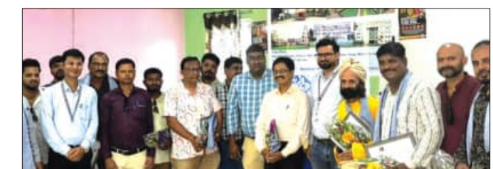
ପାରଳାଖେମୁଣ୍ଡି କ୍ୟାମ୍ପସରୁ ଏକ ସ୍ୱତନ୍ତ୍ର ସମ୍ମାନ ସମାରୋହ ଆୟୋଜନ କରାଯାଇଥିଲା। କାର୍ଯ୍ୟକ୍ରମରେ ଯୁବପିଢ଼ିକୁ ମାର୍ଗଦର୍ଶନ ଏବଂ ଶିକ୍ଷା କ୍ଷେତ୍ରରେ ଅବଦାନ ଥିବା ବିଭିନ୍ନ ଅଞ୍ଚଳର ୩୦ ଜଣ ପ୍ରତିଷ୍ଠିତ ବ୍ୟକ୍ତିଙ୍କୁ ସମ୍ମାନିତ କରାଯାଇଥିଲା।

ମାଲକାନଗିରି, ୧୪ (ସମ୍ବିଧ): ମାଲକାନଗିରି ଜିଲ୍ଲାରେ ଆଜି ସେଣ୍ଟିଆନ ବିଶ୍ୱବିଦ୍ୟାଳୟର ପ୍ରଯୁକ୍ତିବିଦ୍ୟା ଏବଂ ପରିଚାଳନା ବିଶ୍ୱବିଦ୍ୟାଳୟର ପାରଳାଖେମୁଣ୍ଡି କ୍ୟାମ୍ପସ ପକ୍ଷରୁ ଏକ ସ୍ୱତନ୍ତ୍ର ସମ୍ମାନ ସମାରୋହ ଆୟୋଜନ କରାଯାଇଥିଲା।