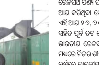
ପଣ୍ୟ ପରିବହନରେ ବୃଦ୍ଧି ସହିତ, ଏହି ଜୋନ୍‌ର ପଣ୍ୟ ପରିବହନ ଆୟରେ ମଧ୍ୟ ଯଥେଷ୍ଟ ବୃଦ୍ଧି ରେକର୍ଡ ହୋଇଛି। ୨୦୨୫-୨୬ ଅର୍ଥକ ବର୍ଷରେ ପୂର୍ବ ତଟ ରେଳପଥ ପଣ୍ୟ ପରିବହନରେ ୨୯.୪୫.୬.୬୦ କୋଟି ଆୟ କରିଥିବା ବେଳେ, ୨୦୨୪-୨୫ ଅର୍ଥକ ବର୍ଷରେ ଏହି ଆୟ ୨୬.୯୯.୮୨ କୋଟି ଥିଲା।

ରାଜଧାନୀ, ୧୪ (ସମ୍ବିଧ): ପୂର୍ବତଟ ରେଳପଥ ପୁଣି ଥରେ ଭାରତୀୟ ରେଳବାଇର ପ୍ରମୁଖ ପଣ୍ୟ ପରିବହନକାରୀ ଜୋନ୍ ଭାବେ ନିଜର ସ୍ଥାନକୁ ସୁଦୃଢ଼ କରିଛି। ୨୦୨୫-୨୬ ଅର୍ଥକ ବର୍ଷରେ ଏହା ୨୮.୬.୩ ନିୟୁତ ଟନ୍ ସର୍ବାଧିକ ପଣ୍ୟ ପରିବହନ ହାସଲ କରିଛି।