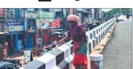
ପଞ୍ଚରୁ ଅନୁଷ୍ଠିତ ହୋଇଥିଲା। କିନ୍ତୁ ଏପ୍ରିଲ ମାସର ପ୍ରଥମ ଦିନକୁ ଅଧିକ ଗୁରୁତ୍ୱ ଦିଆଯାଇ ନ ଥିବାରୁ ଜାତୀୟ ରାଜପଥ ବିଭାଗ ଅଧିକାରୀ ଉକ୍ତ ଓଭରଭିଜ୍ କାମର ପରିଚାଳନା କାର୍ଯ୍ୟରେ ପ୍ରଚଣ୍ଡ ଖରାରେ ଅସହାୟ ଶ୍ରମିକମାନେ ପୂର୍ବାହ୍ନ ସଂଧ୍ୟା ଯାଏଁ କାମ କରୁଥିବାର ଦେଖିବାକୁ ମିଳିଥିଲା।