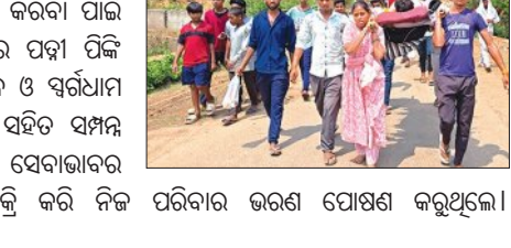
ପରିବାର ଭରଣ ପୋଷଣ କରୁଥିଲେ।

ଦୀର୍ଘଦିନ ଧରି ସେ ଅସୁସ୍ଥ ଥିବାରୁ ତାଙ୍କର ଆଜି ଦେହାନ୍ତ ଘଟିଥିଲା। ଦେହାନ୍ତ ପରେ ଶବ ସଜ୍ଜା କାର୍ଯ୍ୟ ସମ୍ପନ୍ନ କରିବା ପାଇଁ ପରିବାର କୌଣସି ସହାୟତା ପ୍ରାପ୍ତ ହେବା ପରେ ମୃତକଙ୍କ ଶବ ସଜ୍ଜା କରାଯାଇଥିଲା।