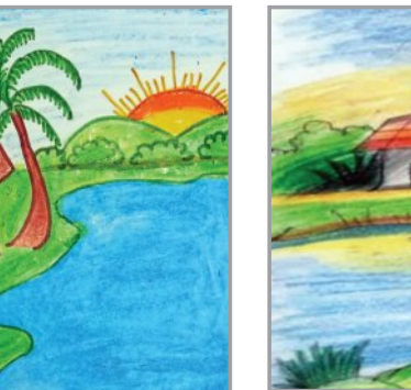
ଏସ୍. ସାଲ ସଙ୍କେତ ତୃତୀୟ ଶ୍ରେଣୀ ରେକର୍ଡେସର ସ୍କୁଲ ନିମାପଡ଼ା