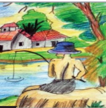
ଏସ୍. ସାଲ ସଙ୍କେତ ତୃତୀୟ ଶ୍ରେଣୀ ରେକର୍ଡେସର ସ୍କୁଲ ନିମାପଡ଼ା