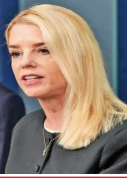
ଆର୍ଟିଷ୍ଟି କେନେରାଲ ବି ବହିଷ୍କୃତ