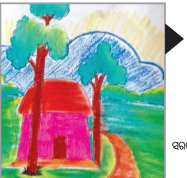
ଶୁଭମ ମହାନ୍ତି ତୃତୀୟ ଶ୍ରେଣୀ ସରକାରୀ ଉଚ୍ଚ ପ୍ରାଥମିକ ବିଦ୍ୟାଳୟ ବିସିପୁର