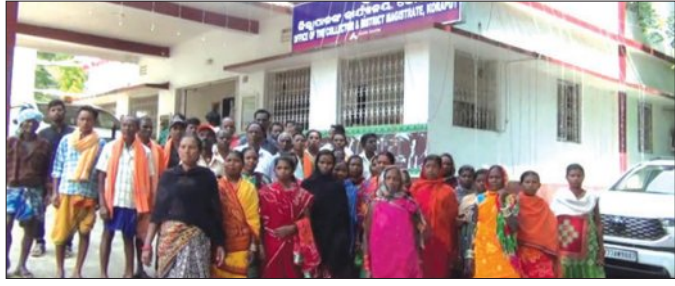
ଜଣାଇଛନ୍ତି । ଏ ସଂକ୍ରମରେ ସ୍ଥାନୀୟ ପାଖରେ କୌଣସି ସୂଚନା ନଥିବା ସେମାନେ ସରପଞ୍ଚ ଓ କାମୁଣ୍ଡା ରାଜସ୍ଵ ନିରୀକ୍ଷକଙ୍କୁ ପ୍ରକାଶ କରିଛନ୍ତି । ଗ୍ରାମବାସୀ କ ସହ ବିନା ଅବଗତ କରାଯାଇଥିଲେ ମଧ୍ୟ ସେମାନଙ୍କ ଆଲୋଚନାରେ ନୂତନ ପୋଖରୀ ଖୋଳା

କୋରାପୁଟ,ମାଟାମା(ସମ୍ବିଧ): କୋରାପୁଟ ଜିଲ୍ଲା ଜୟପୁର ବ୍ଲକ୍ କାମୁଣ୍ଡା ପଞ୍ଚାୟତ ଅନ୍ତର୍ଗତ ବଡ଼ପଡ଼ା ଗ୍ରାମର ବାସିନ୍ଦାମାନେ ଗ୍ରାମରେ ପୋଖରୀ ଖୋଳାକୁ ବିରୋଧ କରି ଜିଲ୍ଲାପାଳଙ୍କ ଦ୍ଵାରସ୍ଥ ହୋଇଛନ୍ତି । ଗ୍ରାମବାସୀଙ୍କ ଅଗୋଚରରେ କାହିଁକି ପୋଖରୀ ଖୋଳାଗଲା ବୋଲି ପ୍ରଶ୍ନ କରିଛନ୍ତି । ନୂଆ ପୋଖରୀ ଖୋଳା ହେବା ନିକଟରେ ପୂର୍ବରୁ ଏକ ପୋଖରୀ, କୁଆ ଓ ଗୋଟିଏ ନଳକୂପ ରହିଥିବା ବେଳେ ସେହି ସ୍ଥାନରେ ପୂର୍ଣ୍ଣ ଏକ ପୋଖରୀ ଆବଶ୍ୟକତା ରହିଛି କି ବୋଲି ଜିଲ୍ଲାପାଳଙ୍କୁ ଲିଖିତ ଭାବେ