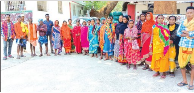
ବାହାରରାଜ୍ୟର ମୁଖ୍ୟମେଲେକାଙ୍କ ହାତକୁ ପଥର ଦ୍ଵାରୀ ବନ୍ଦ କରିବା ନିମନ୍ତେ ସରକାର ଟେକିଦେଇଛନ୍ତି । ପ୍ରତିଦିନ ୫୦୦ରୁ ଅଧିକ

କୋରାପୁଟ,ମାଟାମା(ସମ୍ବିଧ): କୋରାପୁଟ ଜିଲ୍ଲା ଜୟପୁର ବ୍ଲକ୍ କାମୁଣ୍ଡା ପଞ୍ଚାୟତ ଅନ୍ତର୍ଗତ ଉପର କଳଡାଗୁଡ଼ା ଗ୍ରାମରେ ଚିକିତ୍ସା ପାହାଚର ସହି କାଗାରେ ଚାଲୁଥିବା ପଥର କୁଆଁରୀକୁ ବନ୍ଦ କରିବା ନିମନ୍ତେ ଜିଲ୍ଲାପାଳଙ୍କୁ ଦାବି ପତ୍ର ପ୍ରଦାନ କରିଛନ୍ତି । ଗ୍ରାମବାସୀଙ୍କ କହିବା ଅନୁଯାୟୀ, ପୂର୍ବ ପୁରୁଷରୁ ସେମାନେ ଗ୍ରାମ ଅଧିନସ୍ଥ ସହି କାଗାରେ ଥିବା ପାହାଚର ବିବିଧତା ରକ୍ଷାବେକ୍ଷଣ କରିବା ନିମନ୍ତେ ଲୋକମାନଙ୍କ ଠାରୁ ଅର୍ଥ ସଂଗ୍ରହ କରି ଜଗୁଆଳିଙ୍କୁ ବାର୍ଷିକ ଦରମା ଦେଇ ରକ୍ଷଣାବେକ୍ଷଣ କରୁଛନ୍ତି । କିନ୍ତୁ ଏହାକୁ