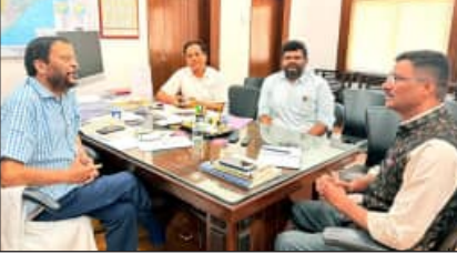
ଆବଶ୍ୟକୀୟ ପଦକ୍ଷେପ ପାଇଁ ଜିଲ୍ଲାପାଳଙ୍କୁ ନିର୍ଦ୍ଦେଶ ଗଣନାକାରୀଙ୍କ ସୁରକ୍ଷା ପାଇଁ ପୁଲିସ୍ ପ୍ରଶାସନକୁ ଦାୟିତ୍ୱ ବିଭିନ୍ନ ଅଘଟଣ ପରେ ସ୍ଥିତି ସମୀକ୍ଷା କଲେ ରାଜ୍ୟ ମନ୍ତ୍ରୀ