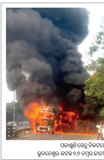
ପକାଣ୍ଡି ସେତୁ ନିକଟରେ ଏକ ମାଲବାହୀ ବସ୍ ଜଳିଯିବା ପରେ ଭୁବନେଶ୍ୱର-କଟକ ୧୬ ନମ୍ବର ଜାତୀୟ ରାଜପଥର ଦୀର୍ଘ ୩ ଘଣ୍ଟା ଧରି ଗ୍ରାମିଣ କାମ୍