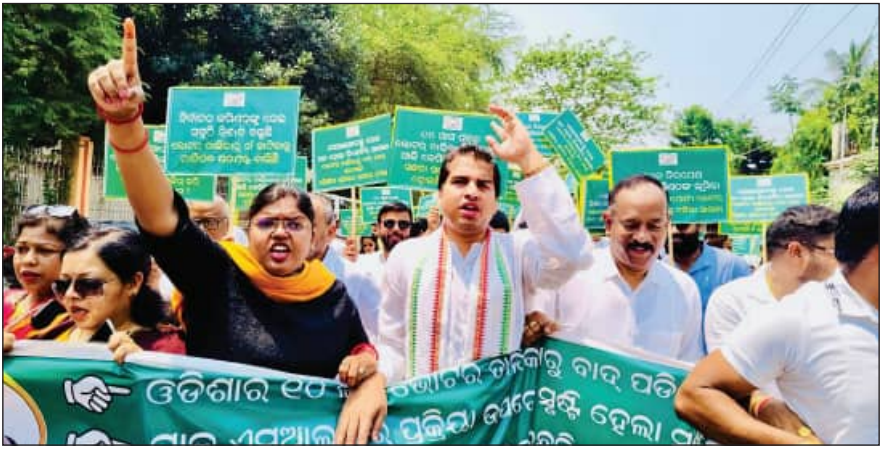
ଏସଆଇଆର ମାଧ୍ୟମରେ ଯୋଗ୍ୟ ଭୋଟରମାନଙ୍କୁ ବାଦ୍ ଦିଆଯିବାର ଆଶଙ୍କା ସୃଷ୍ଟି ଏବଂ ସ୍ୱଳ୍ପ ଓ ନିର୍ଭୁଲ ଯାଞ୍ଚ କରି ବାଦ୍ ପଡ଼ିଥିବା ଭୋଟରଙ୍କୁ ପୁଣି ତାଲିକାରୁକୁ କରାଯାଉ