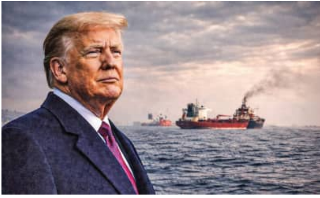
ଆମେରିକା ସେନାର ହର୍ମୁଜ ଅବରୋଧ ଜାରି ତୈଳ ଜାହାଜ ଉପରେ ଗୁଳିମାଡ଼ କରୁଛି ଭରାନ

■ ଖାସିନେ/ଇସଲାମାବାଦ, ୨୨।୪ (ଏକେନି): ଭରାନ ଓ ଆମେରିକା ମଧ୍ୟରେ ୧୫ ଦିନିଆ ଯୁଦ୍ଧ ବିରତି ଆଜି ଶେଷ ହୋଇଥିବା ବେଳେ ଏହାର ଅବଧିକୁ ଅନିର୍ଦ୍ଧିତ କାଳ ପାଇଁ ବୃଦ୍ଧି କରିବାକୁ ଯୋଷଣା କରିଛନ୍ତି ଆମେରିକାର ରାଷ୍ଟ୍ରପତି ଡୋନାଲ୍ଡ ଟ୍ରମ୍ପ। ଶାନ୍ତି ଆଲୋଚନା ପ୍ରକଳ୍ପ ନହେବା ପର୍ଯ୍ୟନ୍ତ ଯୁଦ୍ଧବିରତି ଜାରି ରହିବ। ଏହି ସମୟରେ ଦୁଇ ଦେଶ ମଧ୍ୟରେ ସାମରିକ ସଂଘର୍ଷ ହେବ ନାହିଁ, ତେବେ ହର୍ମୁଜରେ ଆମେରିକାର ନୌସେନା ଅବରୋଧ ଜାରି ରହିବ। ଆମେରିକାର ଏଭଳି ଆଭିମୁଖ୍ୟକୁ ନେଇ ଭରାନ ଭୀଷଣ ପ୍ରତିକ୍ରିୟା ପ୍ରକାଶ କରିବା ସହିତ ହର୍ମୁଜରେ କେତେକ ଜାହାଜ ଉପରେ ଗୁଳିମାଡ଼