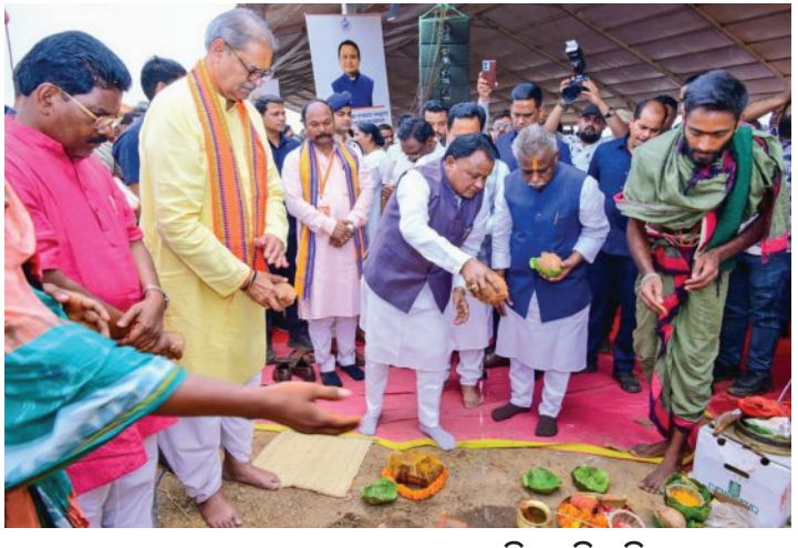
୭ ଲକ୍ଷରୁ ଅଧିକ ଉପଭୋକ୍ତା ପାଇବେ ନିରବଚ୍ଛିନ୍ନ ବିଦ୍ୟୁତ୍ ୨୦୩୬ ସୁଦ୍ଧା ରାଜ୍ୟରେ ନିର୍ମିତ ହେବ ଆହୁରି ୩୪ଟି ନୂଆ ଗ୍ରୀଡ଼ ବିଦ୍ୟୁତ୍ କାର୍ ହେବ; 'ହର୍ଷଲାଇନ ମେଣ୍ଟୋନାନ୍ସ' ମାଧ୍ୟମରେ ମରାମତି