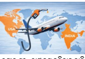
ଉପାଦାନ ଶୁଳ୍କ, ଭାର୍ଟି କମ୍ପାନିର ବିମାନ

■ ନୂଆଦିଲ୍ଲୀ, ୨୮ ୧୪ (ଏକେନ୍ଦ୍ର): ଉଚ୍ଚ ମୂଲ୍ୟ ଏବଂ ଉପରୋଧିକ ଅଭିଯୋଗ ଯୋଗୁଁ ଦେଶର ବିମାନ ଶିଳ୍ପ ଏହାର ଅସ୍ଥିତକୁ ନେଇ ବର୍ତ୍ତମାନ ଫର୍ଦ୍ଦସ୍ କରୁଛି। ପଶ୍ଚିମ ସିଆରେ କାରି ଉତ୍ପାଦନ ଏବଂ ବିମାନ ଚର୍ଚ୍ଚାଳନା ଉତ୍ପାଦନ (ଏଟିଏସ୍) ମୂଲ୍ୟରେ ବୃଦ୍ଧି ଯୋଗୁଁ ବିମାନ କମ୍ପାନୀଗୁଡ଼ିକ ଏକ ବଡ଼ ଆର୍ଥିକ ସଙ୍କଟର ସମ୍ମୁଖୀନ ହେଉଛନ୍ତି। ପରିସ୍ଥିତିର ରାୟଚାଳକୁ ଦୃଷ୍ଟିରେ ରଖି ଦେଶର ପ୍ରମୁଖ ବିମାନ କମ୍ପାନୀଗୁଡ଼ିକ ନେଇ ଗଠିତ ଏଫଏ ପେଡେରେସନ ଅଫ୍ ଇଣ୍ଡିଆନ୍ ଏୟାରଲାଇନ୍ସ (ଏସ୍ଆଇଏ) ଉପାଦାନ ଶୁଳ୍କ ଏବଂ ଭାର୍ଟି କମ୍ପାନିର ବିମାନ ସରକାରଙ୍କ ନିକଟରେ ଦାବି କରିଛି। ଏଫଏ ପେଡେରେସନ ଦେଇଛି ଯେ, ଯଦି ସମାପ୍ତକାରୀ ପଦକ୍ଷେପ ନିଆ ନ ଯାଏ