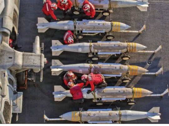
ବିଲିୟନ ଡଲାର ମଧ୍ୟରେ ରହିଥିବା ଅନୁମାନ କରାଯାଇଛି । ବିନେଟର ଜ୍ୟାକ୍ ରିଡ୍‌ଙ୍କ ଅନୁଯାୟୀ, ବର୍ତ୍ତମାନର ଉତ୍ପାଦନ ହାରରେ ଏହି ଯୁଦ୍ଧ ହୋଇପାରେ ଆସ୍ତ୍ରଶସ୍ତ୍ର ଭଣ୍ଡାରକୁ ପୂର୍ଣ୍ଣ ଭରିବା ପାଇଁ ଅନେକ ବର୍ଷ ଲାଗିବ ।

କରାଯାଇଛି । ଏଥିସହିତ, ଜେନେରାଲ୍ ଏବଂ ପ୍ରତିରକ୍ଷା ବିଶେଷଜ୍ଞମାନେ ତୋଡ଼ାବନା ଦେଇଛନ୍ତି ଯେ ଏହି ସ୍ଥିତି ନାଟୋର ପୂର୍ବ ଭାଗ ଏବଂ ଇଣ୍ଡୋ-ପାସିଫିକ୍ ଅଞ୍ଚଳରେ ଆମେରିକାର ସୁରକ୍ଷା ବ୍ୟବସ୍ଥାକୁ ଦୁର୍ବଳ କରିଦେଇଛି । ଫେବୃଆରୀ ମାସରେ ଶେଷ ଭାଗରୁ ଇରାନରେ ଏହି ଯୁଦ୍ଧ ଆରମ୍ଭ ହୋଇଛି । ଦୀର୍ଘ ୩୮ ଦିନ ଧରି ଚାଲିଥିବା ଏହି ସଂଗ୍ରାମ ଯୋଗୁଁ ମଧ୍ୟପ୍ରାନ୍ତରେ ଆମେରିକାର ସାମାଜିକ ରିଭିସ୍ଟ ବୃଦ୍ଧି ପାଇଛି । ପରିଶ୍ରମ ସ୍ୱରୂପ ଯୁଦ୍ଧରେ ଏବଂ ଏସିଆରୁ ସାମାଜିକ ଉପକରଣଗୁଡ଼ିକୁ ସ୍ଥାନାନ୍ତର କରାଯାଇଛି । ଅସ୍ତ୍ରଶସ୍ତ୍ର ବ୍ୟବହାର ଏହାର ଉତ୍ସାହର ହାର ତୁଳନାରେ ବହୁତ ଅଧିକ ରହିଛି । ଏହି ଯୁଦ୍ଧରେ ପ୍ରାୟ ହଜାରରୁ ଅଧିକ ଜୀବନ ହରାଇଛି, ତୋଡ଼ାବନା ମିସାଇଲ ଓ ପାଣିଅର ଇଣ୍ଡରସେପ୍ଟର ମିସାଇଲ ବ୍ୟବହାର କରାଯାଇଛି । ଏହି ମିସାଇଲ ଗୁଡ଼ିକ ବାର୍ଷିକ ଉତ୍ପାଦନ ୧୦ ଗୁଣ ଅଧିକ ବ୍ୟୟ ହେଉଛି । ଗୋଟିଏ ଗୋଟିଏ ତୋଡ଼ାବନା ପାଣିଅର ମିସାଇଲର ମୂଲ୍ୟ ହାରାହାରି ପ୍ରାୟ ୩୪୦୦୦ ୩୮୦ କୋଟି ଟଙ୍କା ରହିଛି । ଏହି ଯୁଦ୍ଧରେ ପ୍ରତିଦିନ ପ୍ରାୟ ୧ ବିଲିୟନ ଡଲାର ବା ୯, ୪୨୪ କୋଟି ଟଙ୍କା ଖର୍ଚ୍ଚ ହେଉଥିବା କୁହାଯାଇଛି । ଏପାର୍ସି ମୋଟ ଖର୍ଚ୍ଚ ୨୮ ଲକ୍ଷ ୩୫