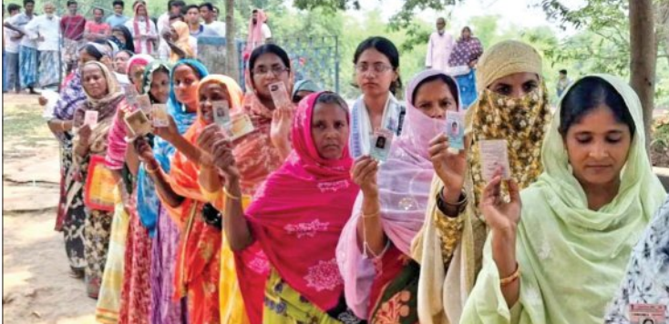
ଭାରତର ନିର୍ବାଚନ କମିସନ ସେମାନଙ୍କୁ ଅଭିନନ୍ଦନ ଜଣାଇଛନ୍ତି । ସୂଚନାଯୋଗ୍ୟ ଯେ ଗତ ୨୦୨୧ ବିଧାନସଭା ନିର୍ବାଚନରେ ପଶ୍ଚିମବଙ୍ଗରେ ସର୍ବାଧିକ ୮୨.୩୦ ପ୍ରତିଶତ ମତଦାନ ହୋଇଥିଲା । କୋଭିଡ୍ ଜଟିଳ ମଧ୍ୟରେ ହୋଇଥିବା ଏହି ନିର୍ବାଚନରେ ମମତା ବାନାର୍ଜୀଙ୍କ ଚୁଣମୂଳ କଂଗ୍ରେସ କୁମାରତ ତୃତୀୟ

■ କୋଲକାତା/ଚେନ୍ନାଇ, ୨୩/୪ (ଏକ୍ସପ୍ରେସ୍): ପ୍ରବଳ ଉତ୍ସାହ ଓ ଉତ୍ତେଜନା ମଧ୍ୟରେ ଆଜି ପଶ୍ଚିମବଙ୍ଗ ବିଧାନସଭା ପାଇଁ ପ୍ରଥମ ପର୍ଯ୍ୟାୟ ଭୋଟ୍ ଗ୍ରହଣ ଶେଷ ହୋଇଥିବା ବେଳେ ତାମିଲନାଡୁର ସମସ୍ତ ୨୩୪ଟି ନିର୍ବାଚନମଣ୍ଡଳୀରେ ମତଦାନ ହୋଇଛି । ଉଭୟ ରାଜ୍ୟରେ ରେକର୍ଡ ମତଦାନ ହୋଇଛି । ପଶ୍ଚିମବଙ୍ଗରେ ୯୨.୫୮ ପ୍ରତିଶତ ମତଦାନ ହୋଇଥିବା ବେଳେ ତାମିଲନାଡୁରେ ୮୫.୧୧ ପ୍ରତିଶତ ମତଦାନ ହୋଇଛି । ସ୍ୱାଧୀନ ଭାବେ ଇତିହାସରେ ଏହି ଦୁଇ ରାଜ୍ୟରେ ଏମିତି ରେକର୍ଡ ମତଦାନ କେ ୥ ବେ ହୋଇନଥିଲା । ଦୁଇ ରାଜ୍ୟରେ ମତଦାନୀ ସେମାନଙ୍କର ଗଣତାତ୍ତ୍ୱିକ ଅଧିକାର ସାବ୍ୟସ୍ତ କରିବାରେ ଇତିହାସ ସୃଷ୍ଟି କରିଛନ୍ତି । ଏଥିପାଇଁ