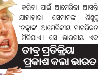
ଟ୍ରମ୍ପ ପ୍ରତିକ୍ରିୟା ପ୍ରକାଶ କଲା ଭାରତ

ଓଫିଟନ, ୨୩।୪(ଏକେନ୍ଦ୍ରି): ଆମେରିକା ରାଷ୍ଟ୍ରପତି ଡୋନାଲ୍ଡ ଟ୍ରମ୍ପ ଜନୁଗତ ନାଗରିକତା ଆଇନକୁ ନେଇ ପୁଣି ଥରେ ବିବାଦୀୟ ହୋଇପଡ଼ିଛନ୍ତି । ନିକଟରେ ସେ ଆମେରିକାୟ ରାଜନୈତିକ ସମାକ୍ଷକ ମାଲକେଲ ସାଭେଲଙ୍କ ଏକ 'ବର୍ଷଦୈବିଷମ' ପୂର୍ଣ୍ଣ ମତବ୍ୟକୁ ନିଜ ସୋସିଆଲ ମିଡିଆ ପ୍ଲାଟଫର୍ମ 'ଟ୍ରୁଥ ସୋସିଆଲ'ରେ ରି-ପୋଷ୍ଟ କରିଛନ୍ତି । ଏହି ପୋଷ୍ଟରେ ଭାରତ ଓ ଚୀନ ଭଳି ଦେଶକୁ 'ହେଲ୍-ହୋଲ୍' ଅର୍ଥାତ୍ 'ନର୍କ ସହ' ବୋଲି ଆମେରିକାୟଙ୍କ ଚାକିରି ଛାଡ଼ାଇ ଦେଇଛନ୍ତି । ରାଷ୍ଟ୍ରପତି ଟ୍ରମ୍ପ ଦାବି ଦିନକୁ ଆମେରିକାରେ ଜନୁଗତ ନାଗରିକତା ଆଇନ ଶେଷ କରିବାକୁ ଚାହୁଁଛନ୍ତି । ଏକ ସାକ୍ଷାତକାରରେ ଟ୍ରମ୍ପ ଦାବି କରିଥିଲେ ଯେ ବିଶ୍ୱର ଭଲି ଦେଶର ଲୋକମାନେ କେବଳ ସମ୍ରାଜ୍ଯ ଜଡ଼ୁ