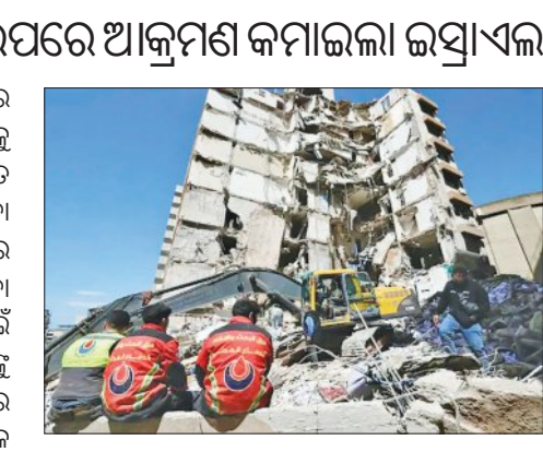
ଯଦିଓ ଦକ୍ଷିଣ ଇରାନରେ ଇସ୍ରାଏଲୀ ସେନା ଓ ହିଜବୁଲ୍ଲା ମଧ୍ୟରେ ସଫର୍ଷ ଜାରି ରହିଛି, ତଥାପି ହିଂସାର ମାତ୍ରା ଯଥେଷ୍ଟ କମିଛି। ଇସ୍ରାଏଲ ପ୍ରଧାନମନ୍ତ୍ରୀ ମୋଦୀଙ୍କୁ ସରକାରଙ୍କ ସହ ସ୍ୱାଭାବିକ ଆଲୋଚନା ପାଇଁ ନିଜ ମନ୍ତ୍ରାଳୟକୁ ନିର୍ଦ୍ଦେଶ ଦେଇଛନ୍ତି। ଏହି ଆଲୋଚନାର ମୁଖ୍ୟ ପ୍ରସଙ୍ଗ ହିଜବୁଲ୍ଲା ନିରାସ୍ତ କରିବା ଉପରେ ଯତ୍ନବେଶିତ ହୋଇପାରେ। କିନ୍ତୁ ଇରାନୀୟ ସରକାର ପୂର୍ବରୁ ସମ୍ପୂର୍ଣ୍ଣ ଅସ୍ତବିରତି ଦାବି କରିଛନ୍ତି। ପୂର୍ବରୁ ଇରାନ କହିଛି ଯେ, ଇରାନୀୟ ହେଉଛି ଅସ୍ତବିରତିରେ ଏକ ଅବିଚ୍ଛେଦ୍ୟ ଅଂଶ। ଯଦି ଇସ୍ରାଏଲ ଆକ୍ରମଣ ଜାରି ରଖେ ତେବେ ଇରାନ ଶାନ୍ତି ଆଲୋଚନାରୁ ଓହରିଯାଉ।