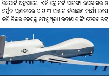
'ୟୁଇଭିଡିଏଟିଏ୧୧୯' ଅନୁଯାୟୀ, ଭ୍ରୋନ୍ଟି ହଠାତ ଇରାନ ଆଡ଼କୁ ସାମାନ୍ୟ ବୁଲିଥିଲା ଏବଂ ଜରୁରୀକାଳୀନ ସଙ୍କେତ କୋଡ୍ ୭୨୦୦ ପଠାଇଥିଲା। ଏହାପରେ ଭ୍ରୋନ୍ ଉଡ଼ତା ଶୁଦ୍ଧ ଦୂରଗତିରେ ହ୍ରାସ ପାଇଥିଲା ଏବଂ ଶେଷରେ ଏହା ନିଖୋଜ ହୋଇଯାଇଥିଲା। ତେବେ ଭ୍ରୋନ୍ଟି କୌଣସି ଯାନ୍ତ୍ରିକ ତ୍ରୁଟି କାରଣରୁ ହର୍ମୁଜର ଗୁରୁତର ଘଟଣା ହୋଇଛି ନା ଏହାକୁ ଗୁଲି କରି ଖସାଇ ଦିଆଯାଇଛି, ସେ ନେଇ ଆମେରିକା ପକ୍ଷରୁ କୌଣସି ସ୍ପଷ୍ଟ ସୂଚନା ଦିଆଯାଇନାହିଁ। ସୂଚନାଯୋଗ୍ୟ ଯେ, ଏହି ଭ୍ରୋନ୍ଟି ଆମେରିକା ନୌସେନାର ଏକ ଗୁରୁତ୍ୱପୂର୍ଣ୍ଣ ସମ୍ପତ୍ତି। ଏହାର ମୂଲ୍ୟ ୨୦୦ ମିଲିୟନ ଡଲାର ଅର୍ଥାତ୍ ୧୨୦୦ କୋଟି ଟଙ୍କାରୁ ଅଧିକ। ଏହା ୫୦, ୦୦୦ ପଦ୍ମକୁ ଅଧିକ ଉଡ଼ତାରେ କ୍ରମାଗତ ୨୪ ଘଣ୍ଟାକୁ ଅଧିକ ସମୟ ଉଡ଼ିପାରେ। ଏହା ସମୁଦ୍ର ମଧ୍ୟରେ ବହୁଦୂର ପର୍ଯ୍ୟନ୍ତ ନିଜର ରଖିବା ସହ ଶତରୁ ଜାହାଜ ଓ ଗତିବିଧିକୁ ନିରୁଦ୍ଧ କରିବାରେ ସୁକ୍ଷ୍ମ। ସାଧାରଣତଃ ଏହାକୁ ସମୁଦ୍ର ଫକାଣ୍ଟି ପଥ ବାଟେ ପ୍ୟଏସ୍ ଗୁଡ଼ିକ ଉପରେ ନଜର ରଖିବା ପାଇଁ ବ୍ୟବହାର କରାଯାଇଥାଏ। ଏହି ଭ୍ରୋନ୍ ହରାଇବା ଆମେରିକା ପାଇଁ ଏକ ବଡ଼ ଆଞ୍ଚିକ ଝଟ୍କା। ପରିବେଶମାନ ଅନୁଯାୟୀ, ଆମେରିକା ଏହି ସ୍ୱତନ୍ତ୍ର ପ୍ରତି ସେକେଣ୍ଡରେ ପ୍ରାୟ ୯.୮ ଲକ୍ଷ ଟଙ୍କା ଖର୍ଚ୍ଚ କରୁଛି।

ନୂଆଦିଲ୍ଲୀ/ଓଫିଫିଫି, ୧୦/୪(ଏକେନି): ଆମେରିକାୟ ନୌସେନାର ସବୁଠାରୁ ବାମା ଏବଂ ଅତ୍ୟାଧୁନିକ ସର୍ଭେଇଲନ୍ସ ଭ୍ରୋନ୍ ଏମ୍-୧୧୯-୪ଏ ଟ୍ରାନ୍ସ ଶୁକ୍ରବାର ହର୍ମୁଜ ପ୍ରଣାଳୀ ଉପରେ ନିଖୋଜ ହୋଇଯାଇଛି। ଉଡ଼ାଣ ସମୟରେ ଏକ ଜରୁରୀକାଳୀନ ସଙ୍କେତ ପଠାଇବା ପରେ ଏହା ରାଡ଼ାରରୁ ବିଚ୍ଛିନ୍ନ ହୋଇଥିବା ଜଣାପଡ଼ିଛି। ଆମେରିକା ଓ ଇରାନ ମଧ୍ୟରେ ଅସ୍ତବିରତି ହେବାର ମାତ୍ର ଦୁଇ ଦିନ ପରେ ଏହି ଘଟଣା ଘଟିବା ଏବେ ପଶ୍ଚିମ ଏସିଆରେ ପୁଣିଥରେ ଉତ୍ତେଜନା ବଢ଼ାଇ ଦେଇଛି। ଫଳରେ ଇରାନ ଓ ଆମେରିକା ମଧ୍ୟରେ ଚାଲିଥିବା ଶାନ୍ତି ପ୍ରକ୍ରିୟା ମଧ୍ୟରେ ଏକ ବଡ଼ ସଙ୍କଟ ସୃଷ୍ଟି ହୋଇଛି ଓ ଏହି ଘଟଣା ଶାନ୍ତି ଆଲୋଚନାରେ ବାଧା ପହଞ୍ଚାଇପାରେ। ଯଦି ଏହି ଭ୍ରୋନ୍କୁ ଇରାନ ଖସାଇଥିବାର ପ୍ରମାଣିତ ହୁଏ, ତେବେ ଏହା ଏକ ଗମ୍ଭୀର କୁଟନୈତିକ ସଙ୍କଟ ସୃଷ୍ଟି କରିବ ଓ ଅସ୍ତବିରତି ପ୍ରକ୍ରିୟାକୁ ବିପଦରେ ପକାଇବ।