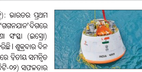
ଅବତରଣ କରିବା ଭଳି ଜଟିଳ ପ୍ରକ୍ରିୟାକୁ ଏଥିରେ ଅତି ସୁସ୍ଥଭାବେ ନିରୀକ୍ଷଣ କରାଯାଇଥିଲା। ଗଗନଯାନ ମିଶନର ସବୁଠାରୁ ଗୁରୁତ୍ୱପୂର୍ଣ୍ଣ ଦିଗ ହେଉଛି ନିରାପତ୍ତ। ଯଦି ମହାକାଶରେ କୌଣସି ଜରୁରୀକାଳୀନ ପରିସ୍ଥିତି ସୃଷ୍ଟି ହୁଏ, କିମ୍ବା ମିଶନକୁ ଅଧାରୁ ବନ୍ଦ କରିବାକୁ ପଡ଼େ, ତେବେ ମହାକାଶକାରୀମାନେ କିପରି ସୁରକ୍ଷିତ ଭାବେ ପୃଥିବୀକୁ ଫେରିବେ, ତାହା ପରୀକ୍ଷା ଦ୍ୱାରା ନିଶ୍ଚିତ

ଗଗନଯାନ ପାଇଁ ଇସ୍ରାଏଲ ଦ୍ୱିତୀୟ ଏୟାର ଡ୍ରାପ ପରୀକ୍ଷା ସଫଳ ଶ୍ରୀହରିକୋଟା, ୧୦/୪(ଏକେନି): ଭାରତର ପ୍ରଥମ ମାନବବାହା ମହାକାଶଯାନ 'ଗଗନଯାନ-୧'ର ଉପରେ ଇରାନୀୟ ମହାକାଶ ଗବେଷଣା ସଂସ୍ଥା (ଇସ୍ରୋ) ଏକ ବୃହତ୍ ସଫଳତା ହାସଲ କରିଛି। ଶୁକ୍ରବାର ଦିନ ସତୀଶ ଧାଞ୍ଜନ ମହାକାଶ କେନ୍ଦ୍ରରେ ଦ୍ୱିତୀୟ ସମ୍ପୂର୍ଣ୍ଣ ପରୀକ୍ଷା (ଏଆଇଡି-୦୨) ସଫଳତାର ପ୍ରତ୍ୟାବର୍ତ୍ତନ ଏବଂ ସେମାନଙ୍କ ସୁରକ୍ଷା ପ୍ରଣାଳୀକୁ ସୁଦୃଢ଼ କରିବାରେ ଏକ ମାଇଲଖୁଣ୍ଟ ସଫଳ ହୋଇଛି। ଏହି ଏୟାର ଡ୍ରାପ ପରୀକ୍ଷାରେ ମୂଳ ଲକ୍ଷ୍ୟ ଥିଲା ମହାକାଶକୁ ପୃଥିବୀକୁ ଫେରିବା ସମୟରେ ବ୍ୟବହୃତ ହେବାକୁ ଥିବା ପାରାଚୁଟ୍ ପ୍ରଣାଳୀ ଏବଂ କୁ-ମୁକ୍ତ୍ୟୁତର ସ୍ଥିରତାକୁ ଯାଞ୍ଚ କରିବା। ଏକ