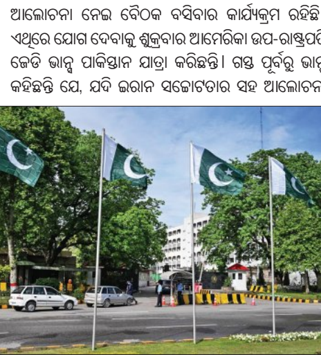
ଆଲୋଚନା ନେଇ ବୈଠକ ବସିବାର କାର୍ଯ୍ୟକ୍ରମ ରହିଛି। ଏଥିରେ ଯୋଗ ଦେବାକୁ ଶୁକ୍ରବାର ଆମେରିକା ଉପ-ରାଷ୍ଟ୍ରପତି କେଟି ଭାଦୁ ପାକିସ୍ତାନ ଯାତ୍ରା କରିଛନ୍ତି। ମୁକ୍ତ ପୂର୍ବରୁ ଭାଦୁ କହିଛନ୍ତି ଯେ, ଯଦି ଇରାନ ସଫାଟତାର ସହ ଆଲୋଚନା

ତେହରାନ, ୧୦/୪(ଏକେନି): ପଶ୍ଚିମ ଏସିଆର ଅଶାନ୍ତ ରାଜନୈତିକ ବାତାବରଣ ମଧ୍ୟରେ ଏବେ ଏକ ନୂତନ ସଙ୍କଟ ଦେଖା ଦେଇଛି। ପାକିସ୍ତାନ ରାଜଧାନୀ ଇସଲାମାବାଦରେ ଆମେରିକା ସହ ହେବାକୁ ଥିବା ଶାନ୍ତି ଆଲୋଚନାରୁ ଇରାନ ଓହରିଯିବା ପାଇଁ ଧମକ ଦେଇଛି। ଇରାନୀୟ ଉପରେ ଇସ୍ରାଏଲ କାର୍ଯ୍ୟକ୍ରମ ଜାରି ରଖିଥିବା ଜଣାପଡିବା ପରେ ଆମେରିକା ସହ ହେବାକୁ ଥିବା ଶାନ୍ତି ଆଲୋଚନାରୁ ଇରାନ ଓହରିଯିବା ପାଇଁ ଧମକ ଦେଇଛି। ଇରାନୀୟ ଉପରେ ଇସ୍ରାଏଲ କାର୍ଯ୍ୟକ୍ରମ ଜାରି ରଖିଥିବା ଜଣାପଡିବା ପରେ ଆମେରିକା ସହ ହେବାକୁ ଥିବା ଶାନ୍ତି ଆଲୋଚନାରୁ ଇରାନ ଓହରିଯିବା ପାଇଁ ଧମକ ଦେଇଛି।