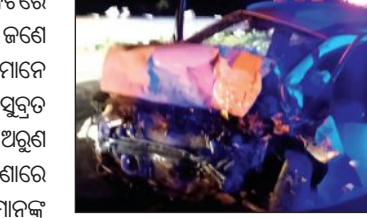
ଉତ୍ତରକୋଟ ଉପଖଣ୍ଡ ସାହ୍ୟକେନ୍ଦ୍ରରେ ଭର୍ତ୍ତି କରାଯାଇଛି।