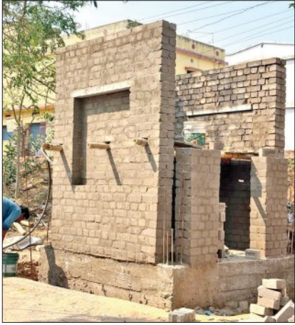
ପାଇଁ ଅଧିକାରୀମାନେ କେଉଁ ଲୋକଙ୍କୁ ନେଇ ସର୍ବେ କଲେ ଏବଂ କିଭଳି ଭାବେ ଜନରହିଲି ପୂର୍ଣ୍ଣ ସ୍ଥାନକୁ ଛାଡ଼ି କର୍ପୋରେଟରଙ୍କ ଘର ନିକଟ ନବାବସ ସର୍ଭିସ ରୋଡ୍

ସରକାରୀ ପ୍ରକଳ୍ପ ଜନସାଧାରଣଙ୍କ ସୁବିଧା ପାଇଁ ନା ପ୍ରଭାବଶାଳୀ ବ୍ୟକ୍ତିଙ୍କ ଚୋଷଣ ପାଇଁ ଏକାଧିକ ପ୍ରକଳ୍ପ ଏବେ କଟକ ମହାନଗର ନିଗମର ୫୬ ନମ୍ବର ଓଡ଼ିଆରେ ଚର୍ଚ୍ଚାର ବିଷୟ ପାଲଟିଛି। ଓଡ଼ିଆରେ ପଢ଼ିବା ନିମନ୍ତେ ହେଉଥିବା ନୂତନ ଅଣ୍ଟାପାନାୟକ ପ୍ରକଳ୍ପକୁ ନେଇ ବିବାଦ ଘନେଇବାରେ ଲାଗିଛି। ଅଞ୍ଚଳବାସୀଙ୍କ ବିରୋଧ ସତ୍ତ୍ୱେ କିଛି ଅଧ୍ୟାୟ ଅଧିକାରୀ ଓ ରାଜନୈତିକ ବ୍ୟକ୍ତିଙ୍କଦ୍ୱାରା ଏହି ପ୍ରକଳ୍ପକୁ ଯେନାଦେନା ପ୍ରକାଶରେ ଶେଷ କରିବାକୁ କୋରସର ଯୋଜନା ଚଳାଇଥିବା ସୂଚନା ମିଳିଛି।