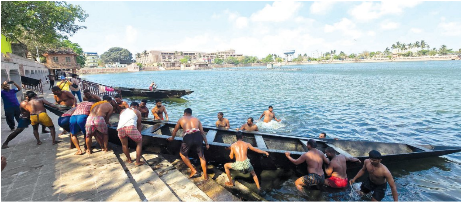
ମହାପ୍ରଭୁଙ୍କ ଚାପ ଖେଳ ପାଇଁ ନରେନ୍ଦ୍ର ପୁଷ୍କରିଣୀରୁ ତଙ୍ଗା ବାହାର କରାଯାଇଛି