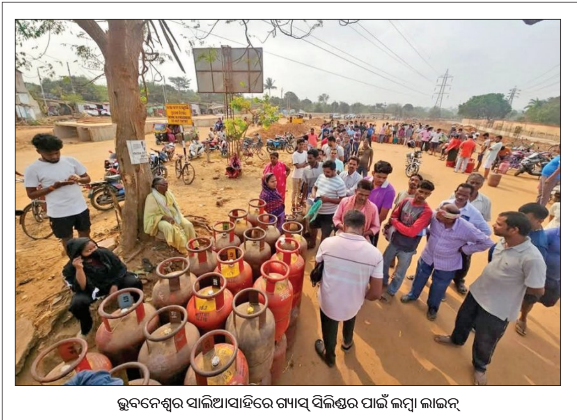
ଭୁବନେଶ୍ୱର ସାଲିଆସାହିରେ ଗ୍ୟାସ୍ ସିଲିଣ୍ଡର ପାଇଁ ଲମ୍ବା ଲାଇନ୍