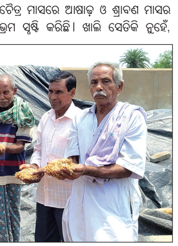
ଚୈତ୍ର ମାସରେ ଆଷାଢ଼ ଓ ଶ୍ରାବଣ ମାସର ମେଘ ଘୋଟି ଆସିବା ସହ ପ୍ରବଳ ଗାଈଲି। ଚୈତ୍ର ସୃଷ୍ଟି କରିଛି। ଖାଲି ସେତିକି ନୁହେଁ,

ଓ ସନ୍ଧ୍ୟା ବେଳେ ଆକାଶରେ କଳାହାଣ୍ଡିଆ ମେଘ ଘୋଟି ଆସିବା ସହ ପ୍ରବଳ ଗାଈଲି। ଚୈତ୍ର ମାସରେ ଆଷାଢ଼ ଓ ଶ୍ରାବଣ ମାସର ମେଘ ଘୋଟି ଆସିବା ସହ ପ୍ରବଳ ଗାଈଲି। ଚୈତ୍ର ସୃଷ୍ଟି କରିଛି। ଖାଲି ସେତିକି ନୁହେଁ, ଉତ୍ତର ମାସରେ ଆଷାଢ଼ ଓ ଶ୍ରାବଣ ମାସର ଚୈତ୍ର ସୃଷ୍ଟି କରିଛି। ଖାଲି ସେତିକି ନୁହେଁ, ଉତ୍ତର ମାସରେ ଆଷାଢ଼ ଓ ଶ୍ରାବଣ ମାସର ଚୈତ୍ର ସୃଷ୍ଟି କରିଛି। ଖାଲି ସେତିକି ନୁହେଁ,