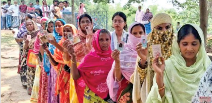
ଭାରତର ନିର୍ବାଚନ କମିସନ ସେମାନଙ୍କୁ ଅଭିନନ୍ଦନ ଜଣାଇଛନ୍ତି । ସୂଚନାଯୋଗ୍ୟ ଯେ ଗତ ୨୦୨୧ ବିଧାନସଭା ନିର୍ବାଚନରେ ପଶ୍ଚିମବଙ୍ଗରେ ସର୍ବାଧିକ ୮୨.୩୦ ପ୍ରତିଶତ ମତଦାନ ହୋଇଥିଲା । କୋଭିଡ଼ କଟକଣା ମଧ୍ୟରେ ହୋଇଥିବା ଏହି ନିର୍ବାଚନରେ ମମତା ବାନାର୍ଜୀଙ୍କ ଡୁଗ୍ ଲୁକ୍ କଂଗ୍ରେସ କୁମାରତ ତୃତୀୟ

କୋଲକାତା/ଚେନ୍ନାଇ, ୨୩/୪ (ଏକେଡି): ପ୍ରବଳ ଉତ୍ସାହ ଓ ଉତ୍ସାହନା ମଧ୍ୟରେ ଆଜି ପଶ୍ଚିମବଙ୍ଗ ବିଧାନସଭା ପାଇଁ ପ୍ରଥମ ପର୍ଯ୍ୟାୟ ଭୋଟ ଗ୍ରହଣ ଶେଷ ହୋଇଥିବା ବେଳେ ତାମିଲନାଡୁର ସମସ୍ତ ୨୩୪ଟି ନିର୍ବାଚନମଣ୍ଡଳରେ ମତଦାନ ହୋଇଛି । ଉଭୟ ରାଜ୍ୟରେ ରେକର୍ଡ ମତଦାନ ହୋଇଛି । ପଶ୍ଚିମବଙ୍ଗରେ ୯୧.୫୮ ପ୍ରତିଶତ ମତଦାନ ହୋଇଥିବା ବେଳେ ତାମିଲନାଡୁରେ ୮୪.୨୯ ପ୍ରତିଶତ ମତଦାନ ହୋଇଛି । ସ୍ୱାଧୀନ ଭାବେ ଭୋଟ ଦେବାରେ ଏହି ଦୁଇ ରାଜ୍ୟରେ ଏମିତି ରେକର୍ଡ ମତଦାନ କେ ୧୧ ବେ ହୋଇନଥିଲା । ବୁଲ ରାଜ୍ୟରେ ମତଦାନ ସେମାନଙ୍କର ଗଣତାନ୍ତ୍ରିକ ଅଧିକାର ସାବ୍ୟସ୍ତ କରିବାରେ ଉପହାସ ସୃଷ୍ଟି କରିଛନ୍ତି । ଏଥିପାଇଁ