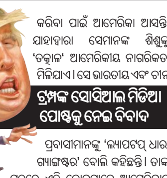
ଟ୍ରମ୍ପଙ୍କ ସୋସିଆଲ ମିଡ଼ିଆ ପୋଷ୍ଟକୁ ନେଇ ବିବାଦ

ଓଫିଟନ, ୨୩।୪(ଏକେନ୍ଦ୍ରି): ଆମେରିକା ରାଷ୍ଟ୍ରପତି ଡୋନାଲ୍ଡ ଟ୍ରମ୍ପ ଜନୁଗତ ନାଗରିକତା ଆଇନକୁ ନେଇ ପୁଣି ଥରେ ବିବାଦୀୟ ହୋଇପଡ଼ିଛନ୍ତି । ନିକଟରେ ସେ ଆମେରିକା ଗଣନୈତିକ ସମାକ୍ଷକ ମାଲକେଲ ସାଭେଲଙ୍କ ଏକ 'ବର୍ଷଦିବସମ' ପୂର୍ଣ୍ଣ ମତବ୍ୟକୁ ନିଜ ସୋସିଆଲ ମିଡ଼ିଆ ପ୍ଲାଟଫର୍ମ 'ଟ୍ରୁଥ ସୋସିଆଲ'ରେ ରି-ପୋଷ୍ଟ କରିଛନ୍ତି । ଏହି ପୋଷ୍ଟରେ ଭାରତ ଓ ଚୀନ ଭଳି ଦେଶକୁ 'ହେଲ-ହୋଲ' ଅର୍ଥାତ 'ନର୍ଦ୍ଦେଶପୂର୍ଣ୍ଣ' ବୋଲି ପରାକାକୁ ଅପମାନିତ କରୁଛନ୍ତି ଏବଂ ଶ୍ରେତକାୟ ଆମେରିକାୟଙ୍କ ଚାକିରି ଛାଡ଼ାଇ ନେଇଛନ୍ତି । ରାଷ୍ଟ୍ରପତି ଟ୍ରମ୍ପ ଦାବି କରୁଛନ୍ତି ଆମେରିକାରେ ଜନୁଗତ ନାଗରିକତା ଆଇନ ଶେଷ କରିବାକୁ ଚାହୁଁଛନ୍ତି । ଏକ ସାକ୍ଷାତକାରରେ ଟ୍ରମ୍ପ ଦାବି କରିଥିଲେ ଯେ ବିଶ୍ୱ