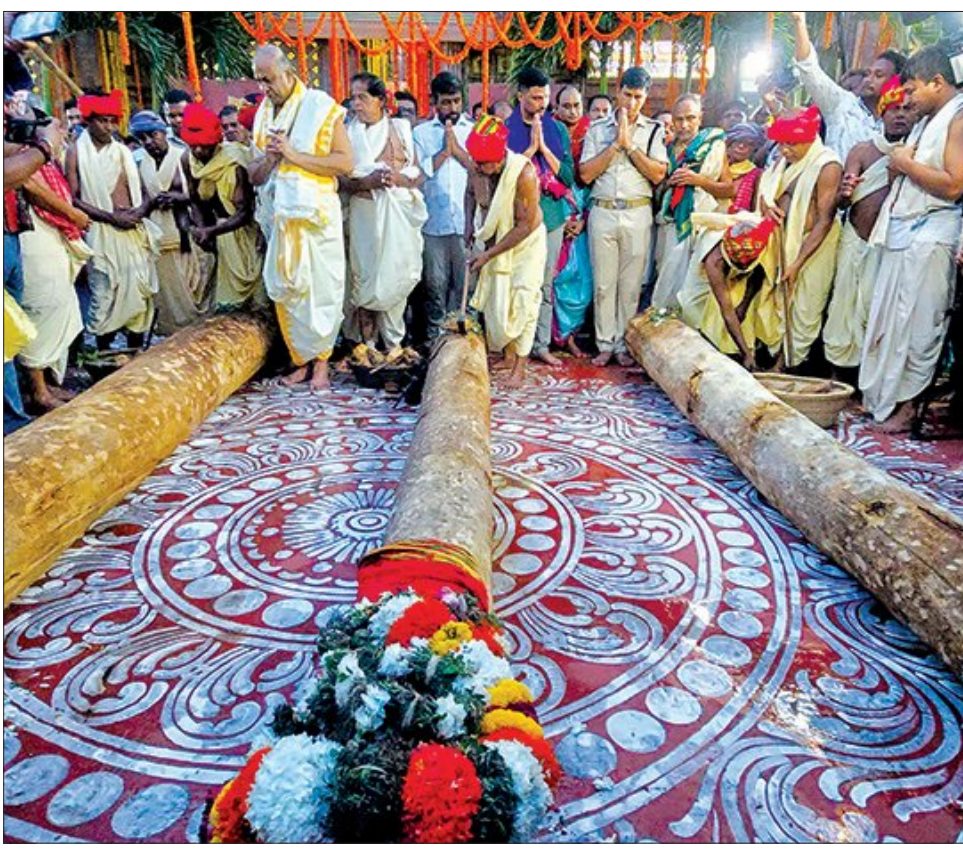
ପୁରୀ ରଥ ନିର୍ମାଣ କାର୍ଯ୍ୟରେ ଅନୁକୂଳ ହେଲା ପ୍ରସ୍ତୁତି