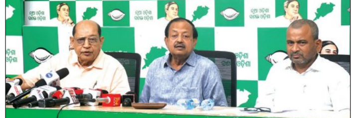
୧୨ ରାଜ୍ୟ ଓ କେନ୍ଦ୍ର ଶାସିତ ଅଞ୍ଚଳରୁ ୫ କୋଟିରୁ ଊର୍ଦ୍ଧ୍ୱ ବାଦ୍