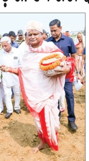
ଅଧିକୃତ ଅନୁକୂଳ ଓ କୃଷି ରଥର ଶୁଭାରମ୍ଭ କଲେ ମୁଖ୍ୟମନ୍ତ୍ରୀ

■ କଟକ, ୨୦୧୪ (ଏକ୍ସପ୍ରେସ୍): ଓଡ଼ିଶା ଏକ କୃଷି ପ୍ରଧାନ ରାଜ୍ୟ ଏବଂ ତାହା ଆମର ଗର୍ବ । କୃଷି ଓ କୃଷକଙ୍କ କଲ୍ୟାଣ ହେଲେ ହିଁ ରାଜ୍ୟରେ ସୁନାମ ପାଇବ । ଫଳିତ କୃଷି ମୁଖ୍ୟମନ୍ତ୍ରୀ ମୋହନ ଚରଣ ମାଝୀ ପ୍ରକାଶ କରିଛନ୍ତି । ସାମାଜିକ ପବିତ୍ର ଅକ୍ଷୟ ତୃତୀୟା ତଥା ରାଜ୍ୟସ୍ତରୀୟ କୃଷକ ଦିବସ ଅବସରରେ କଟକ ବିଦ୍ୟାଳୟରୁ ସ୍ୱୀକୃତି କେନ୍ଦ୍ରୀୟ ଧାନ ଗବେଷଣା ପ୍ରତିଷ୍ଠାନ (ସିଆରଆରଆଇ) ଠାରେ ଆୟୋଜିତ ଭବ୍ୟ ସମାରୋହରେ ମୁଖ୍ୟମନ୍ତ୍ରୀ ହଜାର ହଜାର ତାଷାଙ୍କୁ ଉଦ୍‌ବୋଧନ ଦେଇଥିଲେ । ଏହି ଅବସରରେ ମୁଖ୍ୟମନ୍ତ୍ରୀ ତିବିଟି ମାଧ୍ୟମରେ 'ସିଏମ୍ କିଷାନ' ଯୋଜନାର ଚର୍ଚ୍ଚିତ କିଷ୍ଟି ପ୍ରଦାନ କରିଛନ୍ତି । ରାଜ୍ୟର ୪୧ ଲକ୍ଷରୁ ଊର୍ଦ୍ଧ୍ୱ ତାଷାଙ୍କ ବ୍ୟାଙ୍କ ଖାତକୁ ସମୁଦାୟ ୮୩୮ କୋଟି ଟଙ୍କା ପ୍ରଦାନ କରାଯାଇଛି । ଦୀର୍ଘ ୧୯ ବର୍ଷର ବ୍ୟବଧାନ ପରେ ବଡ଼ମ୍ବା ଚିନିକଳର ପୁନରୁଦ୍ଧାର କରାଯାଇଥିବାରୁ ସେଠାକାର ବିଧାୟକ ଓ ତାଷାମାନଙ୍କ ପକ୍ଷରୁ ମୁଖ୍ୟମନ୍ତ୍ରୀଙ୍କୁ ଭବ୍ୟ ସମ୍ବର୍ଦ୍ଧନା ଜାପାନ