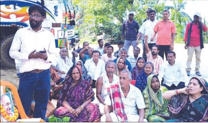
ଭୋଗରାଇ, ୧୦୪ (ସମିଧ)

ସୁବର୍ଣ୍ଣରେଖା ନଦୀରୁ ବାଲି ଉତ୍ତୋଳନ ବନ୍ଦ ଓ ଦେଆଇନ ବାଲି ଚୋରା କାରବାରରେ ସମ୍ପୂର୍ଣ୍ଣ ଥିବା ବ୍ୟକ୍ତିଙ୍କ ବିରୋଧରେ କାର୍ଯ୍ୟାନୁଷ୍ଠାନ ଦାବି କରି ବାଲେଶ୍ୱର ଜିଲ୍ଲା ଭୋଗରାଇ ବ୍ଲକ କମର୍ସିଆଲ ଥାନା ସମ୍ମୁଖରେ ଆଜି ମନୁଗର ଗ୍ରାମବାସୀ ପ୍ରତାପ ଧାରଣା ଦେଇଥିଲେ। ୫୦ରୁ ଅଧିକ ଗ୍ରାମବାସୀ ଦୀର୍ଘ ସମୟ ଧାରଣା, ବିରୋଧ ଓ ନାରାବାଦି ପ୍ରଦର୍ଶନ କରିବା ପରେ କମର୍ସିଆଲ ଥାନା ଚୋରା କାରବାରୀଙ୍କ ବିରୋଧରେ ଖୁବ୍ ଶୀଘ୍ର କାର୍ଯ୍ୟାନୁଷ୍ଠାନ ନିଆଯିବ ବୋଲି ପ୍ରତିଶ୍ରୁତି