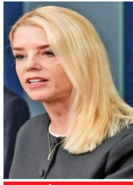
ଆର୍ଟିକ୍ଲ କେନେରାଲ ବି ଦଣ୍ଡିତ

ଓହ୍‌ଟନ, ୩୩୪(ଏକେନ୍ସି): ଇରାନ ଯୁଦ୍ଧରେ ବିଫଳତା ପରେ ଆମେରିକାର ରାଷ୍ଟ୍ରପତି ଡୋନାଲ୍ଡ ଟ୍ରମ୍ପ ତାଙ୍କର ସବୁ ରାଜ ସେନା ମୁଖ୍ୟଙ୍କ ଉପରେ ସୂଚନା ଦେଇଛନ୍ତି। ବିଫଳତା ପାଇଁ ପରୋକ୍ଷରେ ତାଙ୍କୁ ଦାୟୀ କରି ସେନା ମୁଖ୍ୟ ପଦରୁ ରେଣ୍ଡି ଜର୍ଜଙ୍କୁ ହଟାଇ ଦେଇଛନ୍ତି। ଏହାପରେ 'ଏପ୍ରିଲ ପାଇଲ ପାଇଁ' ଆର୍ଟିକ୍ଲ କେନେରାଲଙ୍କୁ ମଧ୍ୟ ଦଣ୍ଡିତ କରିଛନ୍ତି। ମାତ୍ର ୨୪ ଘଣ୍ଟା ମଧ୍ୟରେ ସେନା ମୁଖ୍ୟ ଏବଂ ଆର୍ଟିକ୍ଲ କେନେରାଲଙ୍କୁ ପଦରୁ ହଟାଇଛନ୍ତି। ଇରାନ ସହ ଚାଲିଥିବା ଯୁଦ୍ଧ ମଧ୍ୟରେ ଟ୍ରମ୍ପ ଆମେରିକା ସେନା ମୁଖ୍ୟ କେନେରାଲ ରେଣ୍ଡି ଜର୍ଜଙ୍କୁ ଦୂରରେ ରଖିବାକୁ ନେତୃତ୍ୱ ଦେବାକୁ କୁହାଯାଇଛି। ଜର୍ଜଙ୍କ କାର୍ଯ୍ୟକାଳ ୨୦୨୧ରେ ଶେଷ ହେବାର ଥିଲା। କିନ୍ତୁ ଟ୍ରମ୍ପ ସରକାର ନିଜର ବିଶ୍ୱସ୍ତ ଲୋକଙ୍କୁ ସେନାର ଶୀର୍ଷ ପଦରେ ରଖିବାକୁ ଚାହୁଁଛନ୍ତି। ସେହିପରି ଦେଶର ଆର୍ଟିକ୍ଲ କେନେରାଲ ପ୍ୟାମ୍ ଦଣ୍ଡିକ୍ସ ମଧ୍ୟ ଦଣ୍ଡିତ କରାଯାଇଛି। କୁହାଯାଇଛି ଯେ, ଦଣ୍ଡିକ୍ସ 'ଏପ୍ରିଲ ପାଇଲ' ମାମଲାକୁ ଠିକ୍ ଭାବେ ପରିଚାଳନା କରିପାରି ନଥିଲେ। ଲୋକଙ୍କ ଆଶା ଥିଲା ଯେ ଏହି ପାଇଲକୁ କିଛି ବଡ଼ ରହସ୍ୟ ଖୋଲିବ, କିନ୍ତୁ ଦଣ୍ଡିକ୍ସ ଦ୍ୱାରା କାର୍ଯ୍ୟକାରୀ ପଦକ୍ଷେପ ନେଇ ନଥିଲେ। ଏବେ କଥା ଉପରେ ଯେ କାହିଁକି ଏହି ନିଷ୍ପତ୍ତି ନିଆଯାଇଛି? ରିପୋର୍ଟ ଅନୁଯାୟୀ ରାଷ୍ଟ୍ରପତି ଟ୍ରମ୍ପ ଏବଂ ଯୁଦ୍ଧ ସଚିବ ପିଟ୍ ହେଗସ୍ପେଥ ସେନାକୁ ନିଜର ନୂତନ