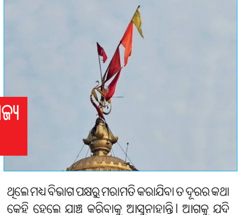
କୁମ୍ଭକର୍ଣ୍ଣ ନିଦ୍ରାରେ ରାଜ୍ୟ ପ୍ରତ୍ନତତ୍ତ୍ଵ ବିଭାଗ

ରତ ଶାବିନ ଧରି କାଳବୈଶାଖୀ ପ୍ରଭାବରେ ଘନଘନ ବଜ୍ରପାତରେ ବାବା ଆଖଣ୍ଡଳମଣି ମନ୍ଦିର ଚୁଡ଼ା ଦଧିନଉତିରେ ଭାଙ୍ଗିଥିବା ତ୍ରିଶୂଳର କିଛି ଅଂଶ ଭାଙ୍ଗିଯିବା ସହ ଗୋଟିଏ ପାର୍ଶ୍ଵକୁ ଭଙ୍ଗି ପଡ଼ିଛି । ଏପରି ଭାଙ୍ଗିଥିବା ନେତ୍ରିକ୍ରିୟା ଉପକ୍ରମିତ ହେଇଛି । ସୂଚନା ଅନୁଯାୟୀ, ଦୀର୍ଘ ୨ବର୍ଷରୁ ଉର୍ଦ୍ଧ୍ଵ ହେବ ମନ୍ଦିରର ସୁରକ୍ଷା ପାଇଁ ଭାଙ୍ଗିଥିବା ଆର୍ଥିକ ପ୍ଲେଟ୍ ଅବଳା ହୋଇପଡ଼ିବା ଦ୍ଵାରା ବଜ୍ରପାତ ନିୟନ୍ତ୍ରଣ କରିପାରୁ ନ ଥିବା ଜଣାପଡ଼ିଛି । ଏପରି ସମସ୍ୟା ବାବଦରେ ରାଜ୍ୟ ପ୍ରତ୍ନତତ୍ତ୍ଵ ବିଭାଗ ପାଖରେ ଖବର