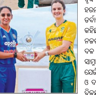
ଡର୍ବନରେ ଆରମ୍ଭ ହେବାକୁ ଯାଉଛି ଟି-୨୦ ସିରିଜ୍

ଦକ୍ଷ ଅଲରାଉଣ୍ଡର ନେଇ ଗଠିତ ଦକ୍ଷିଣ ଆଫ୍ରିକା ଏକ ଶକ୍ତିଶାଳୀ ଦଳ । ଗତ କିଛି ବର୍ଷ ଧରି ସେମାନେ ଭଲ ପ୍ରଦର୍ଶନ କରିଆସୁଛନ୍ତି । ଏଭଳି ଶକ୍ତିଶାଳୀ ଦଳ ବିପକ୍ଷରେ ଖେଳିଲେ ମନୋବଳ ବୃଦ୍ଧି ପାଇଥାଏ ବୋଲି ହରମନପୁର୍ ଗୁରୁବାର ଡର୍ବନରେ ସାମ୍ବାଦିକ ଏହା କହିଛନ୍ତି । ରେକର୍ଡ୍ ଉପରେ ନଜର ପକାଇଲେ ଉଭୟ ଦଳ ଟି-୨୦ରେ ୧୯ଥର ସାମ୍ବାଦିକ ହୋଇଛନ୍ତି । ଯେଉଁଥିରେ ଭାରତ ୧୦ଥର ଓ ଦକ୍ଷିଣ ଆଫ୍ରିକା ୬ଥର ବିଜୟ ହାସଲ କରିଛି । ଡର୍ବନରେ ଆମେ ଟି-୨୦ ସିରିଜ୍ ଜିତିବା । ଦିନିକିଆ ବିଶ୍ୱକପ୍ ବିଜୟ ପରେ ଖେଳାଳିଙ୍କ ମନୋବଳ ବୃଦ୍ଧି ରହିଛି । ନିକଟରେ ଅଷ୍ଟ୍ରେଲିଆ ବିପକ୍ଷରେ ୨-୧ରେ ଏକ ଡିସେମ୍ବରରେ ଶ୍ରୀଲଙ୍କା ବିପକ୍ଷରେ ୫-୦ରେ ଆମେ ଟି-୨୦ ସିରିଜ୍ ଜିତିଥିଲୁ । ଟି-୨୦ ବିଶ୍ୱକପ୍ ପୂର୍ବରୁ ଦଳର କମ୍‌ପେକ୍ସିଭିଟି ସଜାଡ଼ିବାକୁ ଆମ ଲାଗି ଏହା ଏକ ଭଲ ସୁଯୋଗ ।