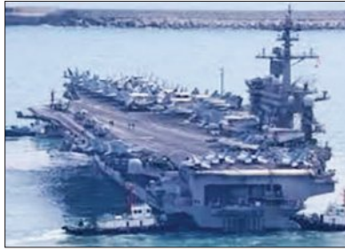
■ ମଧ୍ୟପ୍ରାନ୍ତକୁ ଅଧିକ ସେନା ପଠାଇଛି ଆମେରିକା ■ ଜଳ ଓ ସ୍ଥଳପଥରେ ଇରାନକୁ ଘେରିବ

ଓଫିଟନ, ୧୬/୪(ଏକେନ୍ଦ୍ର): ଆମେରିକା ଏବଂ ଇରାନ ମଧ୍ୟରେ ଜାରି ରହିଥିବା ଦୁଇ ସପ୍ତାହର ଯୁଦ୍ଧବିରତି ଅବଧି ଆସନ୍ତା ଏପ୍ରିଲ ୨୨ ରେ ଶେଷ ହେବାକୁ ଯାଇଛି । ଏହି ସମୟଯାମା ପୂର୍ବରୁ ଆମେରିକା ମଧ୍ୟପ୍ରାନ୍ତ ଅଞ୍ଚଳ ନିଜର ସାମରିକ ଶକ୍ତି ବୃଦ୍ଧି କରିବା ପାଇଁ ଅଧିକ ସୈନ୍ୟ ପଠାଇବାକୁ ନିଷ୍ପତ୍ତି ନେଇଛି । 'ଦି ଓଫିଟନ ପୋଷ୍ଟ'ର ରିପୋର୍ଟ ଅନୁଯାୟୀ, ଆଗାମୀ ଦିନରେ ହଜାର ହଜାର ସୈନ୍ୟ ଏହି ଅଞ୍ଚଳରେ ପହଞ୍ଚିବେ । ରିପୋର୍ଟ ମୁତାବକ, ଆମେରିକାର ବିମାନବାହୀ ଜାହାଜ ଯୁଏସ୍ଏସ୍ ଜର୍ଜ ଏଡ଼ବଲ୍ଡ୍ ସୁଦ୍ଧା ସହିତ ପ୍ରାୟ ୬, ୦୦୦ ସୈନ୍ୟ ଏବଂ ଅନ୍ୟାନ୍ୟ ସୂକ୍ଷ୍ମ ଜାହାଜ ଚଳିତ ମାସ ଶେଷ ପୂର୍ଣ୍ଣା ମଧ୍ୟପ୍ରାନ୍ତରେ ପହଞ୍ଚିବେ । ଏହା ବ୍ୟତୀତ ପ୍ରାୟ ୪, ୨୦୦ ନୌସେନା ଏବଂ ମେରାଇନ କର୍ମଚାରୀ ମଧ୍ୟ ଏହି ମିଶନରେ ସାମିଲ ହେବେ । ବର୍ତ୍ତମାନ ଆମେରିକାର ପ୍ରତିରକ୍ଷା ବିଭାଗ ପେଣ୍ଡାଗନର ପ୍ରାୟ ୫୦, ୦୦୦ କର୍ମଚାରୀ ଇରାନ ବିରୋଧୀ ଅପରେସନରେ ନିୟୋଜିତ ଅଛନ୍ତି । ସେପଟେ ଆମେରିକା ରାଷ୍ଟ୍ରପତି ଡୋନାଲ୍ଡ୍ ଟ୍ରମ୍ପ ହୁଏତର ଏକ ସାକ୍ଷାତକାରରେ କହିଛନ୍ତି ଯେ, ଇରାନ ସହ ଚାଲିଥିବା ଏହି ଏଫଏର୍ଷ୍ଟ ଖୁବଶୀଘ୍ର ଶେଷ ହୋଇପାରେ । ସେ ଆଶା ପ୍ରକାଶ କରିଛନ୍ତି