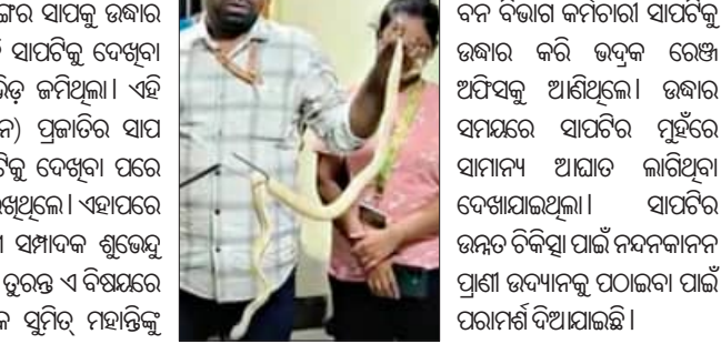
ଅବଗତ କରାଯାଇଥିଲା । ସହକାରୀ ବନ ସଂରକ୍ଷକ ନିର୍ଦ୍ଦେଶକ୍ରମେ ବନ ବିଭାଗ କର୍ମଚାରୀ ସାପଟିକୁ ଉଦ୍ଧାର କରି ଭଦ୍ରକ ରେଞ୍ଜ ଅଧିକାରୀ ଆଣିଥିଲେ । ଉଦ୍ଧାର ସମୟରେ ସାପଟିର ମୁହଁରେ ସାମାନ୍ୟ ଆଘାତ ଲାଗିଥିବା ଦେଖାଯାଇଥିଲା । ସାପଟିର ଉନ୍ନତ ଚିକିତ୍ସା ପାଇଁ ନନ୍ଦନକାନନ ପ୍ରଶା ବ୍ୟାପାରୀଙ୍କୁ ପଠାଇବା ପାଇଁ ଚରାମର୍ଶ ଦିଆଯାଇଛି ।