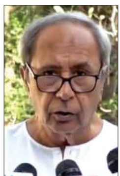
ଓଡ଼ିଶାବାସୀଙ୍କ ନିକଟରେ ବିଜେପିର ମୁଖ୍ୟ ଖୋଲି ଯାଇଛି ଅନ୍ୟାୟ ବିରୋଧରେ ବିଜେପିର ଜଣେ ବି ସଂସଦ ସ୍ୱର ଉଠାଇଲେ ନାହିଁ ଓଡ଼ିଶାର ଅଧିକାର ପାଇଁ ବିଜେଡି ସର୍ବଦା ଲଢ଼େଇ ଜାରି ରଖିବ

■ ଭୁବନେଶ୍ୱର, ୧୮ (ସମ୍ପାଦକ): କେନ୍ଦ୍ର ସରକାର ଆଣିଥିବା ସମ୍ବିଧାନର ୧୩୧ ତମ ସଂଶୋଧନ ବିଲ୍ ୨୦୨୬କୁ ନେଇ ବିଜେପି ରାଜନୈତିକ ଦଳ କେନ୍ଦ୍ର ସରକାରଙ୍କୁ କଢ଼ା ସମାଲୋଚନା କରୁଛନ୍ତି । ଏପରିକି ଶୁକ୍ରବାର ମହିଳା ସଂରକ୍ଷଣ ବିଲ୍ ସଂସଦରେ କାର୍ତ୍ତ୍ୱ ଶାଲବା ପରେ ଏହା ବିରୋଧୀଙ୍କ ନୈତିକ ବିଜୟ ଏବଂ ସରକାରଙ୍କର ପରାଜୟ ବୋଲି ବିରୋଧୀ ଦଳ ମତବ୍ୟକ୍ତ କରିଛନ୍ତି । ଏପରିକି ମହିଳା ସଂରକ୍ଷଣ ବିଲ୍ ସହ ସୀମା ପୁନଃ ନିର୍ଦ୍ଧାରଣ ବିଲ୍କୁ ଯୋଡ଼ିବା ପଛରେ କେନ୍ଦ୍ର ସରକାରଙ୍କ ମନ୍ତ୍ର ଉଦ୍ଦେଶ୍ୟ ଥିଲା ବୋଲି ସାଧାରଣରେ ମତପ୍ରକାଶ ଯାଇଛି । ଏହିକ୍ରମରେ ସୀମା ପୁନଃନିର୍ଦ୍ଧାରଣ ବିଲ୍ ପ୍ରତିଯୋଗୀରେ ବିଜେପି କିପରି ଓଡ଼ିଶାର ଅଧିକାର, ସ୍ୱାର୍ଥ ସହ ସାଲିସ୍ କଲା, ତାହା ରାଜ୍ୟବାସୀ ଦେଖିଲେ ବୋଲି କହି କଢ଼ା ସମାଲୋଚନା କରିଛନ୍ତି ବିଜେଡି ସଭାପତି ତଥା ବିରୋଧୀ ଦଳ ନେତା ନବୀନ ପଟ୍ଟନାୟକ । ଏପରିକି ଏହି ଅନ୍ୟାୟ ବିରୋଧରେ ଓଡ଼ିଶାର ଜଣେ ହେଲେ ବି ବିଜେପି ସଂସଦ ସ୍ୱର ଉଠାଇବାକୁ ନିର୍ଦ୍ଦେଶ ଦେଇଛନ୍ତି । ଶନିବାର ଗଣମାଧ୍ୟମ ପ୍ରତିନିଧିଙ୍କୁ ଏନେଇ ପ୍ରତିକ୍ରିୟା ଦେଇ ନବୀନ କହିଛନ୍ତି ଯେ ବିଜେଡି ସର୍ବଦା ପଞ୍ଚାୟତ ସ୍ତରରୁ ସଂସଦ ପର୍ଯ୍ୟନ୍ତ ମହିଳା ସଂରକ୍ଷଣ ବିଲ୍ ଠିକ୍ ହୋଇଛି । ମାତ୍ର ଆମେ ସୀମା ନିର୍ଦ୍ଧାରଣ ମାଧ୍ୟମରେ ଓଡ଼ିଶାର ରାଜନୈତିକ ଶକ୍ତି ଶ୍ରାସ କରିବା ବିରୁଦ୍ଧରେ ସମ୍ପୂର୍ଣ୍ଣ ବିରୋଧ କରୁଛୁ । ଓଡ଼ିଶାର ଲୋକମାନେ ଦେଖିଛନ୍ତି ଯେ ସେମାନଙ୍କ ଅଧିକାର ପାଇଁ କିଏ ଲଢ଼ିଛି ଏବଂ ବିଜେପି । ପୃଷ୍ଠା-୭