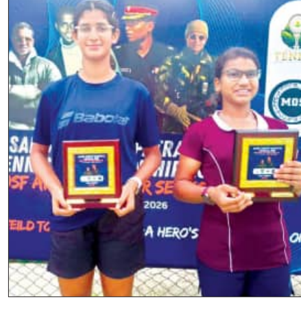
ମେଜର ସମାପ୍ତ ମେମୋରିଆଲ ସୁପର ସିରିଜ୍