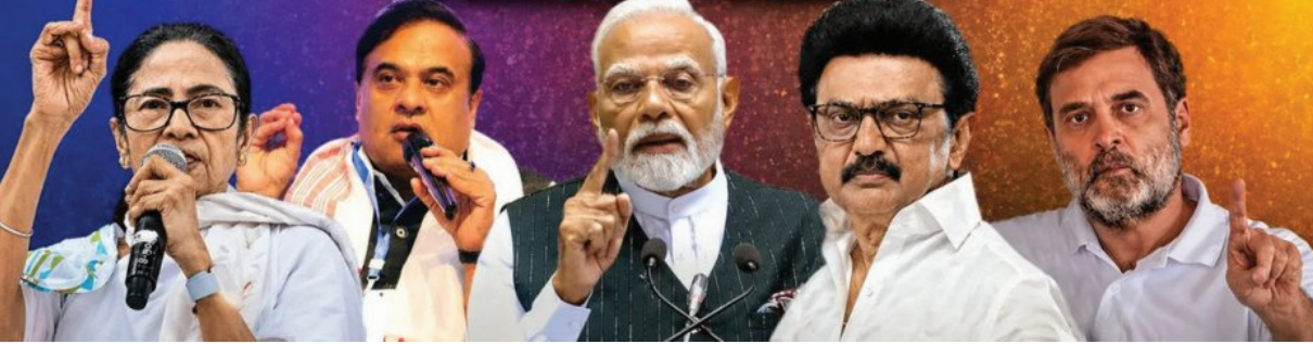
ଦର୍ଶାଯାଇଛି ଯେ ଡିଏମ୍‌ସି ୧୨୭ରୁ ୧୪୦ ଏବଂ ବିଜେପିକୁ ୧୪୬ରୁ ୧୨୧ ଆସନ ମିଳିପାରେ। ସେହିଭଳି ପି-ମାକ୍ ପକ୍ଷରୁ କୁହାଯାଇଛି ଯେ ବିଜେପିକୁ ୧୫୦ରୁ ୧୬୫ ଏବଂ ଡିଏମ୍‌ସିକୁ ୧୧୮ରୁ ୧୩୮ ଆସନ ମିଳିପାରେ। ଜନମତ ପୋଲ୍ ପକ୍ଷରୁ କୁହାଯାଇଛି ଯେ ଡିଏମ୍‌ସି ଏଥର ମଧ୍ୟ ବିପୁଲ ବିଜୟ ମିଳିବ। ଦକ୍ଷିଣ ୧୯୫ରୁ ୨୦୫ ପର୍ଯ୍ୟନ୍ତ ଆସନ ମିଳିବ ଏବଂ ବିଜେପି ୮୦ରୁ ୯୦ ଆସନ ମଧ୍ୟରେ ସୀମିତ ରହିବ। ଏହା ତୁଳନା ଚ୍ୟାସ୍ ।

୨୦୨୧ରେ ବୁଦ୍ଧିବାହୁଡ଼ା ମତଠାରୁ ଅଧିକ ଆସନ ପାଇଥିଲା ଡିଏମ୍‌ସି ଗତ ତିନିଟି ନିର୍ବାଚନରେ ପଶ୍ଚିମବଙ୍ଗରେ ଫେଲ୍ ମାରିଛି ବୁଦ୍ଧିବାହୁଡ଼ା ମତ ୧୦ ବର୍ଷ ପରେ କେରଳରେ ବଦଳିପାରେ ସରକାର