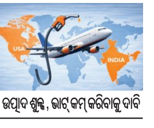
ଉପାଦାନ ଶୁଳ୍କ, ଭାର୍ଟି କମ୍ପାନୀରୁ ଦାବି

ଉପରେ ୧୧% ଉପାଦାନ ଶୁଳ୍କକୁ ଅଧ୍ୟାୟ ଭାବରେ ସ୍ଥଗିତ ରଖିବାକୁ ସରକାରଙ୍କୁ ଅନୁରୋଧ କରିଛନ୍ତି। ଆହୁରି ମଧ୍ୟ ସରକାରୀ ଏବଂ ଘରୋଇ ବିମାନ ଉଡ଼ାଣ ପାଇଁ ଏକ ସମାନ ମୂଲ୍ୟ ନିର୍ଦ୍ଧାରଣ ବ୍ୟବସ୍ଥା ପନଃସ୍ଥାପନ କରିବାକୁ ସଂଘ କହିଛନ୍ତି। ପଶ୍ଚିମ ଏସିଆରେ ଅଣାଗି ଯୋଗୁଁ ଅନେକ ରୁଟିରେ ପ୍ରତିବନ୍ଧକ ଲାଗୁ କରାଯାଇଥିବା ବିମାନଗୁଡ଼ିକ ଲମ୍ବା ଋତୁ ବେଳେ ଉଡ଼ାଣ କରିବାକୁ ପଡୁଛି। ପରିଶୋଧନ ପାଇଁ କମ୍ପାନୀଗୁଡ଼ିକର ପରିଚାଳନା ଖର୍ଚ୍ଚ ବହୁତ ବୃଦ୍ଧିପାଇଛି। ବର୍ତ୍ତମାନ ବିମାନ କମ୍ପାନୀଗୁଡ଼ିକ ପାଇଁ ଏକ ପ୍ରମୁଖ ସମସ୍ୟା ହେଉଛି, ମୂଲ୍ୟ ନିର୍ଦ୍ଧାରଣରେ ଗୁରୁତ୍ୱପୂର୍ଣ୍ଣ ଅବହେଳା ଏବଂ ଏଫଆଇଏ ଚାର୍ଜ ଅନୁସାରେ, ଗତ ମାସରେ ସରକାର ଘରୋଇ ବିମାନ ପାଇଁ ଏଟିଏଫ୍ ମୂଲ୍ୟ ବୃଦ୍ଧି ୧୫ ଟଙ୍କା ପ୍ରତି ଲିଟର ପର୍ଯ୍ୟନ୍ତ ସୀମିତ କରିଥିଲେ। ବିପରୀତରେ, ଅନ୍ତର୍ଜାତୀୟ ବିମାନ କମ୍ପାନୀଗୁଡ଼ିକ ପାଇଁ ଏଟିଏଫ୍ ମୂଲ୍ୟ ପ୍ରତି ଲିଟର ୬୩ ଟଙ୍କା ବୃଦ୍ଧି କରାଯାଇଥିଲା। ଏଟିଏଫ୍ ମୂଲ୍ୟରେ ଏପରି ଅଧିକ ବୃଦ୍ଧି ବିଭାଗରେ ମନ୍ତ୍ରଣାଳୟ ସଂଘ ତରଫରୁ ନେଇଛନ୍ତି। ଏହା ବିମାନ କମ୍ପାନୀଗୁଡ଼ିକକୁ ବହୁତ ଖରଚି ପଡ଼ୁଥିବା ହେତୁ ଅପରିଚିତ ଜାରି ରହିଲେ ବିମାନ କମ୍ପାନୀଗୁଡ଼ିକ ବନ୍ଦ ହୋଇଯାଇପାରେ। ଯଦି ବର୍ତ୍ତମାନର ମୂଲ୍ୟ ବୃଦ୍ଧି ପାଇବା ଜାରି ରହେ, ତେବେ ଘରୋଇ ଏବଂ ଆନ୍ତର୍ଜାତୀୟ ବିମାନ କମ୍ପାନୀଗୁଡ଼ିକ ପରିଚାଳନା କରିବା ଅସମ୍ଭବ ହୋଇଯିବ। ଏହା ସମଗ୍ର ବିମାନ ଶିଳ୍ପକୁ ଏକ ଗଭୀର ସଙ୍କଟ ଭେଦକୁ ଚେଳିବେଦ।