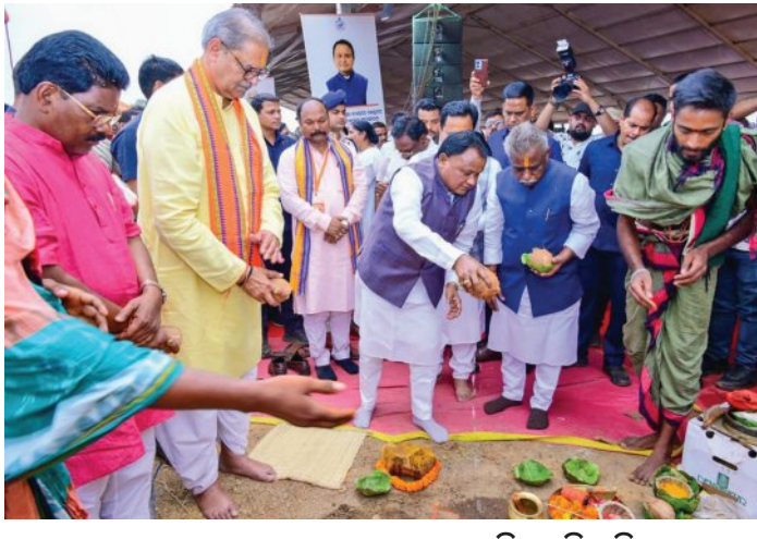
୭ ଲକ୍ଷରୁ ଅଧିକ ଉପଭୋକ୍ତା ପାଇବେ ନିରବଚ୍ଛିନ୍ନ ବିଦ୍ୟୁତ୍ ୨୦୩୬ ସୁଦ୍ଧା ରାଜ୍ୟରେ ନିର୍ମିତ ହେବ ଆହୁରି ୩୪ଟି ନୂଆ ଗ୍ରାଡ୍ ବିଦ୍ୟୁତ୍ କାର୍ ହେବ; 'ହର୍ଷଲୀନ ମେସୋନାୟ' ମାଧ୍ୟମରେ ମରାମତି