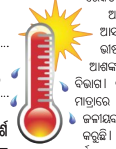
ବିକଳ ଘଡ଼ି ଘଡ଼ି ସହିତ ବର୍ଷା ଅପନ ପାଇଁ ପାନ ଅନୁରୁକ୍ତ କରିଛି। ଏହି କ୍ରମରେ ଆସବା ୩-୪ ଦିନ

■ କୁବନେଶ୍ୱର, ୨୮ ୧୪ (ସମିପ): କାଳବୈଶାଖୀ ପୂର୍ବରୁ ରାଜ୍ୟରେ ତାତି ଭାଙ୍ଗିଛି ରେକର୍ଡ। ଚଳିତ ବର୍ଷ ପ୍ରଥମ ଥର ପାଇଁ ରାଜ୍ୟରେ ଡାକ୍ଷିଣାତ୍ୟ ୪୫ ଡିଗ୍ରୀ ଅତିକ୍ରମ କରିଛି। ପଞ୍ଚାୟତରାଜ ରାଜ୍ୟରେ ମୋଟ ୧୩ ଟି ସହରରେ