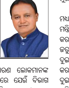
ହୋଇନାହିଁ ବା ସାଧାରଣ ଲୋକମାନଙ୍କ ସମସ୍ୟା ଦୂର କରିବାରେ ଯେଉଁ ବିଭାଗ ଦିପ୍ତ ହୋଇଛି, ସେହି ବିଭାଗର ମନ୍ତ୍ରୀମାନଙ୍କୁ ପରିବର୍ତ୍ତନ କରିବା ବା ସେମାନଙ୍କୁ ବାଦ କେନ୍ଦ୍ରପତ୍ର ନିଶ୍ଚିତ ହୋଇଛି। ଅଧ୍ୟକ୍ଷରେ

ମନ୍ଦିମଣ୍ଡଳ ସମ୍ପ୍ରସାରଣ ହୋଇପାରେ ବୋଲି ଆପତତ୍ୟ ନିଶ୍ଚିତ ହେ। ଦିଲ୍ଲୀରେ ଦଳର ଶୀର୍ଷ ନେତୃତ୍ୱରେ ଚାଲିଥିବା ବିଚାରବିମର୍ଶ ଅନୁସାରେ ଓଡ଼ିଶାରେ ମନ୍ତ୍ରୀମାନଙ୍କୁ ଦକ୍ଷତା ଅକଳନ କରି ଏକ ସାନ ରିପୋର୍ଟ ପ୍ରସ୍ତୁତ କରିବାକୁ ପରାମର୍ଶ ଦିଆଯାଇଛି। ତେବେ କେଉଁ ଆଧାରରେ ମନ୍ତ୍ରୀମାନଙ୍କ ଦକ୍ଷତା ଓ କାର୍ଯ୍ୟକୁ ଆକଳନ କରାଯିବ ସେ ଫଳାଫଳରେ ମୁଖ୍ୟମନ୍ତ୍ରୀଙ୍କୁ ପୂର୍ଣ୍ଣ ସାଧାରଣ ପ୍ରଦାନ କରାଯାଇଥିବା ବିଶ୍ୱସ୍ତ ପ୍ରଚୁର ପ୍ରଦାନ ନିଶ୍ଚିତ। ଏହି ରିପୋର୍ଟ ନିଜର ପରେ ମନ୍ଦିମଣ୍ଡଳ ସମ୍ପ୍ରସାରଣ କେବେ ହେବ ତାହା ସ୍ଥିର କରାଯିବ। ତେବେ ଜୁନ୍ ୧୨ ତାରିଖରେ ସରକାରଙ୍କ ଦୁଇ-ବର୍ଷ ପୂର୍ଣ୍ଣ ଅଧ୍ୟକ୍ଷତା ପାଲଟିବ।