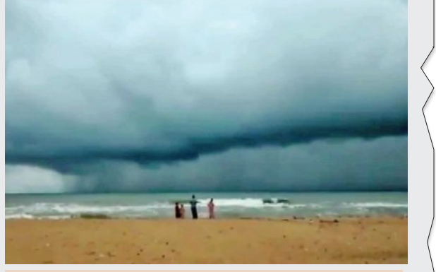
ମେ' ଶେଷ ସୁଦ୍ଧା ମିଳିବ ପ୍ରଚଣ୍ଡ ଖରାପ ଆଶ୍ଚର୍ଯ୍ୟ

୪୪ ତିନି ସେଲସିୟସ୍ ରହୁଥିବାରୁ ଏହା ସମୁଦ୍ର ଆର୍ଦ୍ର ବାୟୁକୁ ଶୀଘ୍ର ଚାଣିବାରେ ସାହାଯ୍ୟ କରିବ ବୋଲି କୁହାଯାଇଛି। ବର୍ଷାର ଆଗୁଆ ଆଗମନ ହେଲେ ଗ୍ରୀଷ୍ମ ଋତୁରେ ଅତିଷ୍ଠ ହେଉଥିବା କୋଟି କୋଟି ଭାରତୀୟଙ୍କ ପାଇଁ ଏବଂ ବିଶେଷ କରି କୃଷି କାର୍ଯ୍ୟ ଉପରେ ନିର୍ଭର କରୁଥିବା ଚାଷୀଙ୍କ ପାଇଁ ବହୁତ ଲାଭଦାୟକ ହେବ। ଯଦି ବାୟୁମଣ୍ଡଳୀୟ ପରିସ୍ଥିତିରେ କୌଣସି ବଡ଼ ପରିବର୍ତ୍ତନ ନହୁଏ, ତେବେ ମେ ୨୫ ବେଳକୁ ଦକ୍ଷିଣ ଭାରତରେ ବର୍ଷା ଋତୁ ଆରମ୍ଭ ହୋଇଯିବ ବୋଲି ସମ୍ଭାବନା ଦେଖାଦେଇଛି।