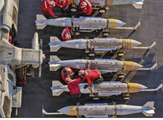
ବିଲିୟନ ଡଲାର ମଧ୍ୟରେ ରହିଥିବା ଅନୁମାନ କରାଯାଇଛି । ବିନେଟର ଜ୍ୟାକ୍ ରିଭକ୍ ଅନୁଯାୟୀ, ବର୍ତ୍ତମାନର ଉତ୍ପାଦନ ହାରରେ ଏହି ଶେଷ ହୋଇପାରେ ନାହିଁ । ଅସ୍ତ୍ରଶସ୍ତ୍ର ଉତ୍ପାଦନରୁ ସୁରକ୍ଷିତ ରହିବା ପାଇଁ ଅନେକ ବର୍ଷ ଲାଗିବ ।

ନୂଆଦିଲ୍ଲୀ, ୨୪୪ (ଏକେପ୍ରି): ଇରାନ ବିରୋଧରେ ସାମରିକ କାର୍ଯ୍ୟାନୁଷ୍ଠାନ ପାଇଁ ଇସ୍ରାଏଲ ପ୍ରଧାନମନ୍ତ୍ରୀ ବେନ୍ୟାମିନ ନେତନ୍ୟାହୁଙ୍କ ରଖନାଟିକୁ ନେଇ ଏକ ସାକ୍ଷାତକାରରେ କହିଛନ୍ତି ଯେ ନେତନ୍ୟାହୁ ଦାଫି ଦିନରୁ ପୂର୍ବତନ ବୈଦେଶିକ ସଚିବ ଜର୍ ଜେରୀ ଏକ ଚାଷ୍ଟ୍ରଲ୍ୟକ୍ଷର ତଥ୍ୟ ପ୍ରକାଶ କରିଛନ୍ତି । ତାଙ୍କ କହିବା ଅନୁସାରେ, ଇସ୍ରାଏଲ ପ୍ରଧାନମନ୍ତ୍ରୀ ବେନ୍ୟାମିନ ନେତନ୍ୟାହୁଙ୍କ ଇରାନ ବିରୋଧୀ ଯୁଦ୍ଧ ଯୋଜନାକୁ ପୂର୍ବରୁ ତିନିଜଣ ଆମେରିକାୟ ରାଷ୍ଟ୍ରପତି ଯଥା ଭଳି ଚଳୁଥିବା ଦୂର, ବାରାକ ଓବାମା ଏବଂ ଜୋ ବାଇଡେନ ପ୍ରତ୍ୟାଖ୍ୟାନ କରିଥିଲେ । କିନ୍ତୁ ପରବର୍ତ୍ତୀ ସମୟରେ ତୋନାଲ୍ ଟ୍ରମ୍ ଏହି ବିବାଦୀୟ ଯୋଜନାକୁ ଅନୁମୋଦନ କରିଥିଲେ, ଯାହା ବର୍ତ୍ତମାନ ବିଶ୍ୱ ରାଜନୀତିରେ ଆଲୋଚନା ସୃଷ୍ଟି କରିଛି ।