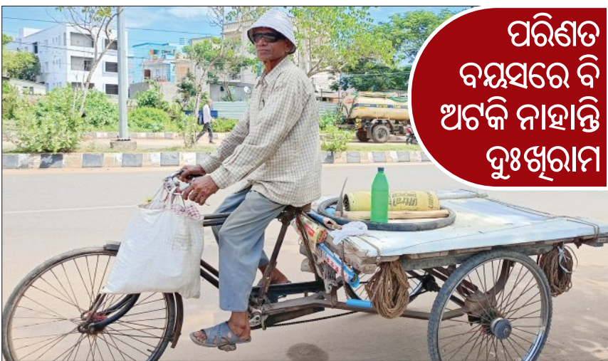
ପରିଶ୍ରମ ବୟସରେ ବି ଅଟକି ନାହାନ୍ତି ଦୁଃଖୀମାନେ

ଭିନ୍ନ ଭିନ୍ନ ମଣିଷର ଭିନ୍ନ ଏକ କାହାଣୀ ଥାଏ। ସେ ଜୀବିକା କରେ, ପରିବାର ପୋଷେ ଏବଂ ଏସବୁରେ ନିଜକୁ ଭୁଲି ସେହି ଜୀବିକାକୁ ବଞ୍ଚାଇବାରେ ଲାଗିପଡ଼େ। ସେହିପରି ଏକ ମଣିଷ ହେଉଛନ୍ତି ଦୁଃଖୀମାନେ। ନା ତାଙ୍କର ଦୁଃଖୀମାନେ ହେଲେ ହସ ହସ ମୁହଁରେ ତାଙ୍କ ଫୁଲି ରାଜଧାନୀ ରାସ୍ତାରେ ଗଡ଼ୁଥାଏ। ତାଙ୍କ ପ୍ରକୃତ ଘର ଉତ୍କଳ। ହେଲେ ପରିବାର ପୋଷିବା ଲାଗି ଘରୁ ଦାଉଁ ୨୮ ବର୍ଷ ହେବ ଆସି ରାଜଧାନୀର ଶିରିପୁରରେ ଥିବା ଏକ ବସ୍ତିରେ ରହୁଛନ୍ତି। ସେ ପ୍ରଥମେ ଗୋଟିଏ ସିମେଣ୍ଟ କମ୍ପାନୀରେ ରହି କାମ କରୁଥିଲେ ହେଲେ ସେ କମ୍ପାନୀଟି