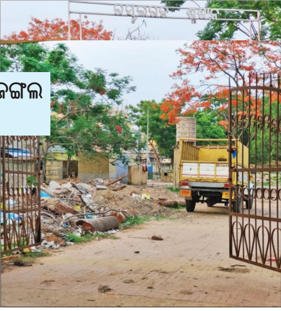
ଜରାଜୀର୍ଣ୍ଣ ଅବସ୍ଥାରେ ପଡ଼ି ରହିଛି। ଶୁଶାନ ପରିସରରେ ଗଛକଟା ମାଡ଼ି ଯାଇଥିବା ବେଳେ ଅଧିକାଂଶ ପାଣି ଜମି ରହି ଦୁର୍ଗନ୍ଧ ସୃଷ୍ଟି ହେଉଛି। ଅନେକ

ପ୍ରାୟ ୪୦ବର୍ଷରୁ ଉର୍ଦ୍ଧ୍ୱ ବର୍ଷ ହେବ ରସୁଲଗଡ଼ରେ ଏହି ମଞ୍ଜୁଳା ନିର୍ମାଣ କରାଯାଇଥିଲା। ସେତେବେଳେ ଲୋକସଂଖ୍ୟା କମ୍ ଥିବାବେଳେ ବର୍ତ୍ତମାନ ଏଠାରେ ହୁ ହୁ ହୋଇ ଜନସଂଖ୍ୟା ବୃଦ୍ଧି ପାଇଛି। ପାଣ୍ଡରା, ଜଗନ୍ନାଥ ବିହାର, ରସୁଲଗଡ଼ ଗାଁ ଆଦି ଅଞ୍ଚଳରେ ବାସ କରୁଥିବା ପ୍ରାୟ ୧୫ରୁ ୨୦ ହଜାର ଲୋକ ଏହି ଶୁଶାନକୁ ନିର୍ଭର କରିଥାନ୍ତି। ସହର ମଧ୍ୟରେ ଶବଦାହ କରିବାକୁ ଜାଗାଟିଏ ପାଇବା ବଡ଼ କଷ୍ଟ ହୋଇଥିବା ବେଳେ ଏଠାରେ ପ୍ରାୟଦେବତ୍ର ଏକର ପରିମିତ ଜାଗାରେ ରହିଥିବା ବହୁ ପୁରୁଣା ଶୁଶାନ ଏବେବି ପରିଚୟ ଭାବେ ରହି ଯାଇଛି। ତେଣୁ ଏହାର ରକ୍ଷଣାବେକ୍ଷଣ କରାଯାଇ ନଥିବାରୁ ତାହା