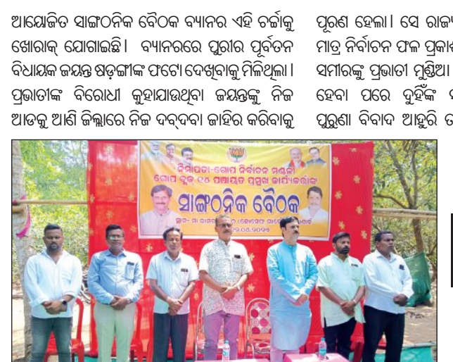
ଆଜ୍ଞାନିକ ବୈଠକର ସମୟରେ ଉପସ୍ଥିତ ଅତିଥିମାନଙ୍କ ସହିତ ଆଜ୍ଞାନିକ ବୈଠକର ସମ୍ପର୍କମାନେ ଆଶଙ୍କାବ୍ୟକ୍ତ କରିଛନ୍ତି ।