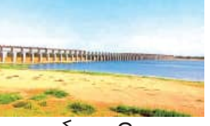
ପରବର୍ତ୍ତୀ ଶୁଣାଣି ଆସନ୍ତା ୨୦ ଚାରିଖକୁ ଧାର୍ଯ୍ୟ

■ ଭୁବନେଶ୍ୱର, ୧୧/୪ (ସମିପ): ମହାନଦୀ ଜଳ ବିବାଦ ମାମଲା ଲମ୍ବି ଲମ୍ବି ଚାଲିଥିବା ବେଳେ ଏହାର ସମାଧାନର ରାସ୍ତା ବାହାରି ପାରିଲା ନାହିଁ। ଟ୍ରିବ୍ୟୁନାଲରେ ୫୧ଟି ଶୁଣାଣି ସରିଥିବା ବେଳେ ଏପର୍ଯ୍ୟନ୍ତ ଉଚ୍ଚତମ ନିର୍ଦ୍ଦେଶ ଦେଇ କୌଣସି ମଧ୍ୟବର୍ତ୍ତୀକାଳୀନ ରାୟ ପ୍ରକାଶ ପାଇଲା ନାହିଁ। ଅପରପକ୍ଷେ ଟ୍ରିବ୍ୟୁନାଲ କାର୍ଯ୍ୟକାଳ ଆସନ୍ତା ୧୩ ଚାରିଖରେ ସମାପ୍ତ ହେଉଥିବା ବେଳେ କେନ୍ଦ୍ର ସରକାର ଆଜି ୯ ମାସ ପାଇଁ ବୃଦ୍ଧି କରିଛନ୍ତି। ଏନେଇ କେନ୍ଦ୍ର ଜଳ ଶକ୍ତି ମନ୍ତ୍ରାଳୟ ପକ୍ଷରୁ ଶୁକ୍ରବାର ବିଧିବଦ୍ଧ ରେକର୍ଡ ବିଜ୍ଞପ୍ତି ପ୍ରକାଶ ପାଇଛି। ଆସନ୍ତା ୧୪ ଚାରିଖରୁ ଏହି ନିର୍ଦ୍ଦେଶନା ଲାଗୁ ହେବାକୁ ଥିବାବେଳେ ୨୦୨୬ ମସିହା ଜୁଲାଇ ୧୩ ଚାରିଖ ଯାଏଁ ଟ୍ରିବ୍ୟୁନାଲ କାର୍ଯ୍ୟକାଳ ଅବଧି ରହିବ। ଟ୍ରିବ୍ୟୁନାଲ କାର୍ଯ୍ୟକାଳ ବୃଦ୍ଧି ସହ ପରବର୍ତ୍ତୀ ଶୁଣାଣି ଏପ୍ରିଲ ୨୦ ଚାରିଖରେ ଧାର୍ଯ୍ୟ ହୋଇଥିବା ନେଇ ଓଡ଼ିଶାର ଆତ୍ମୋକ୍ତେଷ୍ଟ ଜେନେରାଲ (ଏଭି)