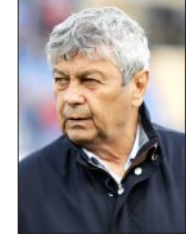
୫ ଦିନ ତଳେ ଛାଡ଼ିଥିଲେ ରୋମାନିଆ ଦଳ

ବୁଚାରେଷ୍ଟ, ୮୪ (ଏକେଡ଼ି): କିମ୍ବଦନ୍ତୀ ଫୁଟବଲ୍ କୋଚ୍ କିମ୍ବଦନ୍ତୀ ଲୁସେସ୍କୁକ୍ ଗତକାଲି ୮୦ ବର୍ଷ ବୟସରେ ପରଲୋକ ଘଟିଛି । ଚିକିତ୍ସାଧିନ ଅବସ୍ଥାରେ ସେ ଶେଷ ନିଶ୍ୱାସ ତ୍ୟାଗ କରିଥିଲେ । ମୃତ୍ୟୁବେଳକୁ ଥିଲେ । ତାଙ୍କ ପୁତ୍ରୀଶଶିକାଲରେ ରୋମାନିଆ ୧୯୮୪ରେ ପ୍ରଥମଥର ଯୁରୋପିଆନ୍ ଚାମ୍ପିଅନସିପ୍ରେ ଯୋଗ୍ୟତା ଅର୍ଜନ କରିଥିଲା । ଲୁସେସ୍କୁକ୍ ୧୯୮୧ରୁ ୧୯୮୬ ମସିହା ପର୍ଯ୍ୟନ୍ତ ପ୍ରଥମେ ରୋମାନିଆ ସିନିଅର ଦଳର କୋଚ୍ ଭାବେ କାର୍ଯ୍ୟ କରିଥିଲେ । ଏହାପରେ ଲୁସେସ୍କୁକ୍ ୮୦ ବର୍ଷ ବୟସ ହୋଇଥିଲା । ୨୦୨୪ରେ ସେ ପୁଣିଥରେ ରୋମାନିଆ ଦଳର ଅଧିକାରୀ ଭାବେ ପଦସ୍ୱରା କରିଥିଲେ । ମାର୍ଚ୍ଚ ୨୬ରେ ରୋମାନିଆ ଫୁଟବଲ୍ ଦଳର ମୁଖ୍ୟ କୋଚ୍ ପଦରୁ ଇସ୍ତଫା ଦେଇଥିଲେ । ପରବର୍ତ୍ତୀ ସମୟରେ ହୁଦ୍‌ଫାତ ଯୋଗୁଁ ତାଙ୍କୁ ଚିକିତ୍ସା କରି ରହିଥିଲା । ରୋମାନିଆ ଫୁଟବଲ୍ ୧-୦ରେ ମହାସଫ୍ତ ଲୁସେସ୍କୁକ୍ ବିୟୋଗରେ ଗଭୀର ଶୋକପ୍ରକାଶ କରିଛି । ରୋମାନିଆ ଫୁଟବଲ୍ ଇତିହାସରେ ସେ ସବୁଠୁ ସଫଳ କୋଚ୍ ଥିଲେ ।