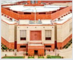
ବିରୋଧୀ ଦଳଙ୍କ ସହିତ ବିଚାରବିମର୍ଶ ଆରମ୍ଭ

■ ନୂଆଦିଲ୍ଲୀ, ୧୪ (ଏକେନି): ସଂସଦର ପ୍ରଥମ ଦିନରେ ଲୋକସଭା ଆସନ ସଂଖ୍ୟା ୮୧୬କୁ ବୃଦ୍ଧି କରିବା ସହିତ ମହିଳାଙ୍କ ପାଇଁ ୨୭୩ ଆସନ ସଂରକ୍ଷିତ ରଖିବା ଲାଗି ଯୋଜନା କରାଯାଇଛି ବୋଲି କେନ୍ଦ୍ର ସରକାର। ଏଥିପାଇଁ ଚଳିତ ମାସ ସଂସଦରେ ସମ୍ବିଧାନ ସଂଶୋଧନ ବିଲ୍ ଆଗତ କରିବେ। ତେଣୁ ସଂସଦର ବଜେଟ୍ ଅଧିବେଶନକୁ ଆସନ୍ତାକାଲି ଗୁରୁବାର ଦିନ ଅନିର୍ଦ୍ଧିଷ୍ଟ କାଳ ପାଇଁ ମୁଲତବା ନକରି ଏହାର ଅବଧିକୁ ବୃଦ୍ଧି କରିପାରିବ। ସରକାରଙ୍କ ପକ୍ଷରୁ ଏହି ପଦକ୍ଷେପ ଆନୁଷ୍ଠାନିକ ଭାବେ କିଛି କୁହାଯାଇନଥିଲେ ମଧ୍ୟ ଏଭଳି ଯୋଜନା ଚାଲିଥିବା ସଂସଦରେ ନିର୍ଦ୍ଦେଶଦେୟ ସୂତ୍ରରୁ ଜଣାପଡ଼ିଛି।