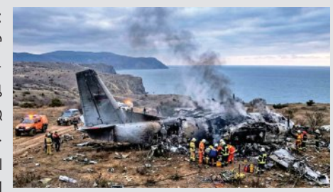
ରୁଷର ଏକ ସାମରିକ ପରିବହନ ବିମାନ ଏବନ୍-୨୬ କ୍ରିମିଆରେ ଦୁର୍ଘଟଣାଗ୍ରସ୍ତ ହୋଇଛି। ଏହି ଦୁର୍ଘଟଣାରେ ବିମାନରେ ଥିବା ସମସ୍ତ ୩୫ ଜଣଙ୍କର ମୃତ୍ୟୁ ଘଟିଛି।

■ ମସ୍କୋ, ୧୪ (ଏକେନି): ରୁଷର ଏକ ସାମରିକ ପରିବହନ ବିମାନ ଏବନ୍-୨୬ କ୍ରିମିଆରେ ଦୁର୍ଘଟଣାଗ୍ରସ୍ତ ହୋଇଛି। ଏହି ଦୁର୍ଘଟଣାରେ ବିମାନରେ ଥିବା ସମସ୍ତ ୩୫ ଜଣଙ୍କର ମୃତ୍ୟୁ ଘଟିଛି। ବିମାନରେ ୨୯ ଜଣ ଯାତ୍ରୀ ଓ ୬ ଜଣ କ୍ରୁ ସଦସ୍ୟ ଥିଲେ। ରୁଷର ନ୍ୟୁକ୍ଲିୟର ଡାକ୍ତରୀ ଅନୁଯାୟୀ, ପ୍ରଥମ ବିମାନ ସହ ଯୋଗାଯୋଗ ବିଚ୍ଛିନ୍ନ ହୋଇଥିଲା ଏବଂ ପରେ ଏହା ଏକ ପାହାଡ଼ରେ ପଡ଼ି ହୋଇ ତୁରନ୍ତ ନଷ୍ଟ ହୋଇଥିଲା। ପ୍ରାଥମିକ ତଦନ୍ତରୁ ଏହା ଏକ ବୈଷୟିକ ତ୍ରୁଟି ଯୋଗୁଁ ଦୁର୍ଘଟଣାଗ୍ରସ୍ତ ହୋଇଥିବା ଅନୁମାନ କରାଯାଇଛି। ତଥାପି ଏହାର ତଦନ୍ତ ଜାରି ରହିଛି। ଏବନ୍-୨୬ ବିମାନ ସୋଭିଏତ ସମୟର ଏକ ପୁରୁଣା ସାମରିକ ପରିବହନ ବିମାନ, ଯାହାକୁ ଏଣ୍ଡୋନୋଭ କମ୍ପାନୀ ତିଆରି କରିଥିଲା। ଏହି ବିମାନ ପ୍ରଥମେ ୧୯୬୯ରେ ଉଡ଼ାଣ କରିଥିଲା।