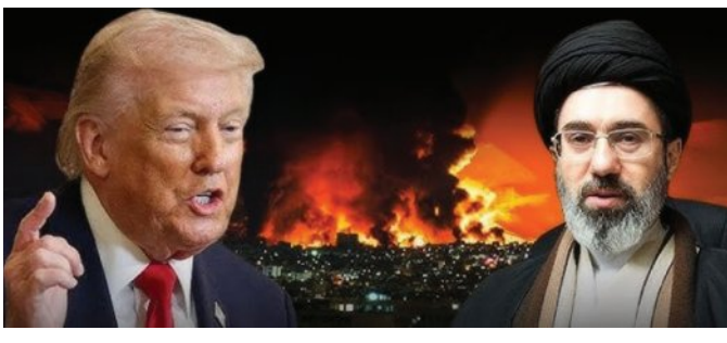
କହିଛି ଯେ ଯୁଦ୍ଧବିରତି ପାଇଁ ଇରାନ କୌଣସି ପ୍ରସ୍ତାବ ଦେଇନାହିଁ। ତ୍ରୁଟି ମିଛ କହୁଛନ୍ତି ବୋଲି ଇରାନ ବିଦେଶିକ

■ ଖାଫିଜ୍, ୧୪ (ଏକେନି): ମଧ୍ୟପ୍ରାଚ୍ୟରେ ଚାଲିଥିବା ଇରାନ-ଆମେରିକା-ଇସ୍ରାଏଲ ଯୁଦ୍ଧ ଭବିଷ୍ୟତକୁ ନେଇ ଅନିଶ୍ଚିତତା ଲାଗି ରହିଛି। ତୁଳ ତିନି ସପ୍ତାହ ମଧ୍ୟରେ ଯୁଦ୍ଧକୁ ଆମେରିକା ଓ ଇରାନ ଦ୍ୱାରା ରାଷ୍ଟ୍ରପତି ତ୍ରୁଟି ସୂଚନା ଦେଲା ପରେ ଆଜି କହିଥିଲେ ଯେ ଇରାନ ଯୁଦ୍ଧବିରତି ପାଇଁ ପ୍ରସ୍ତାବ ଦେଇଛି। ତେବେ ହର୍ମୁକ୍ ଖୋଲିଲେ ଯାଇ ଯୁଦ୍ଧବିରତି ସମ୍ଭବ ବୋଲି କହିଥିଲେ। କିନ୍ତୁ ଇରାନ ଆଜି ତ୍ରୁଟି ଏହି ଦାବିକୁ ଖାରଜ କରିଦେଇ