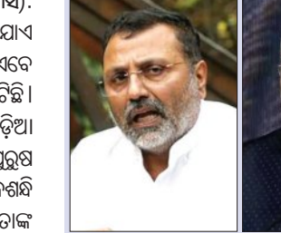
ବିଜୁବାବୁ ରାଷ୍ଟ୍ରନାୟକ ଥିଲେ ଓ ରହିବେ: ହୁଏ

■ ନୂଆଦିଲ୍ଲୀ/ ଭୁବନେଶ୍ୱର, ୧୪ (ସମିଦ): ନିଆଁରେ ଯୋଡ଼ିଲେ ସୁନା ଶୁଦ୍ଧତା କରି ଯାଏ ନାହିଁ, ବରଂ ଏହା ଅଧିକ ଜୀବନ୍ତମାନ ହୁଏ। ଏବେ ବିଜୁ ପଟ୍ଟନାୟକଙ୍କ କ୍ଷେତ୍ରରେ ଠିକ୍ ତାହାହିଁ ରହିଛି। ପ୍ରଶ୍ନର ରାଷ୍ଟ୍ରବାଦୀ, ସ୍ୱାଧୀନତା ସଂଗ୍ରାମୀ, ଓଡ଼ିଆ ଅଭିଭାବକ ପ୍ରଚ୍ଛନ୍ନ ପ୍ରବନ୍ଧକ, ଓଡ଼ିଆ ପ୍ରାଣପ୍ରଦାନ ପ୍ରବନ୍ଧକ ବିଜୁ ପଟ୍ଟନାୟକଙ୍କ ପରଲୋକ ତିନି ଦଶନ୍ଧି ପରେ ବିଜେପି ସଂସଦ ନିଶିକାନ୍ତ ହୁଏ ତାଙ୍କ ସମ୍ପର୍କରେ ଦେଖିଥିବା ଅକଥ୍ୟ ଓ ଗୁଣ୍ୟ ମନ୍ତବ୍ୟ ବିଜୁ ପଟ୍ଟନାୟକଙ୍କ ବ୍ୟକ୍ତିତ୍ୱକୁ ଅଧିକ ଉଜ୍ଜ୍ୱଳ କରିଛି। ଓଡ଼ିଶାରେ ଏହାକୁ ନେଇ ଦଳମତ ନିର୍ବିଶେଷରେ ଚାନ୍ଦୁ ବିରୋଧୀ ହୋଇଛି। ବିଧାନସଭାରେ ଏହାକୁ ନେଇ ନିନ୍ଦା ପ୍ରସ୍ତାବ ଆସିଛି। ଦେଶର ପ୍ରାୟ ସବୁ ରାଜନୈତିକ ଦଳ, ଏପରିକି ନିଶିକାନ୍ତ ଦଳର ଅନେକ ନେତା ମଧ୍ୟ ବିଜୁଙ୍କ ପ୍ରତି ଏପରି ମନ୍ତବ୍ୟକୁ ଗ୍ରହଣ କରିନାହାନ୍ତି। ସଂସଦ ଓ ସଂସଦ ବାହାରେ ବିଭିନ୍ନ ରାଜନୈତିକ ଦଳଗୁଡ଼ିକ ନିଶିକାନ୍ତଙ୍କୁ ଭଜନା କରିଛନ୍ତି। ବିଜୁବାବୁ କେବଳ ଓଡ଼ିଶାର ରତ୍ନ