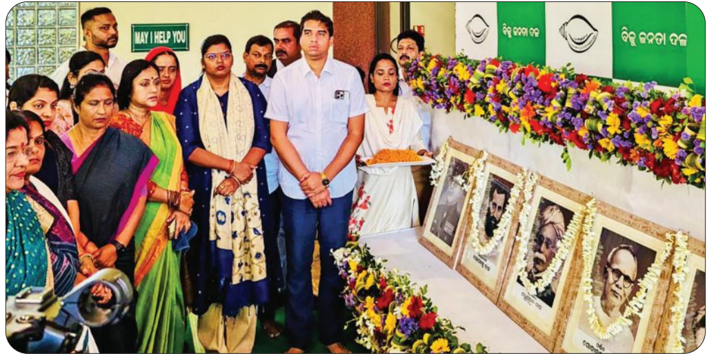
ପବିତ୍ର ଓଡ଼ିଶା ଦିବସ ଅବସରରେ ବୁଧବାର ଶଙ୍ଖ ଭବନରେ ବିଜୁ ଜନତା ଦଳ ପକ୍ଷରୁ ସ୍ୱତନ୍ତ୍ର ଓଡ଼ିଶା ପ୍ରଦେଶ ଗଠନ ମହାନ ବରପୁତ୍ରମାନଙ୍କ ପ୍ରତିମୂର୍ତ୍ତିରେ ପୁଷ୍ପମାଲ୍ୟ ଅର୍ପଣ କରାଯାଇଛି ।