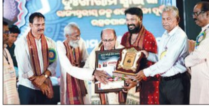
ଜନ୍ମଦିନ ପୂର୍ବରୁ ପାଠକ ଓ ପ୍ରତିମୂର୍ତ୍ତି ସ୍ଥାପନ ନେଇ ଓଡ଼ିଆ ଭାଷା ସାହିତ୍ୟ ଓ ସଂସ୍କୃତି ମନ୍ତ୍ରାଳୟ ଭେଟି ଆଲୋଚନା କରିବା ବୋଲି ପ୍ରତିଶ୍ରୁତି ଦେଇଥିଲେ।