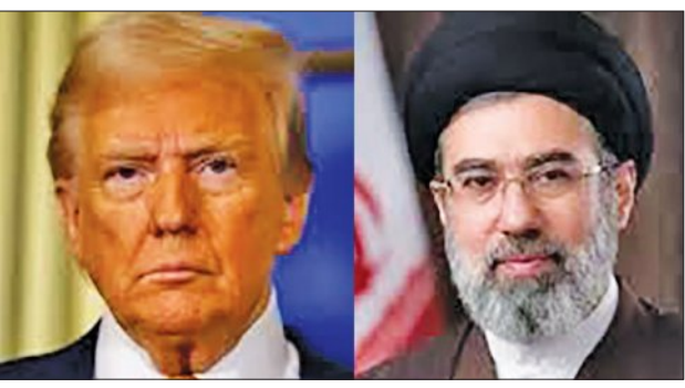
ହୋଇପାରେ ବୋଲି ସଙ୍କେତ ମିଳିଛି । ଦ୍ଵିତୀୟ ପର୍ଯ୍ୟାୟ ଆଲୋଚନା ପାଇଁ ସ୍ଥାନ ମୁଖ୍ୟ ପ୍ରସଙ୍ଗ ହୋଇଛି । ଏଥିପାଇଁ ଇସଲାମାବାଦ ଏବଂ ଜେନେରାଲ ସମ୍ଭାବ୍ୟ ସ୍ଥାନ ଭାବେ ବିଚାର କରାଯାଇଛି । ପୂର୍ବରୁ ହୋଇଥିବା ଆଲୋଚନାରେ ଆମେରିକାର ପ୍ରତିନିଧି ଦଳର ନେତୃତ୍ଵ

ଆଲୋଚନା ହେବାର ସମ୍ଭାବନା ସୃଷ୍ଟି ହୋଇଛି । ଅସ୍ତବିରତି ଶେଷ ହେବା ପୂର୍ବରୁ କୃତ୍ରିମ ପାଇଁ ଲକ୍ଷ୍ୟ ରହିଛି । ଦୁଇ ଦେଶ ମଧ୍ୟରେ ବର୍ତ୍ତମାନ ଦୁଇ ସପ୍ତାହର ଅସ୍ତବିରତି ରହିଛି, ଯାହାର ଅନ୍ତ ଏପ୍ରିଲ ୨୧ରେ ଶେଷ ହେବ । ଏହି ସମୟ ସମୟ ପୂର୍ବରୁ ଏକ ସ୍ଥାୟୀ ସମାଧାନ ବାହାର କରିବାକୁ ଉଭୟ ଆମେରିକା ଏବଂ ଚେହେରାନ ବିଚାର କରୁଥିବା ଜଣାପଡ଼ିଛି । ଆମେରିକା ରାଷ୍ଟ୍ରପତି ଜୋନାହୁ ଗ୍ରମ୍ପ ସୂଚନା ଦେଇଛନ୍ତି ଯେ, ଇରାନ ପକ୍ଷରୁ ବୁଝାମଣା ପାଇଁ ଆଗ୍ରହ ପ୍ରକାଶ ପାଇଛି । ଯଦି ଇରାନ ଆମେରିକାର ସର୍ବଗୁଡ଼ିକୁ ମାନିବାକୁ ପ୍ରସ୍ତୁତ ହୁଏ, ତେବେ ସେ ବ୍ୟକ୍ତିଗତ ଭାବେ ଆଲୋଚନାରେ ସାମିଲ