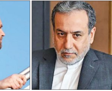
ପକ୍ଷ ମଧ୍ୟରେ ୧୫-୬ ବର୍ଷର ଏକ ମଧ୍ୟବର୍ତ୍ତୀକାଳୀନ ସମୟସୀମା ଉପରେ ସହମତି ହେବାର ସମ୍ଭାବନା ଏବେ ମଧ୍ୟ ରହିଛି ବୋଲି କହିଛନ୍ତି । ସ୍ଵତ୍ଵ ଅନୁଯାୟୀ, ଇସଲାମାବାଦର ସେରେନା ହୋଟେଲରେ ପ୍ରାୟ ୨୦ ଘଣ୍ଟା ଧରି ମାରାଥନ ବୈଠକ ହୋଇଥିଲା । ଏଥିରେ

ନୂଆଦିଲ୍ଲୀ, ୧୫୪୪(ଏକେଡ୍): ପାକିସ୍ତାନର ଇସଲାମାବାଦରେ ଆମେରିକା ଏବଂ ଇରାନ ମଧ୍ୟରେ ଅନୁଷ୍ଠିତ ଏତିହାସିକ ଆଲୋଚନା କୌଣସି ନିଶ୍ଚିତ ସମାଧାନ ଦିନା ଶେଷ ହୋଇଛି । ଇରାନର ପରମାଣୁ କାର୍ଯ୍ୟକ୍ରମ ଏବଂ ବିଶେଷ କରି ଯୁରାନିୟମ ସମ୍ପ୍ରସାରଣକୁ ସ୍ଥିତି ରଖିବା ସମୟସୀମା ଉପରେ ଦୁଇ ଦେଶ ମଧ୍ୟରେ ଆଲୋଚନା ହୋଇଥିଲା । ଏନେଇ ଦୁଇ ଦେଶ ମଧ୍ୟରେ ରହିଥିବା ବଡ଼ ଧରଣର ମତଭେଦ ଆଲୋଚନାରେ ମୁଖ୍ୟ ପ୍ରତିବନ୍ଧକ ସାଜିଥିଲା । ଆମେରିକା ଇରାନର ଯୁରାନିୟମ ସମ୍ପ୍ରସାରଣ କାର୍ଯ୍ୟକ୍ରମ ଉପରେ ଅତି କମରେ ୨୦ ବର୍ଷର ପ୍ରତିବନ୍ଧକ ଜରାଜରାକୁ ପ୍ରସ୍ତାବ ଦେଇଥିଲା । କିନ୍ତୁ ଚେହେରାନ ଏହାକୁ ପ୍ରତ୍ୟାଖ୍ୟାନ କରିଥିଲା ଏବଂ କେବଳ ୫ ବର୍ଷ ପାଇଁ ଏହି କାର୍ଯ୍ୟକ୍ରମକୁ ସ୍ଥିତି ରଖିବାକୁ ପ୍ରସ୍ତାବ ଦେଇଥିଲା । ଆମେରିକାର ଚାପ ସତ୍ତ୍ଵେ ଇରାନ ଏହି ସମୟସୀମା ବଢ଼ାଇବାକୁ ମନା କରିଦେଇଛି । ତେବେ ରାଜନୀତି ବିଶ୍ଵାସର ଉପାଦାନ ଦ୍ଵୟ