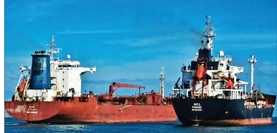
ପକ୍ଷକୁ ପେରିଯାଇଥିଲା, କିନ୍ତୁ କିଛି ଘଣ୍ଟା ପରେ ନିଜର ଚୀନ୍ ମାଲିକାନା ଏବଂ ଚୀନ୍ କୁ ଥିବା ଜଣାଇ ପୁଣି ଯାତ୍ରା ଆରମ୍ଭ କରିଥିଲା । ଏହା ସହିତ 'ଏଲପିଏ' ନାମକ ଅନ୍ୟ ଏକ ଟ୍ୟାଙ୍କର ମଧ୍ୟ ହର୍ମୁଜ ପ୍ରଣାଳୀ ଅତିକ୍ରମ କରିଥିବା ରିପୋର୍ଟ ମିଳିଛି । ଏହି ଅବରୋଧ ଯୋଗୁଁ ଇରାନ ଦୈନିକ ପ୍ରାୟ ୪୩୫ ନିୟୁତ ଡଲାର

ଚେହେରାନ, ୧୫୪୪(ଏକେଡ୍): ଇରାନର ତେଲ ରପ୍ତାନି ଉପରେ ଆମେରିକା ରାଷ୍ଟ୍ରପତି ଜୋନାହୁ ଗ୍ରମ୍ପଙ୍କ ନୂତନ ନୌସେନା ଅବରୋଧକୁ ଏକ ବଡ଼ ଆହ୍ଵାନ ମିଳିଛି । ଚୀନ୍ ସହିତ ସମ୍ପୃକ୍ତ ଏବଂ ଆମେରିକା ଦ୍ଵାରା ପ୍ରତିବନ୍ଧିତ ଏକ ତେଲ ଟ୍ୟାଙ୍କର 'ରିଭ୍ ୱାରି' ହର୍ମୁଜ ପ୍ରଣାଳୀ ଦେଇ ଗତି କରି ଏହି ଅବରୋଧର ଗଠାଠାକୁ ପରାସ୍ତ କରିଥିବା ଜଣାପଡ଼ିଛି । ପୂର୍ବରୁ 'ପୁଲ୍ ୱାରି' ନାମରେ ପରିଚିତ ଏହି ଟ୍ୟାଙ୍କରକୁ ଆମେରିକା କଳାତାଲିକାକୁ କରୁଥିଲା । ଇରାନ ବିରୋଧରେ ଆମେରିକା ପକ୍ଷରୁ ଥିବା ଶକ୍ତି ପ୍ରତିବନ୍ଧକକୁ ଅମାନ୍ୟ କରିବା ଅଭିଯୋଗରେ ଆମେରିକା ଏହି କାର୍ଯ୍ୟାନୁଷ୍ଠାନ ଗ୍ରହଣ କରିଥିଲା । ଗତ ସୋମବାର ଗ୍ରମ୍ପ ପ୍ରଣାଳୀର ଇରାନର ତେଲ ବିକ୍ରୟ କ୍ଷମତାକୁ ସୀମିତ କରିବା ପାଇଁ ଏହି ନୌସେନା ଅବରୋଧ ଆରମ୍ଭ କରିଛି । ଯାହା ବିଶ୍ଵ ଶକ୍ତି ବଜାରରେ ଉଲ୍ଲେଖନୀୟ ସୃଷ୍ଟି କରିଛି । ସୂଚନା ଅନୁଯାୟୀ, ରିଭ୍ ୱାରି ଜାହାଜଟି ଗତ ୨୪ ଘଣ୍ଟା ମଧ୍ୟରେ ଦ୍ଵିତୀୟ ଥର ପାଇଁ ପାରସ୍ୟ ଉପସାଗରରୁ ବାହାରିବାକୁ ଚେଷ୍ଟା କରିଥିଲା । ଅବରୋଧ କାର୍ଯ୍ୟକାରୀ ହେବା ମାତ୍ରେ ଜାହାଜଟି ପ୍ରଥମେ