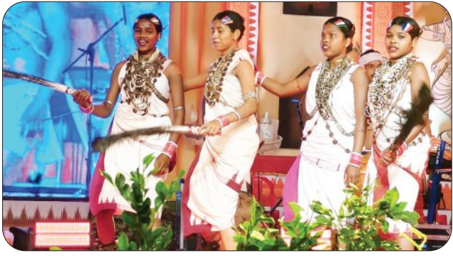
ବୁଦ୍ଧପୁର, ୧୦/୪