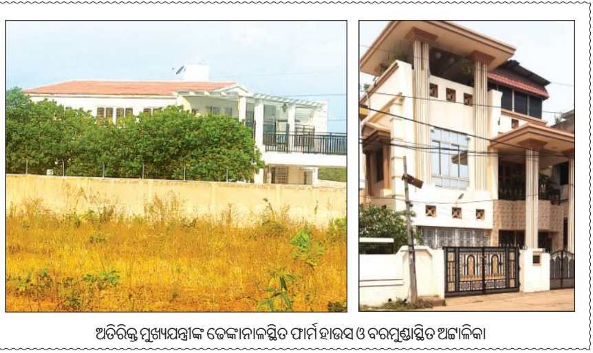
ଅତିରିକ୍ତ ମୁଖ୍ୟଯତ୍ନଙ୍କ ଢେଙ୍କାନାଳସ୍ଥିତ ପାର୍ମି ହାଉସ୍ ଓ ବରମୁଣ୍ଡାସ୍ଥିତ ଅବାଳିକା