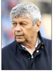
୫ ଦିନ ତଳେ ଛାଡ଼ିଥିଲେ ରୋମାନିଆ ଦଳ