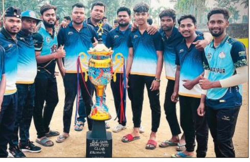
ପଲାଇ କାଲିଅଣ୍ଟି ପ୍ରିମିଅର ଲିଗ୍ ଚାମ୍ପିଅନ ହେଇଛି । ପାଇନାଲ ମ୍ୟାଚ୍ରେ ପଲାଇ ଦଳ ମାହାଙ୍ଗାର ଧରଳିଆ କ୍ରିକେଟ୍ କ୍ଲବ୍ ୮ ଓକେଟ୍ରେ ପରାସ୍ତ କରି ବିଜୟ ହୋଇଥିଲେ । ୬ ଓଭର ବିଶିଷ୍ଟ ମ୍ୟାଚ୍ରେ ପ୍ରଥମେ ଧରଳିଆ ଦଳ ବ୍ୟାଟିଂ କରି ୨୪ ରନ୍ କରିଥିଲେ ବେଳେ ମା'ମଙ୍ଗା ଦଳ