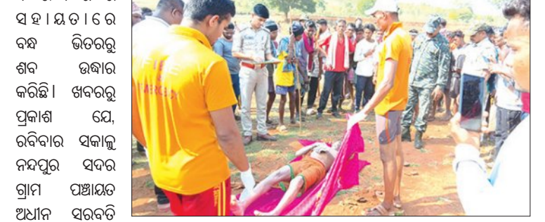
ଶୈବପାଇଁ ଯାଇ ବୁଡ଼ିଯାଇଥିଲେ।

ଶୈବପାଇଁ ଯାଇ ବୁଡ଼ିଯାଇଥିଲେ। ନନ୍ଦପୁର, ୨୦୧୪ (ସମ୍ପାଦନା): ଶୈବ ପାଇଁ ଯାଇ ବନ୍ଧୁ ଯୁବକଙ୍କ ଶବ ଉଦ୍ଧାର ହୋଇଛି।