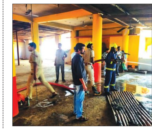
ଗାୟତ୍ରୀ ମନ୍ଦିରରେ ଘଟିଥିବା ଅଗ୍ନିକାଣ୍ଡର ଚିତ୍ର।

ତେଜୁକିଶ୍ୱରୀ ୨୦୧୪ (ସମ୍ପାଦନା): ନବରଙ୍ଗପୁର ଜିଲ୍ଲା ଇତ୍ୟାଦି ପ୍ରକଳ୍ପ ଅଞ୍ଚଳ ଖାତିଗୁଡ଼ା ସ୍ଥିତ ଗାୟତ୍ରୀ ମନ୍ଦିରରେ ନିଆଁ ଲାଗି ବ୍ୟାପକ କ୍ଷୟକ୍ଷତି ହୋଇଛି।