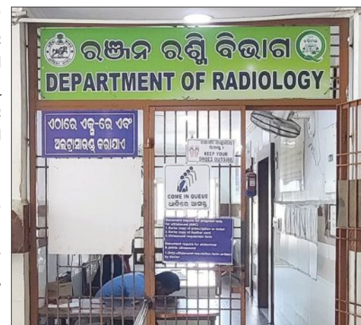
ଡିପାର୍ଟମେଣ୍ଟ ଅଫ ରାଡ଼ିଓଲୋଜିର ଉପର ଦିଆଯାଇଥିବା ଚିତ୍ର।

କିନ୍ତୁ ବୃହତ୍ ସଂଖ୍ୟାରେ ରୋଗୀଙ୍କୁ ଚିକିତ୍ସା ଦେବା ପାଇଁ ଡାକ୍ତରଙ୍କୁ ନିଯୁକ୍ତ କରିବାକୁ ନିର୍ଦ୍ଦେଶ ଦିଆଯାଇଛି।