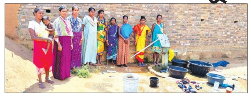
ସମ୍ପ୍ରଦାୟ ସଭାରେ ଉପସ୍ଥିତ ଲୋକମାନଙ୍କ ଚିତ୍ର।

ନବରଙ୍ଗପୁର/ନଦୀହାଣ୍ଡି, ୨୦୧୪ (ସମ୍ପାଦନା): ଗ୍ରାମ୍ୟ ଉଚ୍ଚ ଆରମ୍ଭ ନବରଙ୍ଗପୁର ଜିଲ୍ଲା ନଦୀହାଣ୍ଡି ବ୍ଲକ୍ ଅନ୍ତର୍ଗତ ନିଶିନାହାଣ୍ଡି ଗ୍ରାମପଞ୍ଚାୟତର ବାଣିଆ ଗ୍ରାମ ହରିଜନ ସାହିରେ ଦେଖାଦେଇଛି ପାନୀୟ ଜଳ ସଙ୍କଟ।